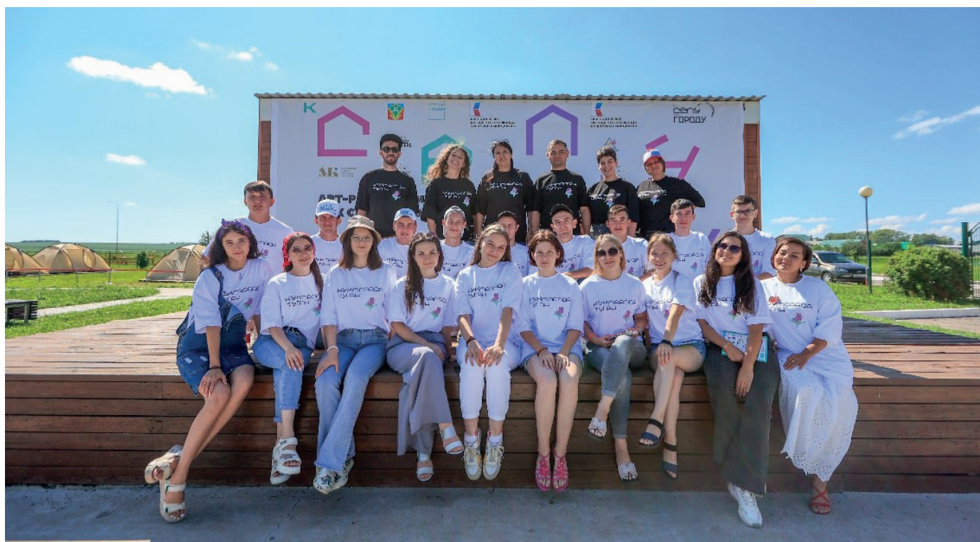
Команда первой арт-резиденции

Реклама проекта шла через интернет. Мы приглашали к участию в проекте творческих, талантливых молодых музыкантов, архитекторов и экскурсоводов из районов республики от 14 до 35 лет.