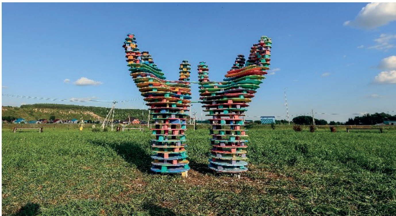
Арт-объект «Руки» сейчас украшает парк имени Н.В.Хусаинова

Также ежедневно участники арт-резиденции «И к селу, и городу» создавали проекты в 3-х направлениях: «Паблик арт», «Этно фьюжн», «Локал хистори». Это был самый творческий блок проекта.