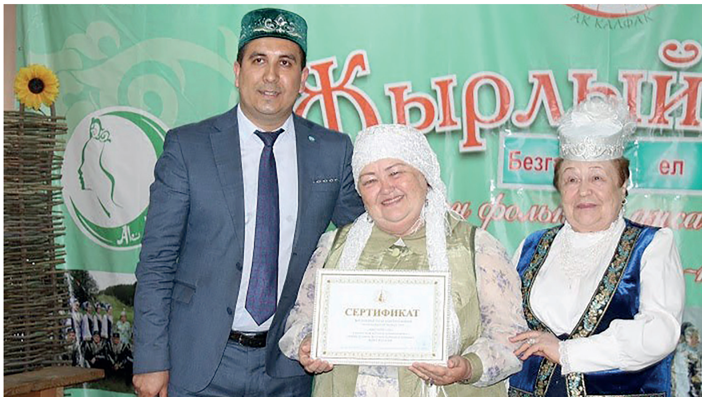
Мы - победители фестиваля «Жырлыйк эле»

На суд жюри и зрителей фестиваля «Түгәрәк уен» мы представили фольклорную постановку «Чишмә бәрдерту» на основе этноматериала, собранного в селах Разаевка, Кунаулово, Кенгер-Менеуз. Здесь мы показали и обряд пробивания родника, и сцену чистку самоваров у родника. Все реквизиты