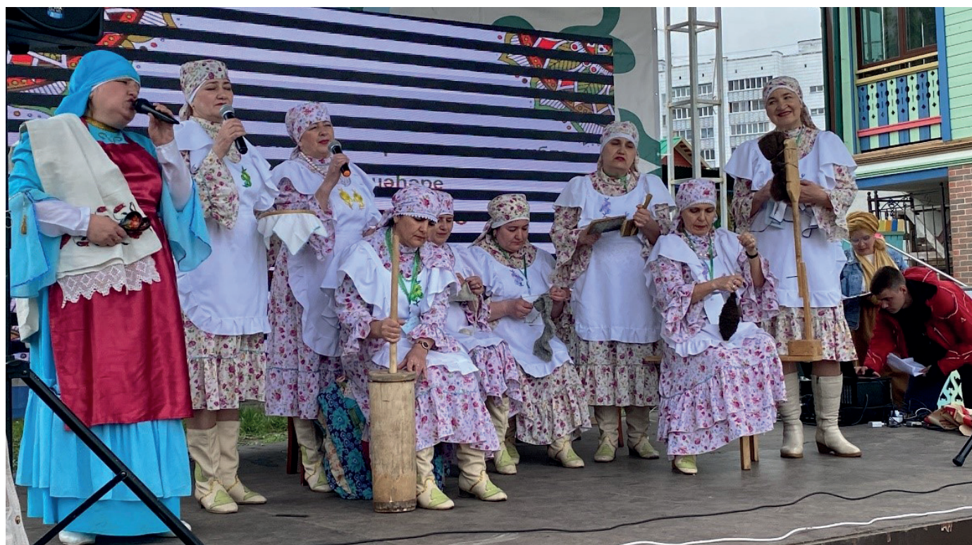
Выступление на «Илаһи моң», 2022 г.