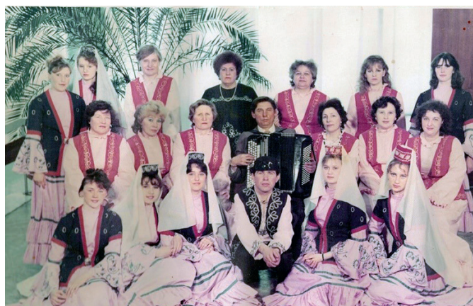
«Умырзая», 1992 год

телями и аккомпаниаторами «Умырзая» (оба заслуженные работники культуры Республики Мордовия).