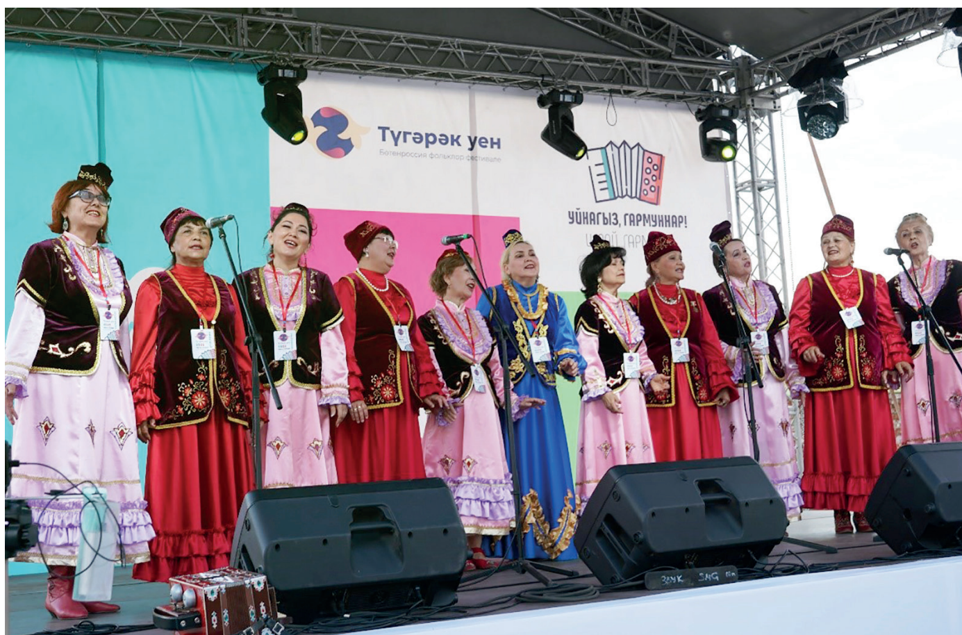
Мы на сцене Казанского Кремля