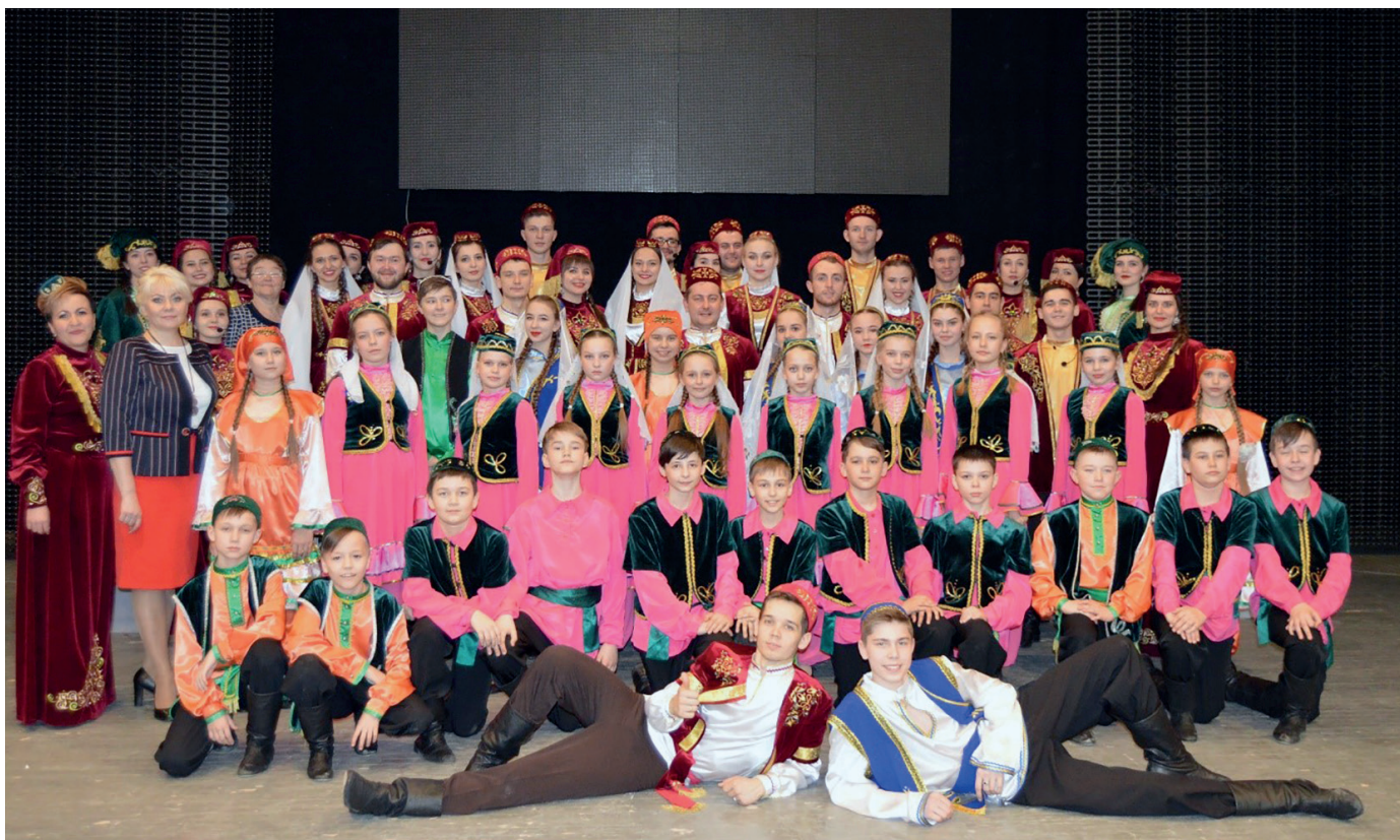
Наш большой коллектив

вокально-хореографического конкурса «Патриоты России» г. Казань (2020 г.), неоднократно становился лауреатом Республиканского фестиваля народного творчества «Шумбрат, Мордовия!», а также лауреатом Республиканского конкурса татарской песни «Авылым тавышлары».