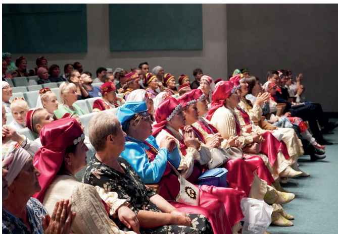
В ожидании решения жюри

В «Түгәрәк уен» мы уже участвовали в 2019 году. В этом году привезли на суд зрителей и жюри баит «Җиде кыз бәете» («Баит семи девушек»), записанный в селе Татар-