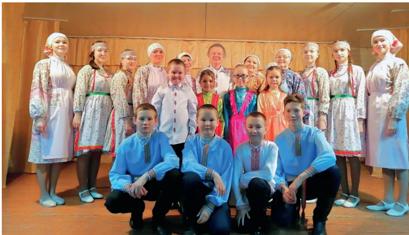
Коллектив «Кадряк сем»