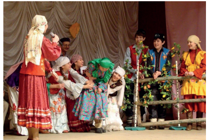
Выступление коллектива «Жәүһәр» в Осиново

Вместе с проведением фестиваля совершенствовал свое мастерство и наш коллектив «Жәүһәр». Еще в 2015 году коллек-