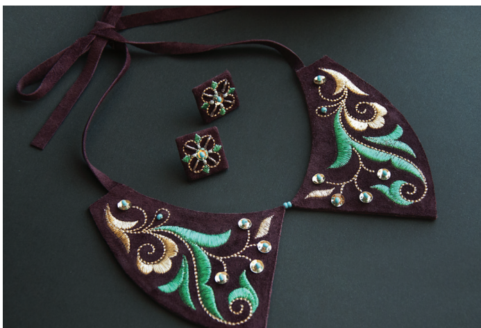
Воротник накладной и серьги. Художник А. Мусавирова. 2020-е гг.