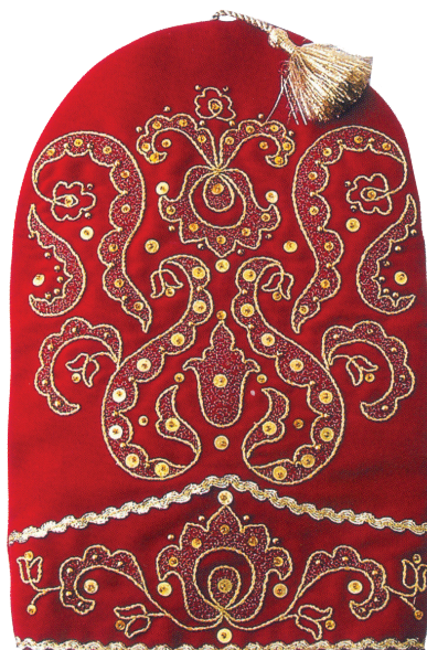
Калфак. Художник А. Кудряшова. 2000-е гг.

привозные ткани (камка, бархат, тафта, атлас).