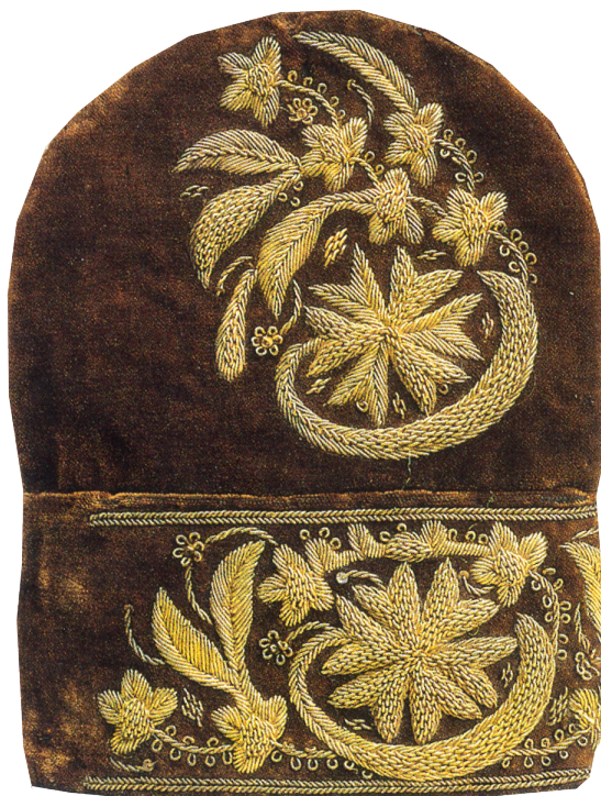
Калфак. Вторая половина XIX в. Государственный музей изобразительных искусств РТ

Судя по уникальным археологическим находкам в г. Болгаре фрагментов шелко-