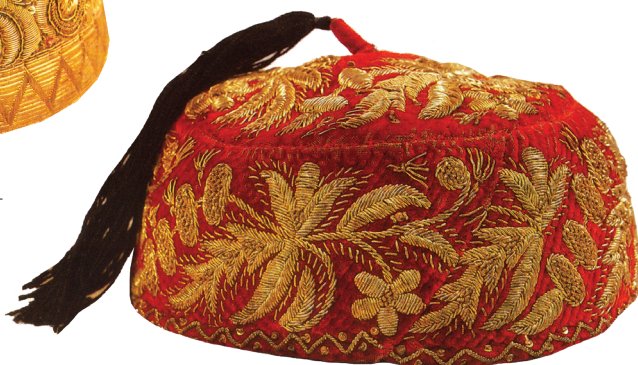
Тюбетейка с кисточкой.

XIX в. Государственный музей изобразительных искусств РТ