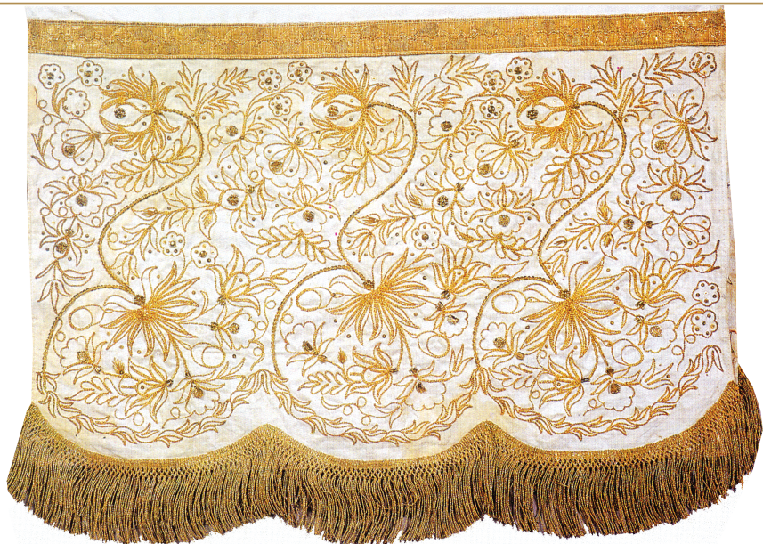
Свадебное полотенце «Казан сөлгесе». Фрагмент. XIX в. Государственный музей изобразительных искусств РТ