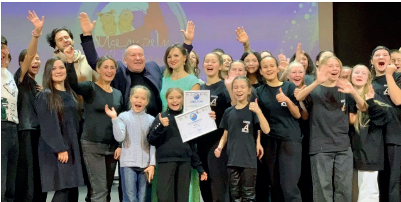
А так мы радовались на церемонии награждения

Жюри фестиваля высоко оценило наш спектакль, и мы завоевали Гран-при.