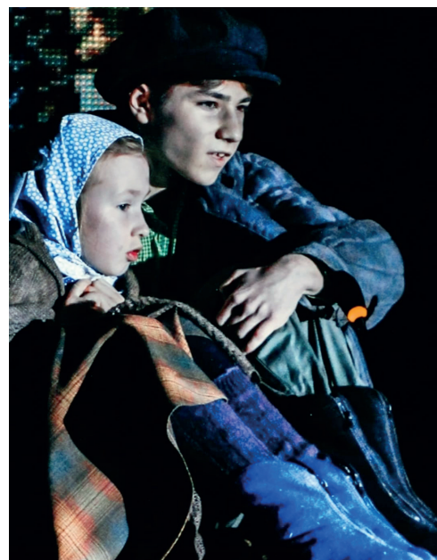
Сцена из спектакля «Саша»