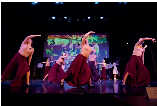
Сцены из спектакля «Не отнимай у себя завтра»