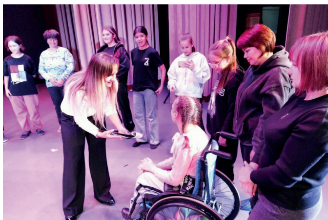
На мастер-классе в рамках проекта «ART Перезагрузка: фокус на стратегию счастья»

Я горжусь своими выпускниками, многие из которых выбрали актерскую профессию.