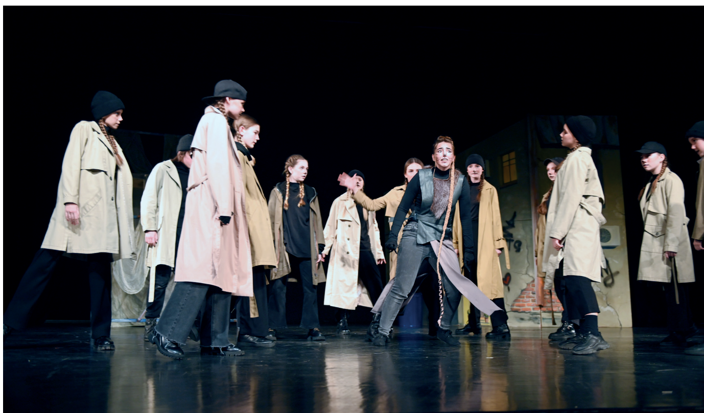
Сцены из спектакля «Дорога домой».

Премьера спектакля состоялась при полном аншлаге на родной для коллектива сцене в Культурно-досуговом центре, где ребята чувствуют себя уверенно как дома. На Фестивале-конкурсе детско-юношеских театральных коллективов и студий «Иделкәем & Кариев варислары» за спектакль «Дорога домой» нам присвоено высокое звание лауреатов I степени в номинации «Музыкальный театр».