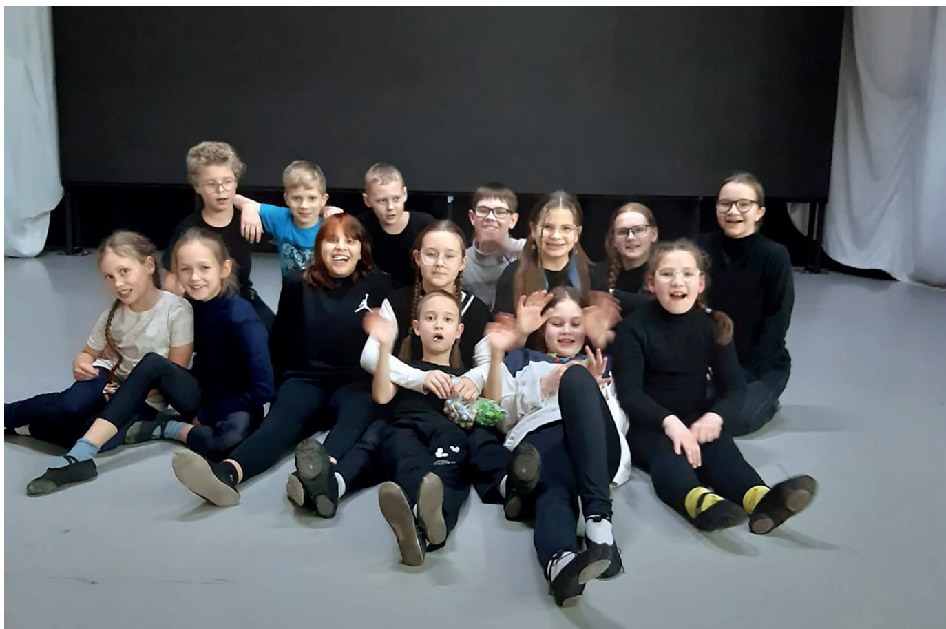
Средняя группа коллектива «ТВОРЦЫ»

В настоящее время в студии 4 возрастные группы, в которых 63 участника, из них 19 мальчиков и 44 девочки в возрасте от 7 до 17 лет