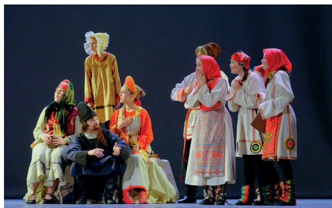
Сцена из спектакля «Во Балда!» по сказке А.С. Пушкина «Сказка о попе и работнике Балде»

Ребята театральной студии постоянные участники концертов и конкурсов художественного слова. Поэтому у каждого из них в репертуаре есть стихи и монологи русских, зарубежных и современных авторов.