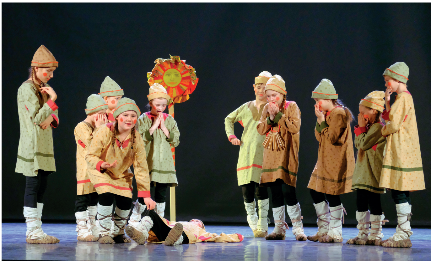
Сцена из скоморошьей потешки «Вани Вятчане»

Первый состав коллектива подобрался примерно одного возраста — подростки 14-16 лет. Изначально, мы начали работать над спектаклями малой формы. Но был объявлен районный конкурс по социальным спектаклям. Решили попробовать свои силы и стали победителями в своей номинации.