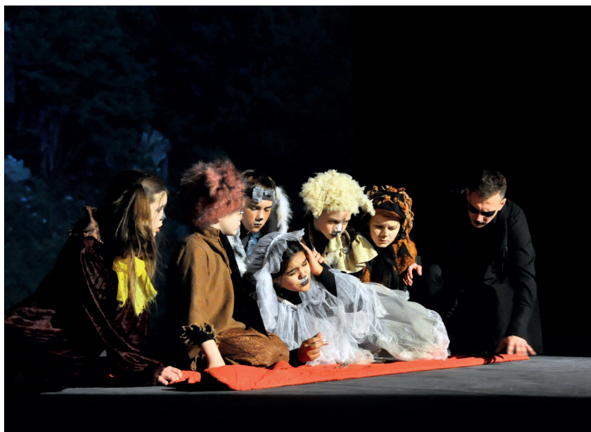
Сцена из спектакля «Прощай, овраг!»