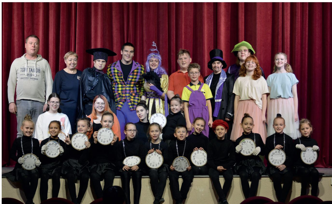
Участники спектакля по произведению Е. Шварца «Сказка о потерянном времени»