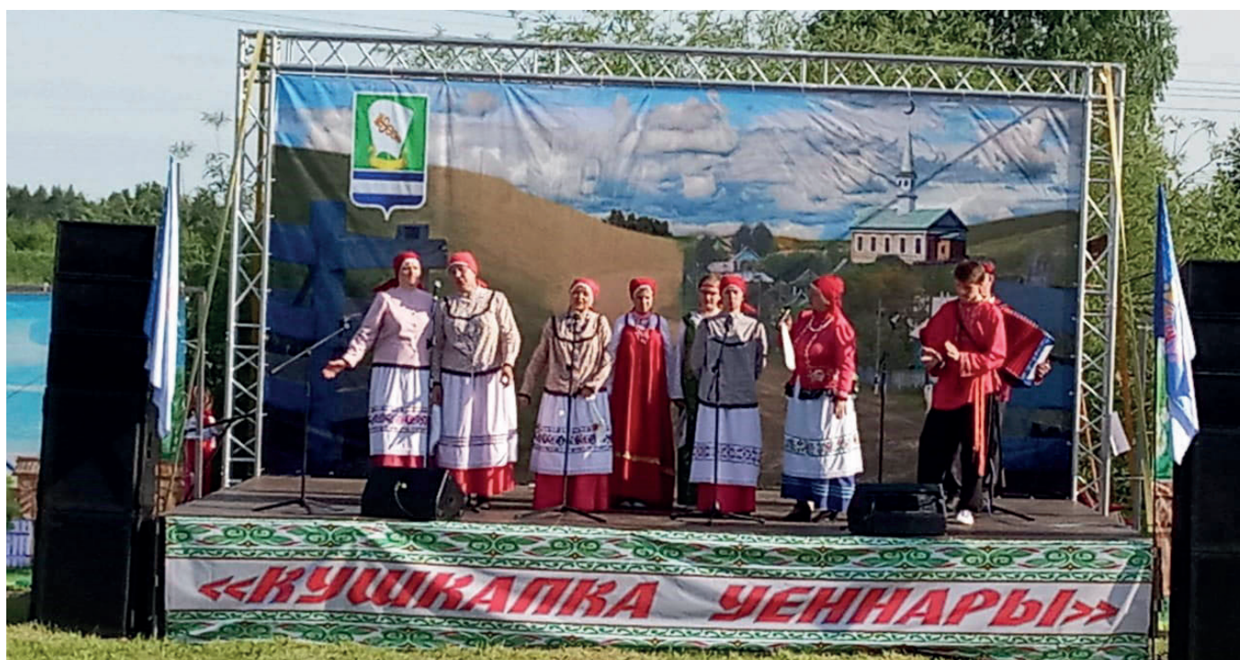
На фольклорном фестивале «Кушкапка уеннары»– «Игра у двойных ворот»

родные мои, спасибо вам, что помните эти песни! Ведь 30 лет назад, отдавая меня замуж, мне пели эти песни». Вот ради таких встреч и стоит работать и сохранять то, что мы еще не совсем потеряли из народной культуры.