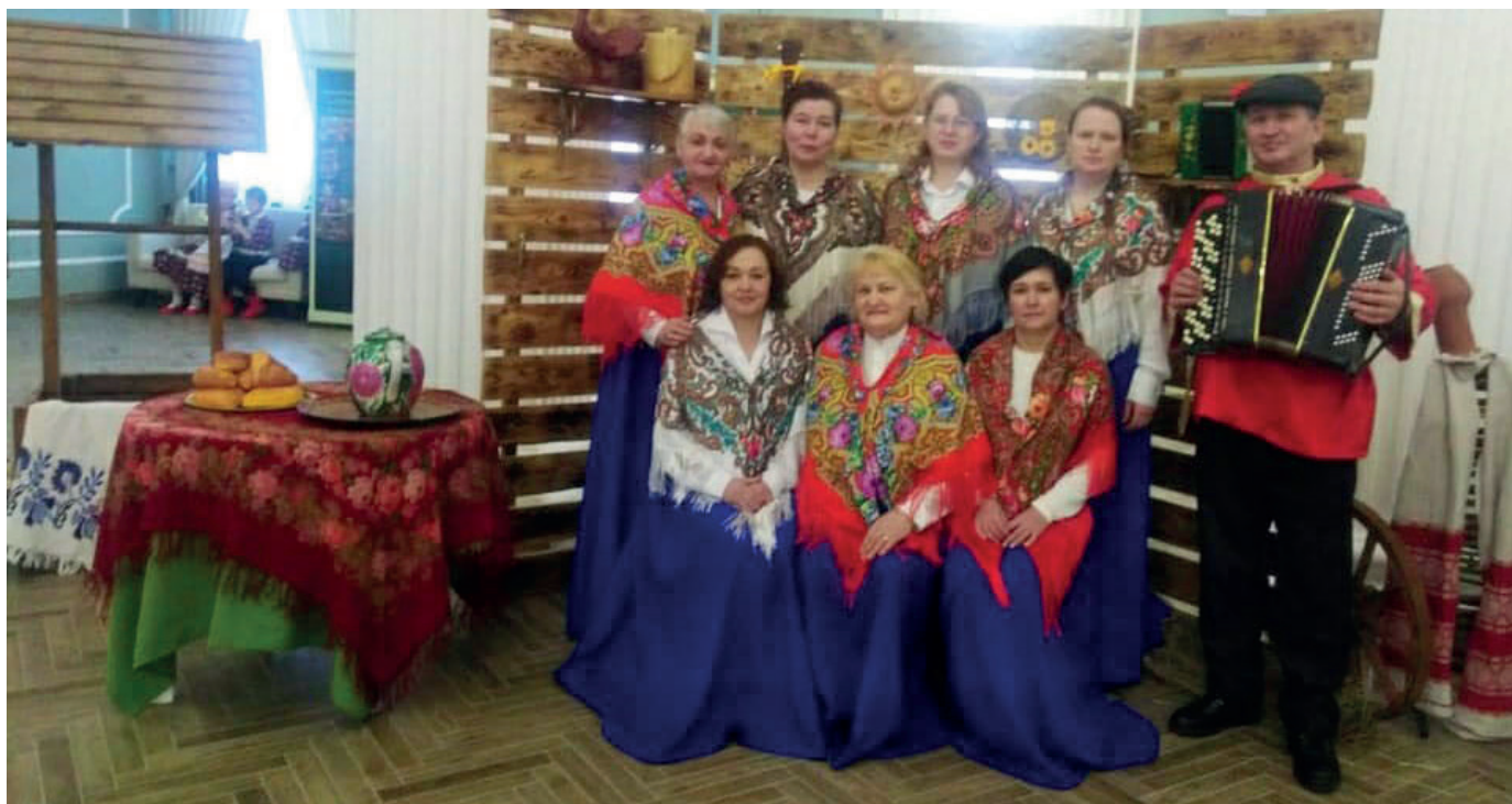
На Республиканском фестивале русской хоровой музыки им А.В.Коткова

Из 13 взрослых участников – 7 солистов, из детского коллектива – 5. У каждого солиста в репертуаре от трех и более песен.