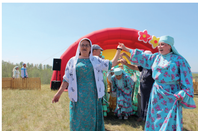
Национальная игра «Капкалы»