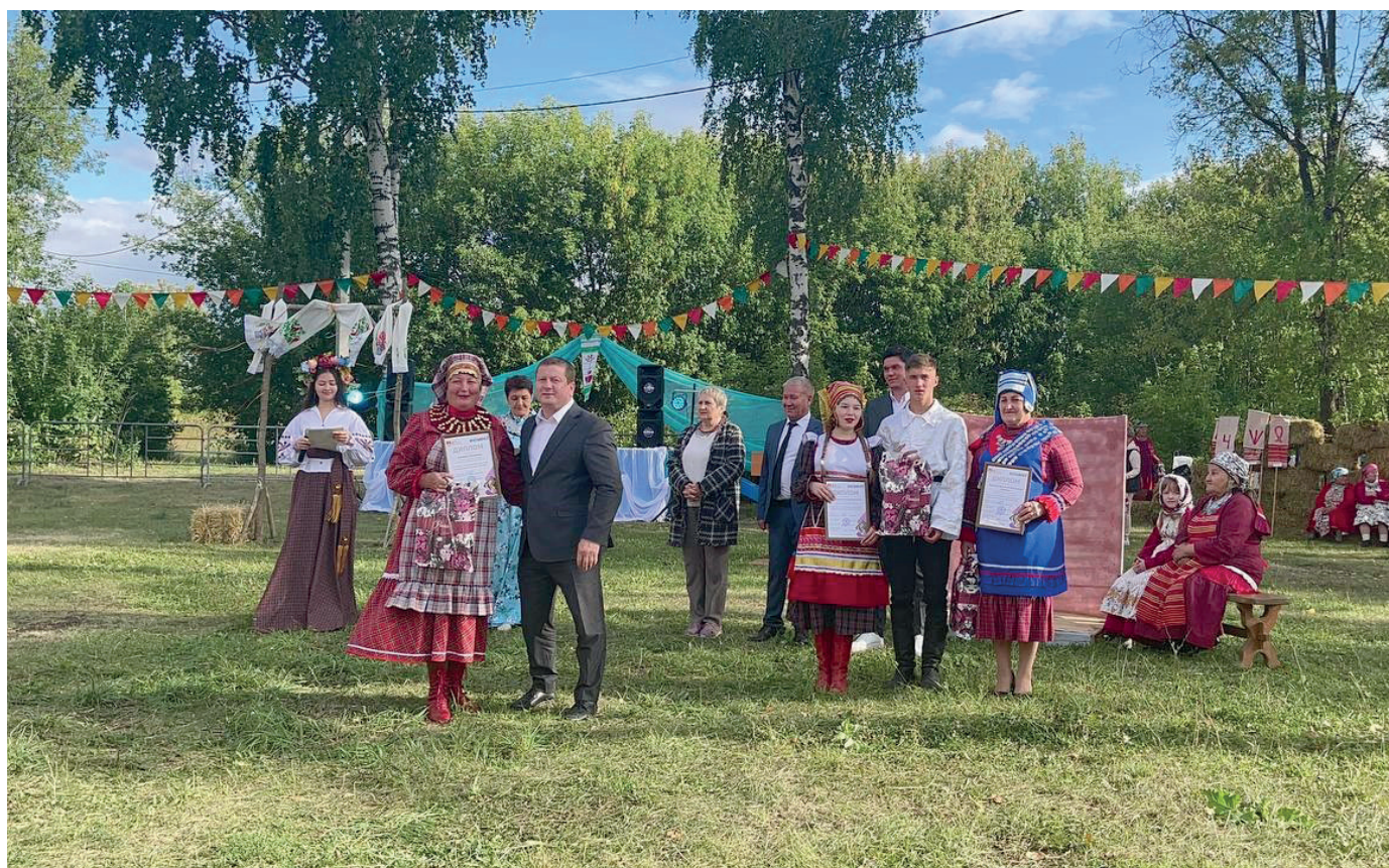
Награждение участников фестиваля