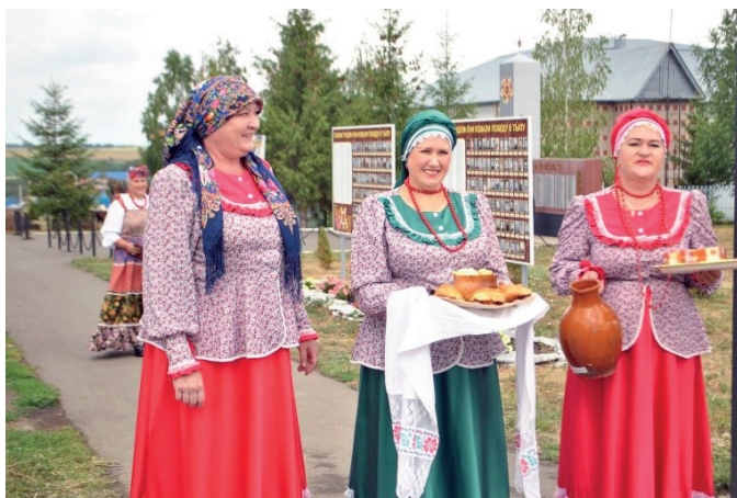
Встреча гостей в Слободе Архангельской