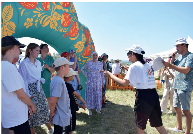
На молодежной поляне