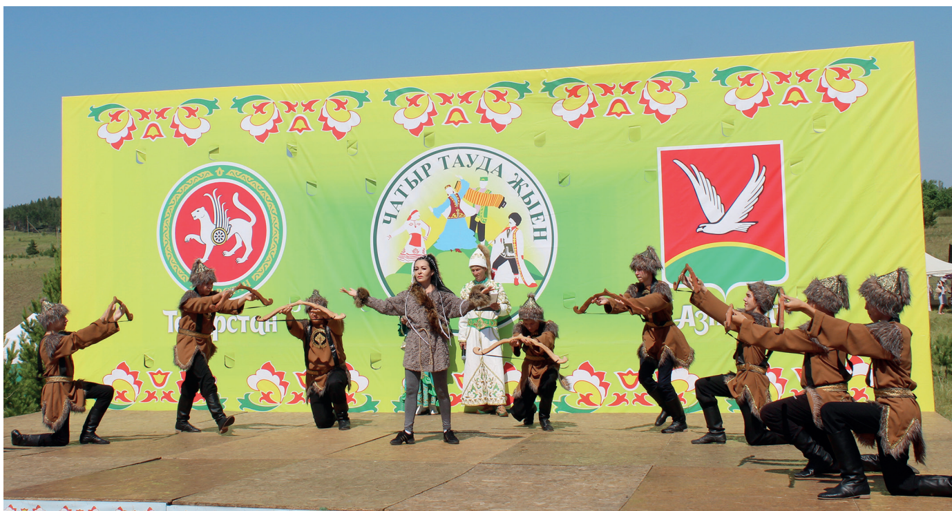
6 «Сцена из пролога театрализованного представления «Чатыр тау жиле»