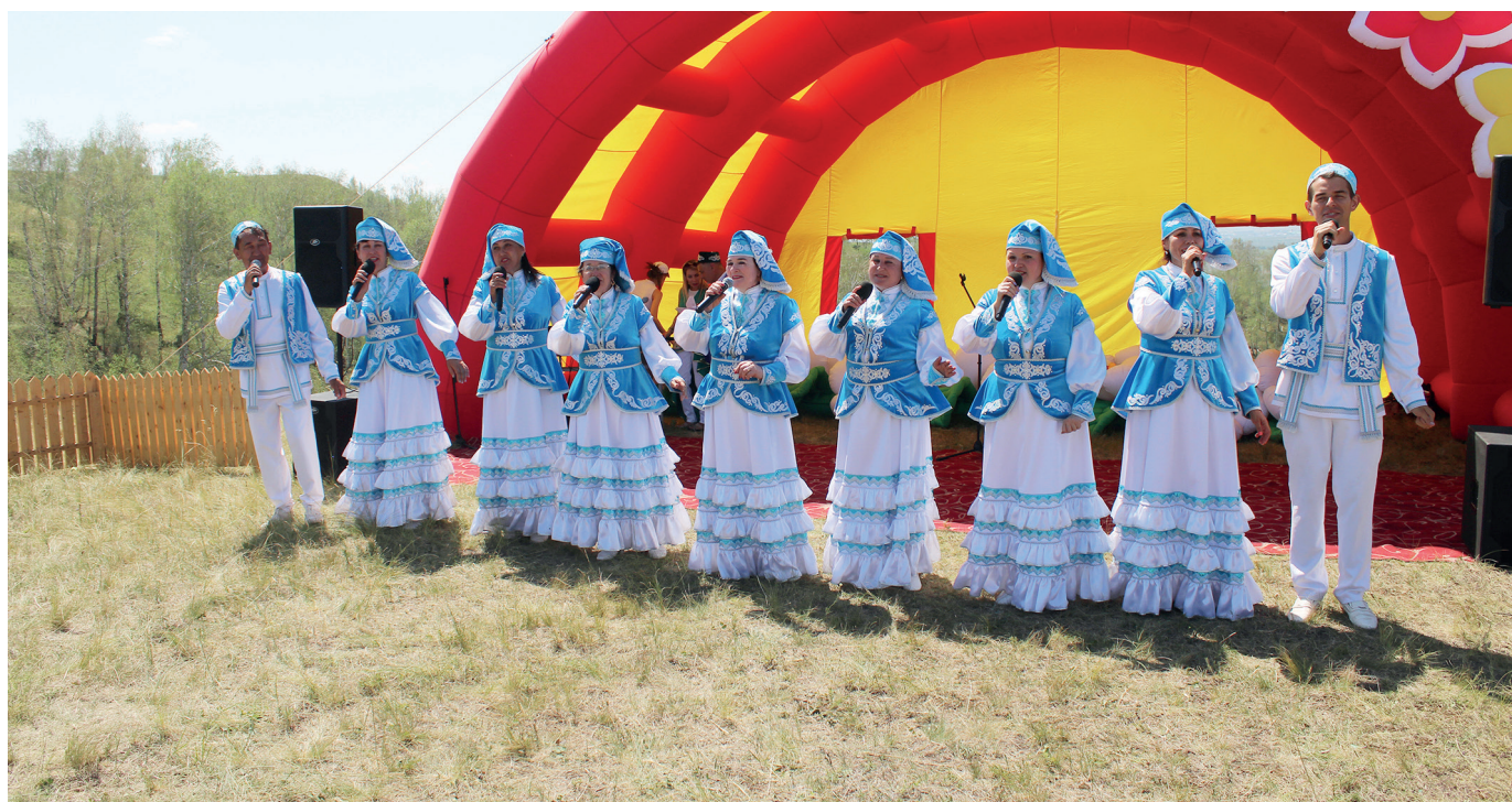
Фольклорный коллектив из г. Заинск