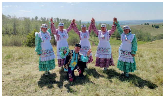
Народный фольклорный ансамбль «Наза» Карабашского Дома культуры Бугульминского района

Все участники фестиваля награждены ценными подарками и знаменитыми азнакаевскими сувенирами.