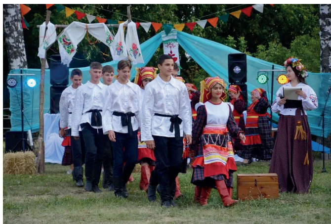
Хореографический коллектив «Стиль»