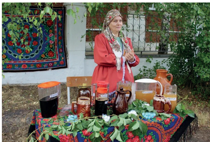
Квасная лавка в Слободе Архангельской