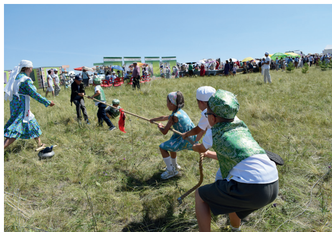
На детской поляне