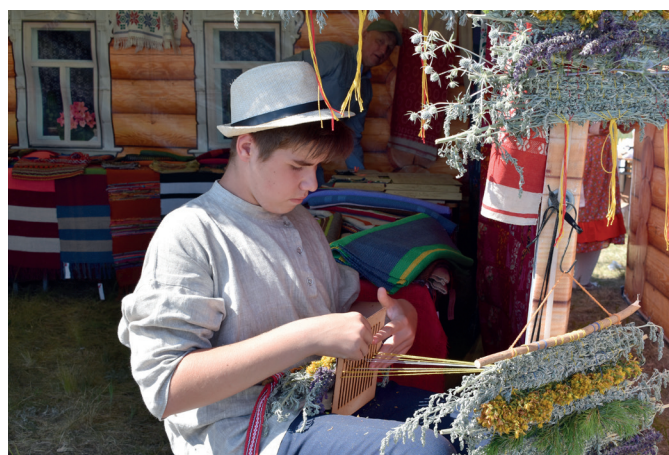
Мастер-класс по плетению из трав