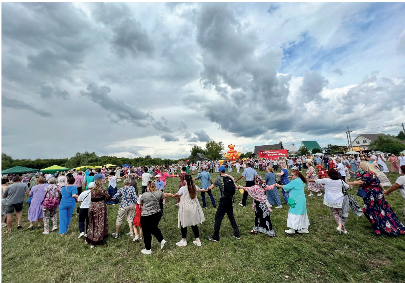
«Водим, водим хороводы»

жизни региона, он привлекает все большее количество людей и становится доброй традицией в их жизни. По завершении фестиваля мы услышали только хорошие отзывы, пожелания мира, благополучия, счастья, процветания. Было отмечено, что фестиваль способствует сохранению культурных традиций, популяризирует здоровый образ жизни, воспитывает патриотизм. Высокий уровень проведения фестиваля был отмечен представителями органов исполнительной власти.