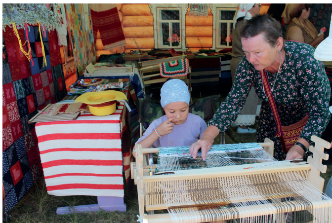
Мастер-класс по ткачеству