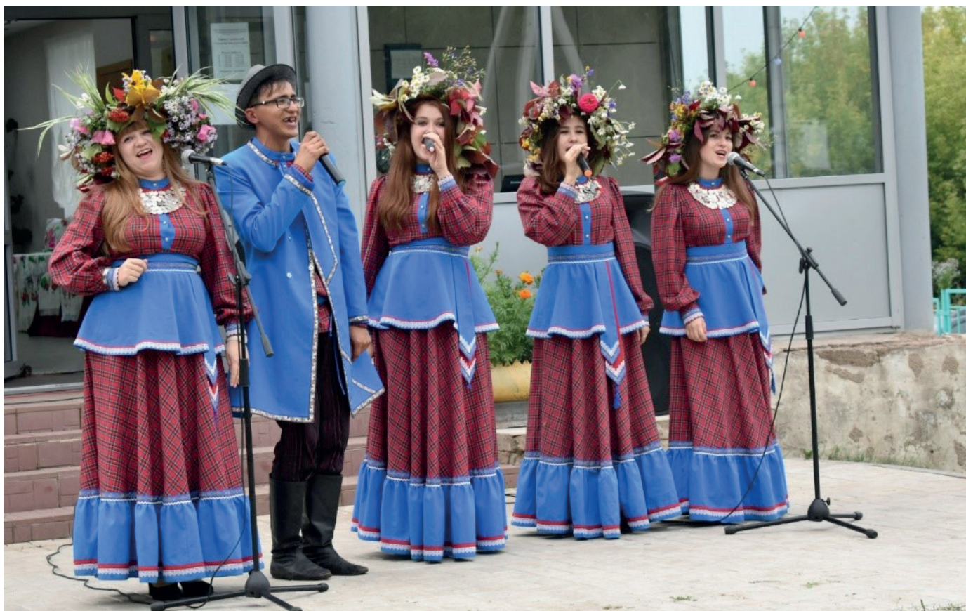
Вокальный ансамбль «Сяяр»

VI Республиканского межнационального фестиваля «Культурная мозаика Татарстана», IX ежегодного открытого Республиканского телевизионного фестиваля творчества работающей молодежи «Наше время – Безнең заман», Республиканского фестиваля культуры кряшен «Питрау», Молодежного акселератора этно-проектов «Таба», IV форума кряшенской молодежи, Международного этнокультурного фестиваля «Ага-Базар», XI конкурса-фестиваля молодых исполнителей кряшенской народной песни «Туым жондозы – Рождественская звезда» и др.