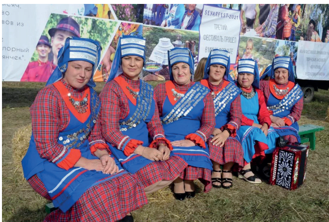
Народный фольклорный ансамбль «Берәнжәр»

коления, приехали и юные артисты. Выступали участники как в народных костюмах, так и в сценических нарядах, сшитых в современном стиле.