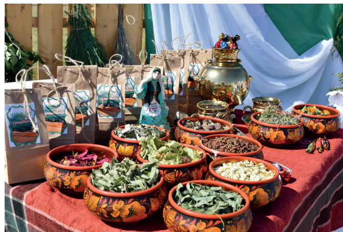
Чатыр тау чаены