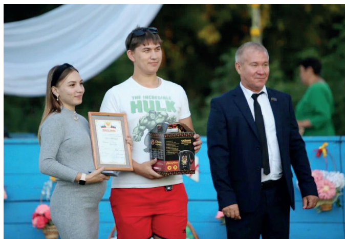
Семья – участница конкурса «Башка чыгу»

Мы были рады услышать теплые слова благодарности о фестивале от его участников, от почетных гостей. Мы уверены, что наш этнофестиваль будет расти, развиваться. Надеемся получить финансовую грантовую поддержку на его проведение на республиканском уровне. ■