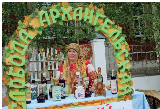
Винная лавка в Слободе Архангельской