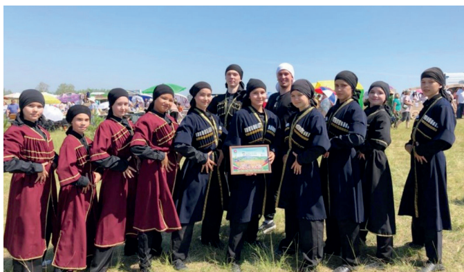
Народный хореографический коллектив «Акварель» Шеморданского СДК Сабинского района