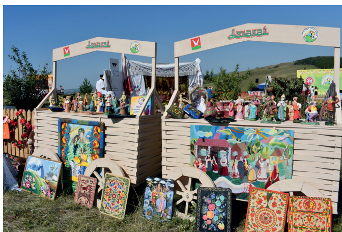
Изделия азнакаевских мастеров

Всех привлекали площадки, отражающие быт тюркских народов: «Поляна детства», «Поляна чак-чака», «Поляна мастеров рукоделия», «Улица Дома Дружбы народов», молодежная площадка национальных игр «Уен Fest», «Литературная поляна», «Комната матери и ребенка», «Поляна истории».