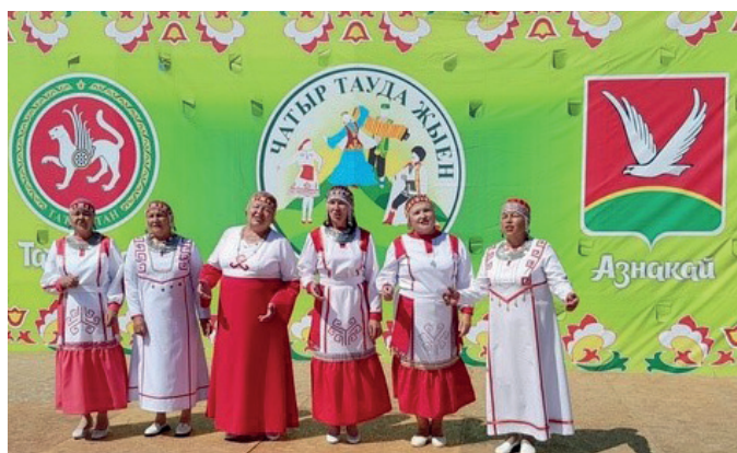
Народный самодеятельный фольклорный чувашский коллектив «Светлая мечта» с. Нижний Курмей, Абдулинского района Оренбургской области