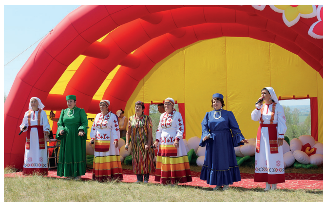
Фольклорный коллектив «Сембелә» Республики Башкортостан