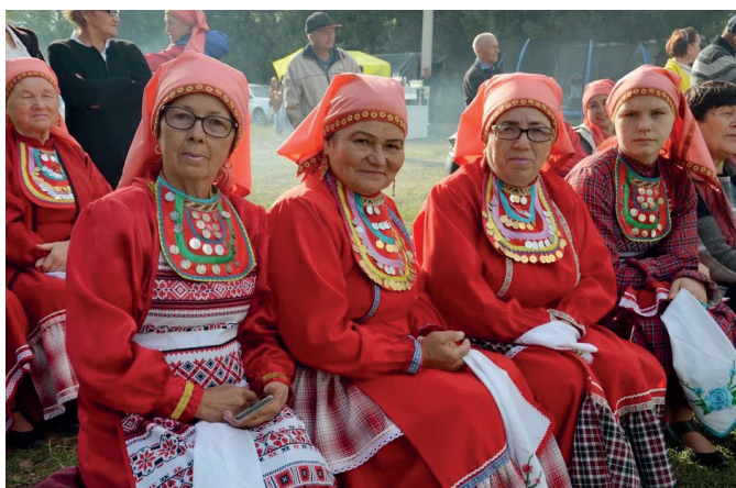
Народный фольклорный ансамбль «Иганя»