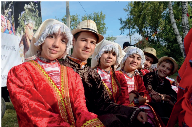
Детский хореографический коллектив «Яшьлек»