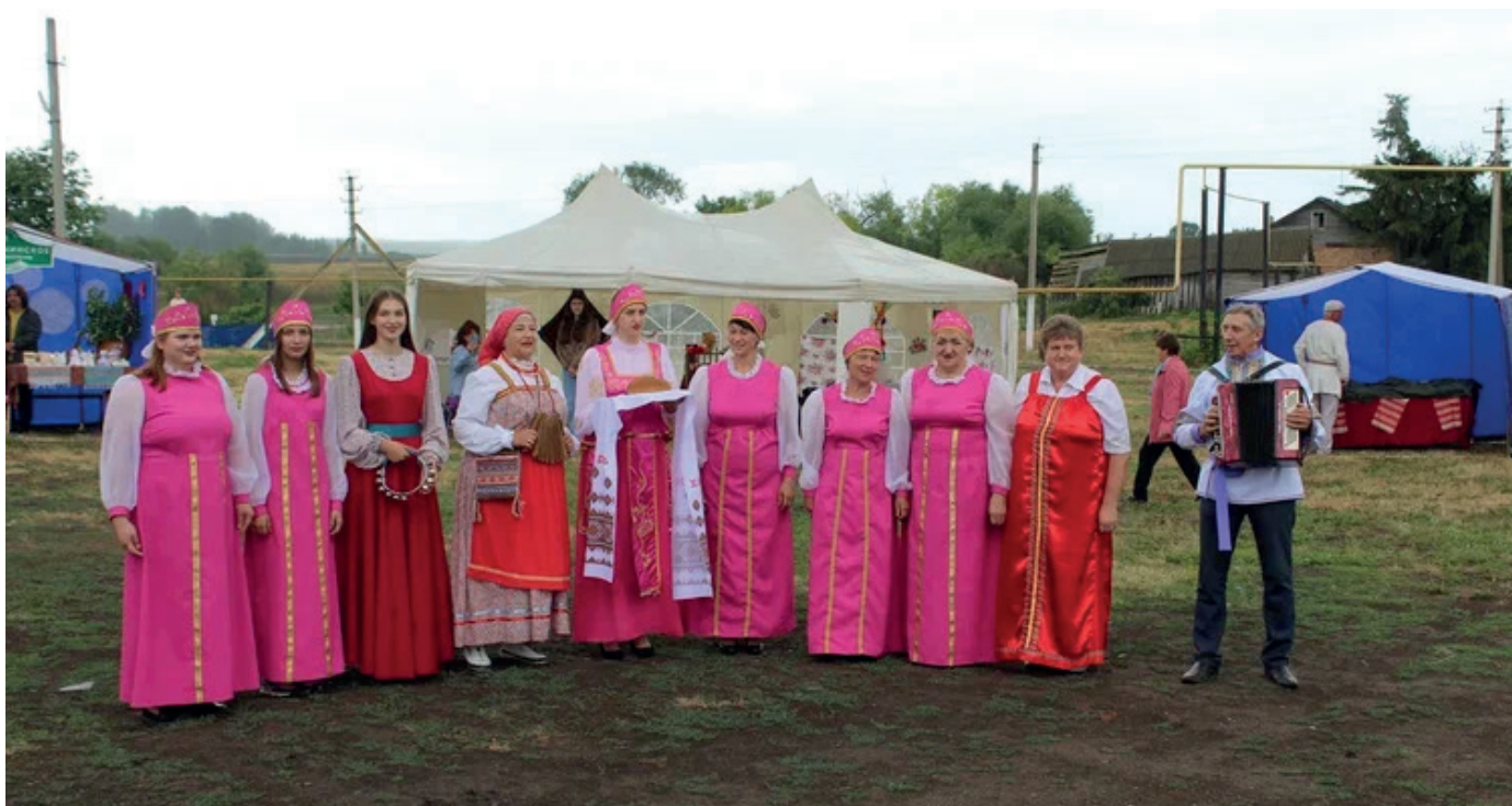
Встреча гостей в Слободе Екатерининская