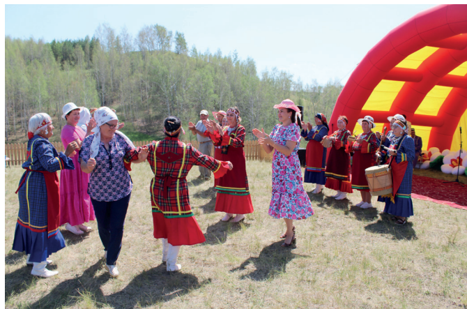
Национальная игра «Укради хлеб»