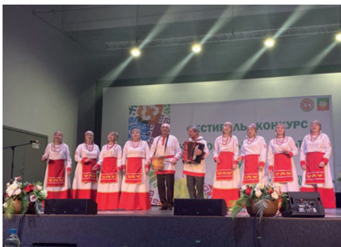
Народный ансамбль чувашской песни «Шулкеме»