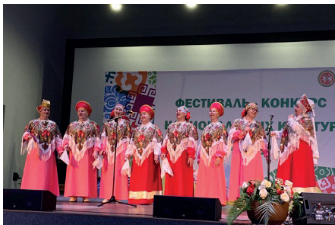
Вокальный ансамбль «Вишневая рапсодия»