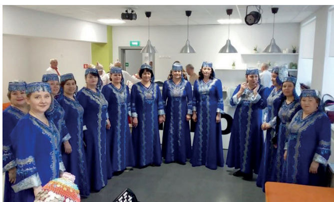
20 Татарский ансамбль «Сердэш»