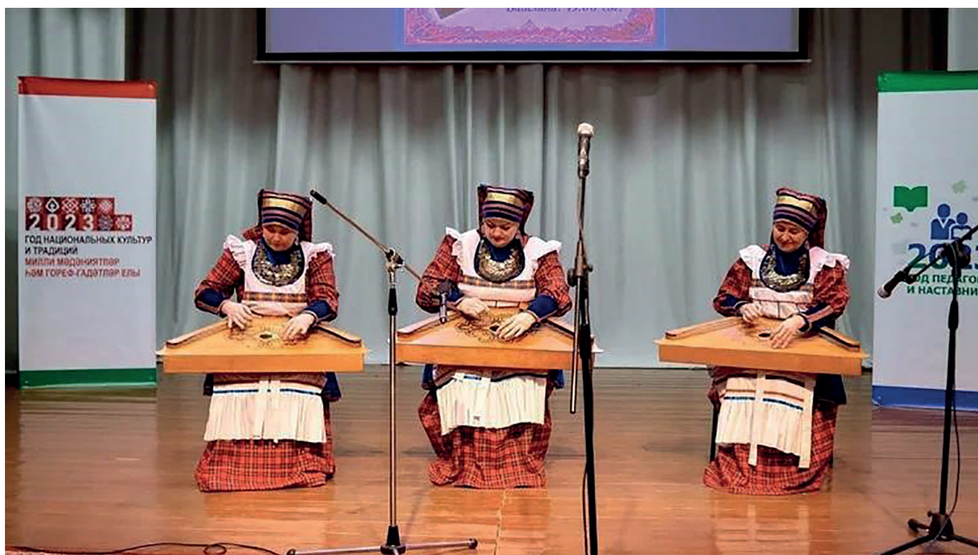
Ансамбль гузляров «Орчык»