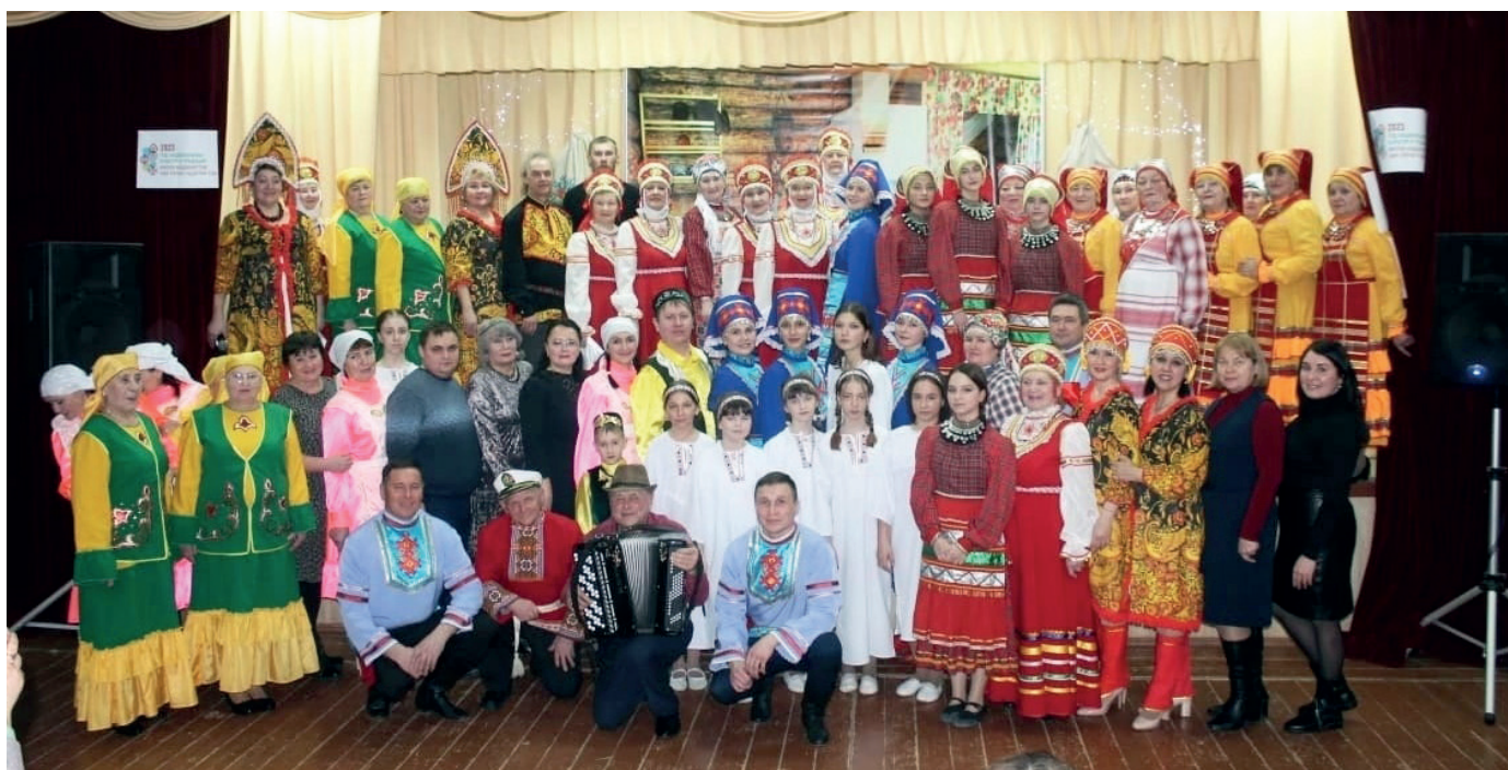
Участники творческих коллективов зонального этапа в Ижевском СДК

Хозяева из Ижевки – коллективы «Серпантин», «Вечерушка», «Кураж», «Сюрприз» вместе со зрителями отправились в мир русской песни и танца, русского фольклора.