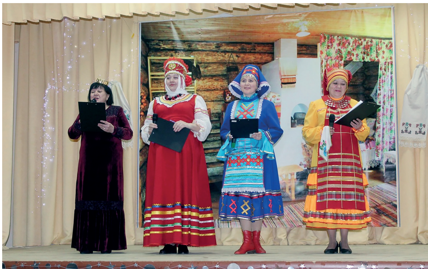
Открытие зонального этапа фестиваля в Ижевском СДК

Вот, например, как проходил зональный этап на базе Ижевского сельского Дома культуры. Сцена была оформлена в виде русской избы, а гостеприимные хозяева приглашали всех гостей и творческие коллективы из сел Монашево, Тураево и Сетяково на посиделки у самовара. В ответ гости приветствовали участников фестиваля на кряшенском, удмуртском, татарском языках.