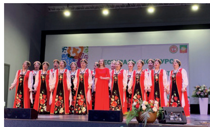
Народный хор «Ветеран»