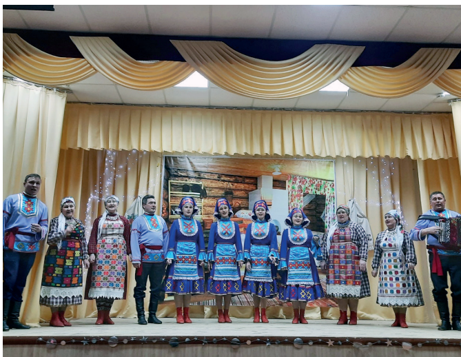
Выступают самодеятельные артисты с. Монашево

Концерт прошел на одном дыхании. От каждого села было по 4-7 выступлений самого разного жанра: сольные песни, песни в исполнении фольклорных ансамблей, стихи, скетчи, хореографические номера, музыкальные игры, отрывки из фольклорных постановок.