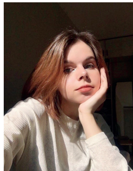
Автор картины «Троицкие гуляния» Евгения Баранова