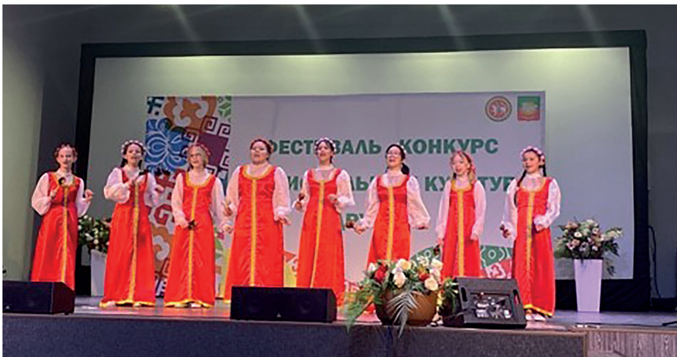
Детский вокальный ансамбль «Девчата»