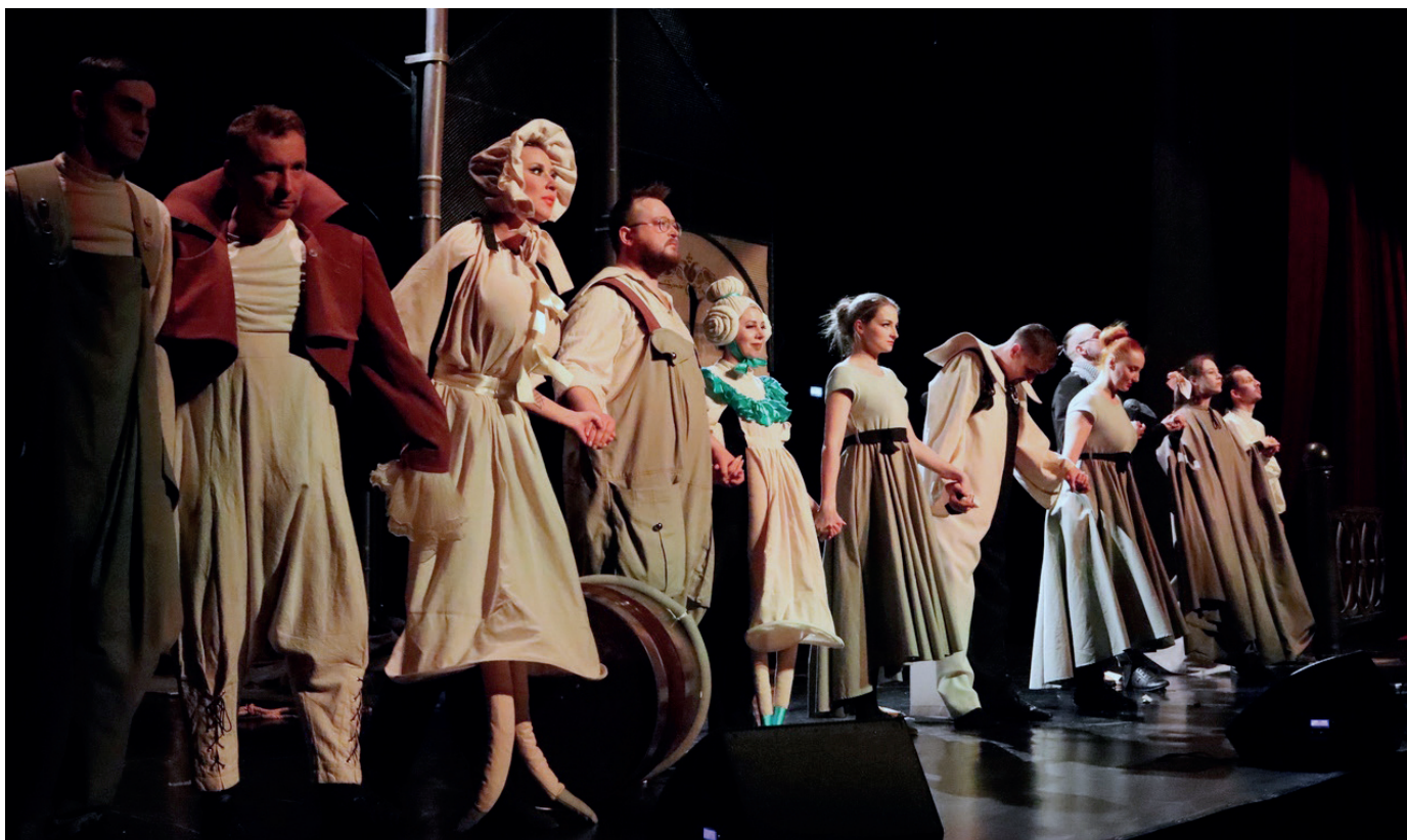
Спектакль «Мертвые души»