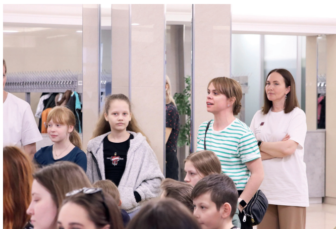
На встрече с актерами нижегородского театра «Комедия»