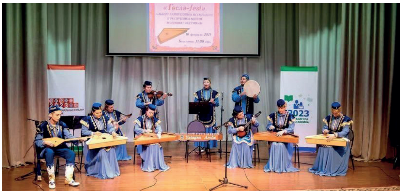
Ансамбль «Ятаган» Арской детской школы искусств.

В 2017 году он привлек к изучению игры на гуслях молодых преподавателей школы искусств и создал ансамбль «Ятаган»,