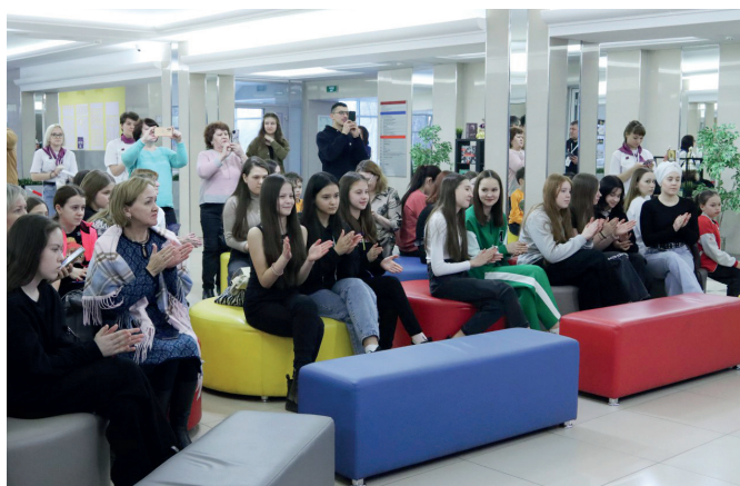
На творческих встречах с участниками школьных театров царил теплая, доброжелательная атмосфера.

республики «Недели театров нефтегазохимических городов России» прошла на основной площадке проекта – Доме народного творчества. Почетными гостями церемонии стали: помощник генерального директора Публичного акционерного общества «Нижнекамскнефтехим» по ра-