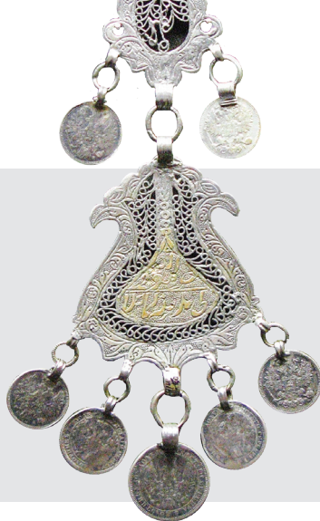
Накосник – чулпа. Филигрань, гравировка, чеканка. Монеты. Казань. XIX в. НМ РТ