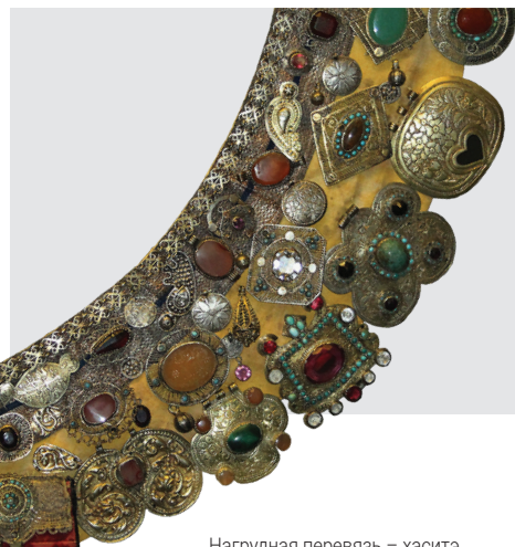
Нагрудная перевязь – хасит. Казанские татары. XIX в. НМ РТ