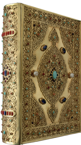
Р. Мухаметшин. Обложка для Корана. Выпиловка, гравировка, самоцветы. 2006