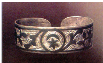
Народный мастер Х. Ганиев. Браслет. Чернение по серебру. с. Тники Сабинского района. 1980-е гг.