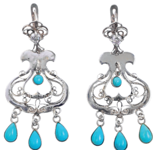
Ф. Шаймухаметов. Серьги «Татарские». Филигрань, ковка, пайка; бирюза. 2020

Новым явлением в ювелирном искусстве Татарстана стало творчество Равката Мухаметшина, обратившегося к возрождению традиций болгарского и татарского ювелирного искусства через музейные реконструкции и авторские реплики. Иногда копии автора бывает сложно отличить от оригинала, и в отдельных случаях они могут его даже превосходить.