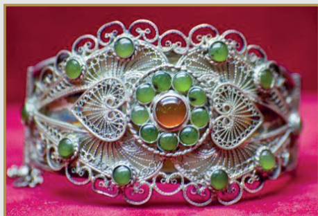
И. Фазулзянов. Браслет. Филигрань, самоцветы. 2000-е гг.