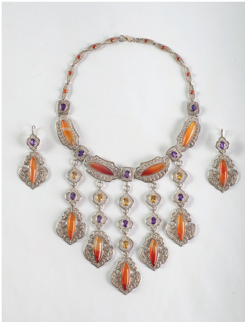
А. Шамсутдинов. Гарнитур «Ханум». Филигрань плоская, ажурная и бугорчатая, инкрустация самоцветами. 2020

На обл.: 1 – А. Шамсутдинов. Гарнитур «Алия». Филигрань, самоцветы. 2020; 2 – Българское височное кольцо. Филигрань, зернь. XX–XII вв. НМ РТ