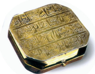
Коранница. Казань. XIX в. Музей 1000-летия Казани