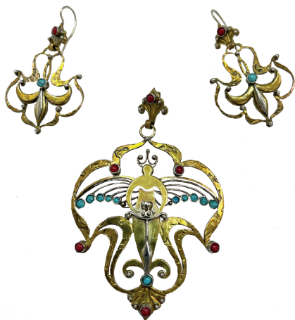
Р. Ахметов. Гарнитур «Умай». Выпиловка, травление, чернение; кораллы, бирюза. 2017