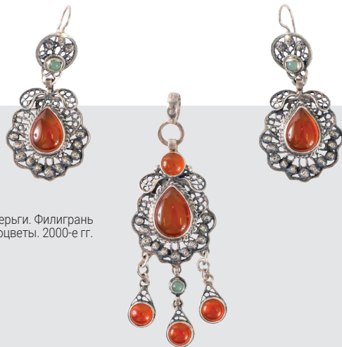
И. Васильева. Гарнитур: подвеска и серьги. Филигрань ажурная, плоская и бугорчатая, самоцветы. 2000-е гг.

крупнейших международных выставок (ЭКСПО 2000 в Германии, Парижской ярмарки – 2003, Санкт-Петербург-300), специализированных ремесленных выставок в Португалии, Румынии и др.