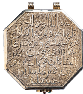
Р. Мухаметшин. Коранница. Реплика. Чеканка, гравировка. 2019