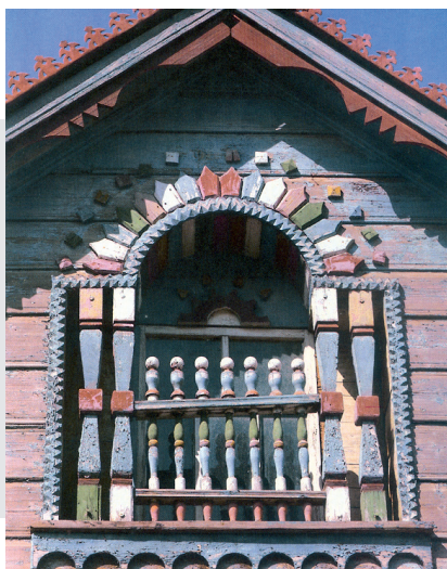
Фронтонная ниша. Накладная резьба. с. Большая Атня.1960