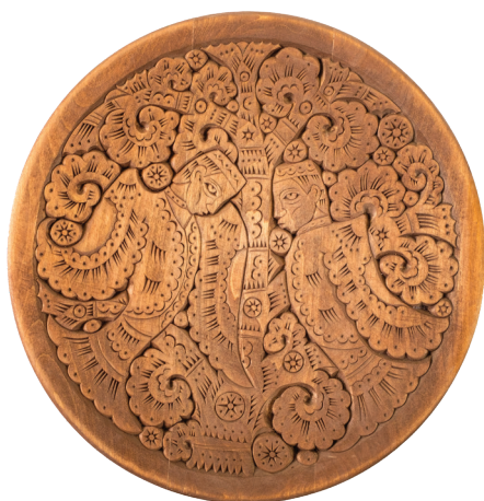
Х. Латыпов. Панно «Сак и Сок». 2019