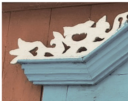
Детали оформления фасада. Накладная и пропильная резьба. Народный мастер Фаяз Валеев. с. Бикмуразы Буинского района. 1990-е гг.