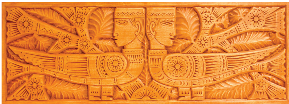
Х. Латыпов. Панно «Легенда». Выемчатая и рельефная резьба. 2017