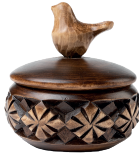
Е. Корезин. Шкатулка. Рельефная резьба. 2021