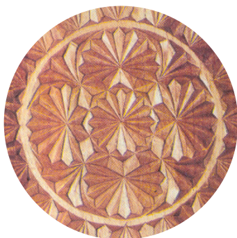
Ф. Хакимов. Фрагмент блюда. Трехгранно-выемчатая резьба. 1983