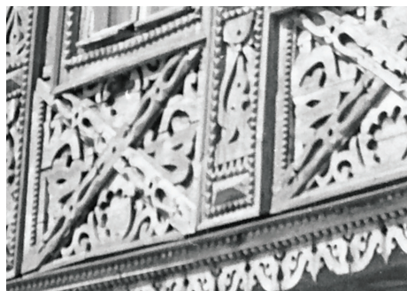
Фрагмент резьбы на эркере бывшего дома по ул. Тельмана в Казани. Конец XIX в.