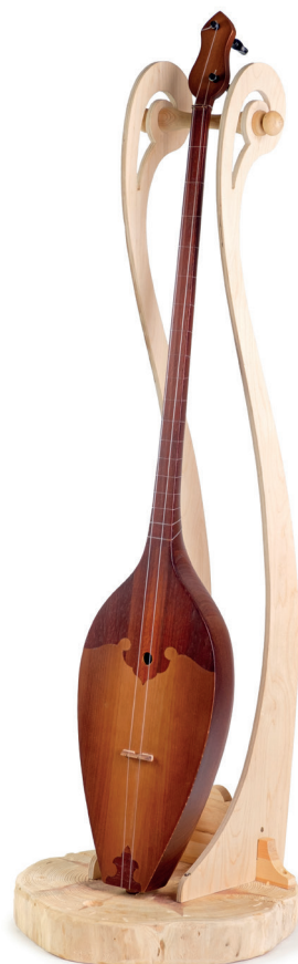
Д. Вильданов. Думбра «Кейме». Интарсия. Резьба. 2021