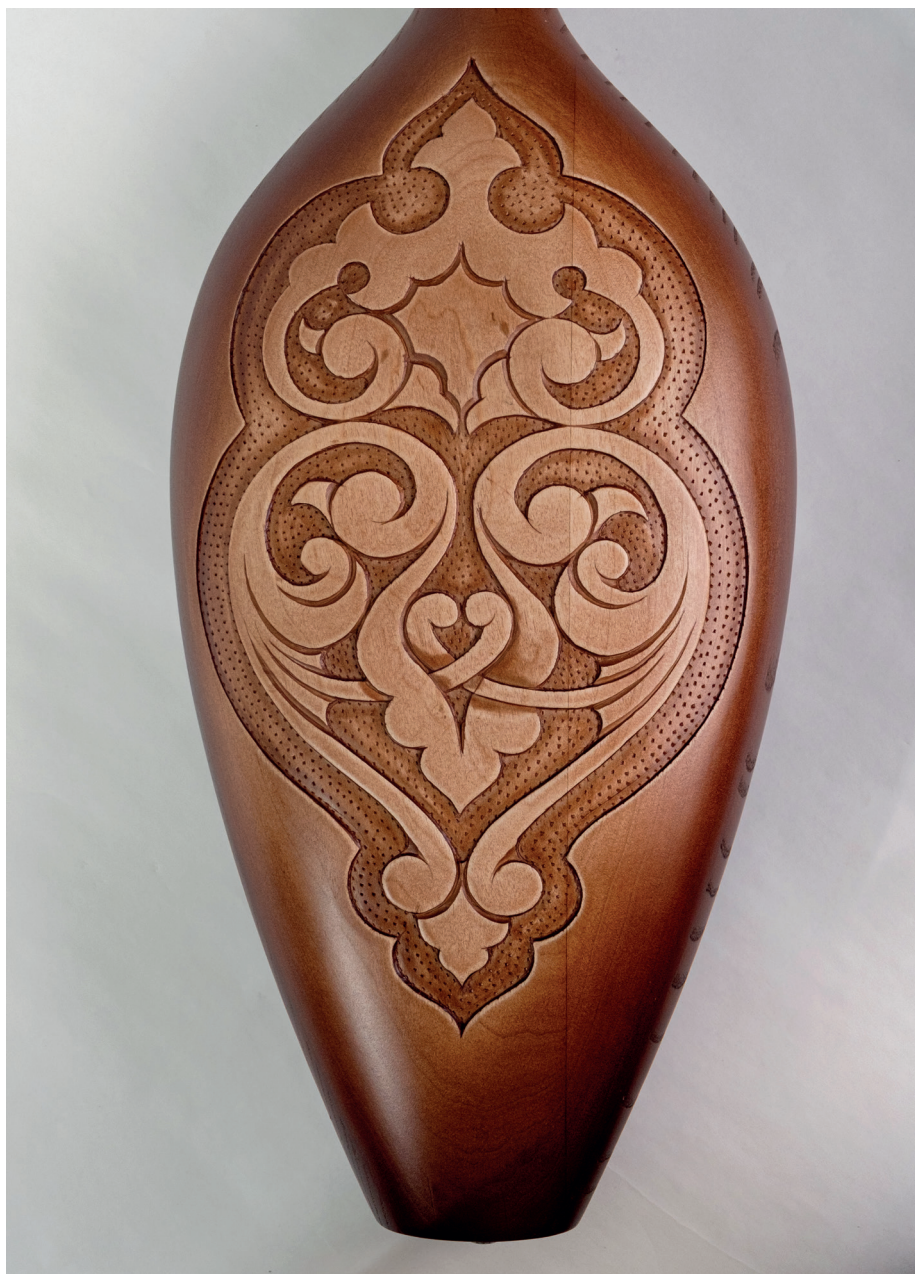
Д. Вильданов. Фрагмент резьбы на оборотной стороне думбры «Кеймэ». 2021

На обл.: 1 – Х. Латыпов. Настенная тарелка «Дружная пара». 2003; 2 – Ф. Х. Валеев. Декоративная тарелка. Выжигание, роспись. 1980-е гг.