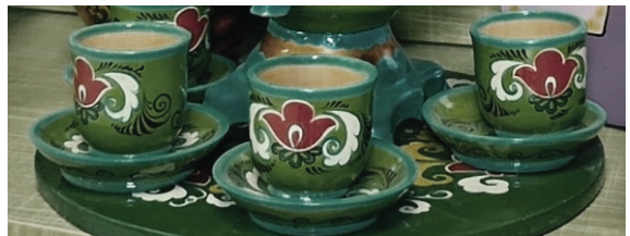
Изделия сувенирного цеха Сабинского комбината