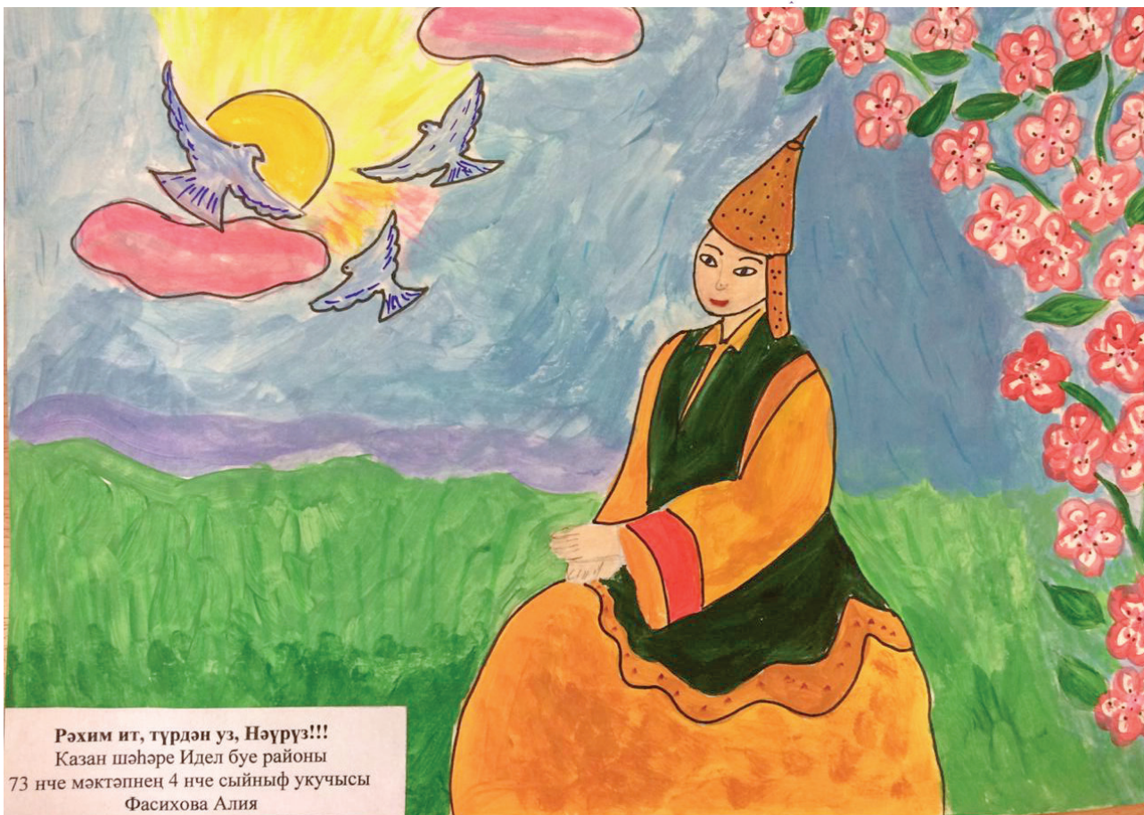
Рәхим ит, түрдән уз, Нәүрүз!!! Казан шәһәре Идел бие районы 73 нче мәктәпнең 4 нче сыйныф укучысы Фасихова Алия