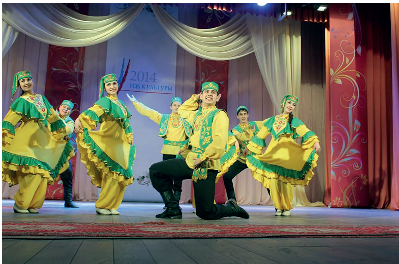
Хореографический коллектив «Наз»

В театральном коллективе «Грим» играют люди самого разного возраста: от 12 до 50 лет. Из последних постановок – спектакли Ф.Булякова «Әбиләргә ни җитми», Р.Хамида «Олы юлның тузаны», З.Хакима «Килә ява».