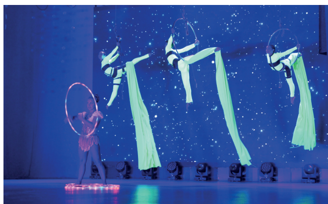
Выступление цирковой студии «Агадир»