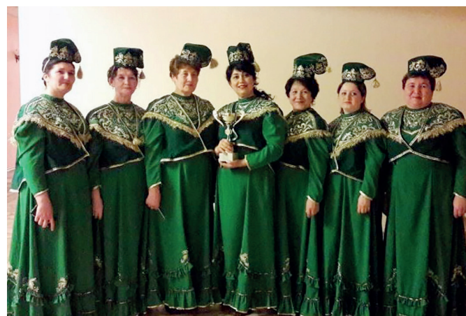
Вокальный коллектив «Сукаеш»