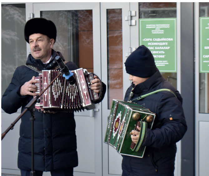
6 музыкальному искусству