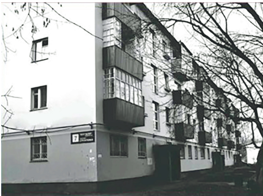
Первое здание школы