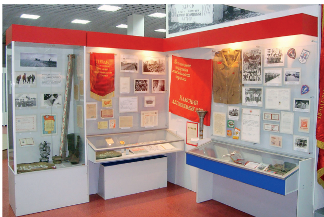
Экспозиция о начале строительства КАМАЗа