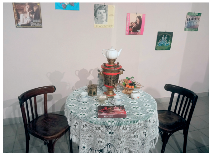
Часть выставки «Для милых дам»

А к Международному женскому дню открылась выставка «Для милых дам».