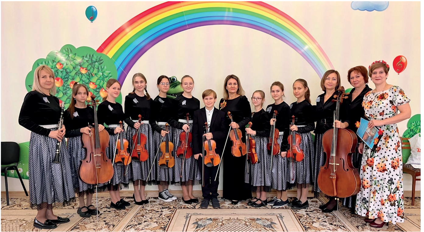
Камерный оркестр. Фото с реализации гранта «Прогулка с камерным оркестром»

Всего в школе работают 27 преподавателей, трое из них имеют звание заслуженного работника культуры РТ. Есть необходимость в преподавателях следующих специальностей: флейта, скрипка, трубы.