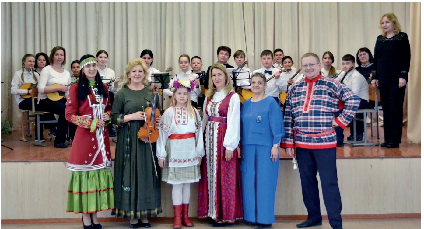
20 Фото с реализации гранта «Мелодии родного края»