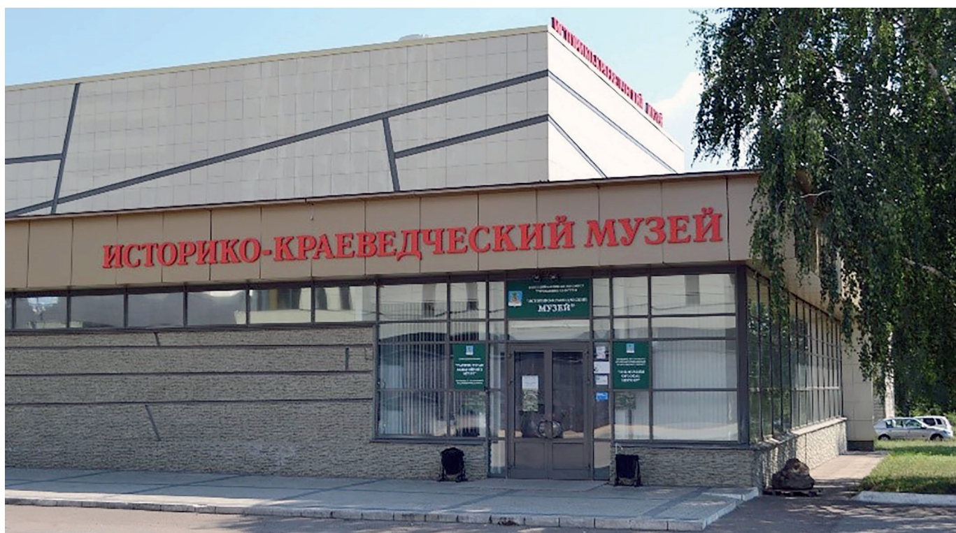
Современное здание музея

в Музее велась реконструкция. Музейная экспозиция создавалась силами научных сотрудников Музея истории города в рекордно короткие сроки – с февраля по апрель 2008 года. Художественное оформление выполнено совместно с набережночелнинской организацией «Союз художников России». 26 апреля 2008 года в торжественной церемонии открытия Музея истории города Набережные Челны принимали участие именитые люди страны и республики.