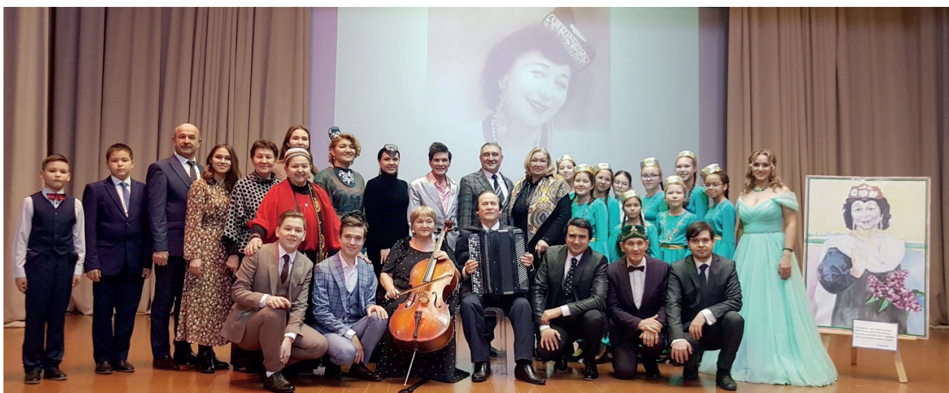
Участники концерта, посвященного присвоению школе искусств имени Сары Садыковой. 2022 г.

межрегиональном фестивале-конкурсе им. Сары Садыковой «Калфаклы сандугач», который проводится в татарской гимназии №4 и музыкальной школе №24 г.Казани Министерством образования и науки Республики Татарстан совместно с Исполкомом Всемирного конгресса татар, Союзом композиторов Республики Татарстан и Управлением образования г. Казани. Его цель – приобщение учащихся к творческому наследию татарского композитора С.Садыковой, освоение традиций татарской национальной музыки, выявление одаренных, талантливых детей.