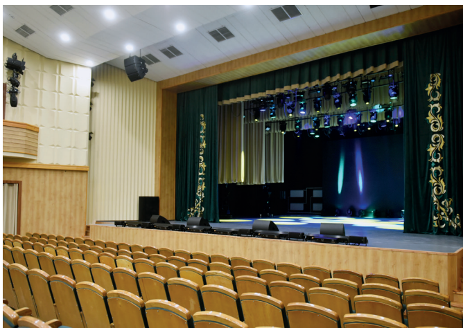
Большой зал Дворца культуры «Энергетик»

Структура дворца состоит из большого, малого, мраморного и купольного залов, художественного салона и гостевой. В большом зале проходят масштабные культурно-массовые мероприятия республиканского, регионального и городского значения. Для школьников и студентов города в рамках киноклубов работает киноцентр. Для профессиональных театральных, балетных, концертных трупп Татарстана и России большой зал стал излюбленной площадкой.