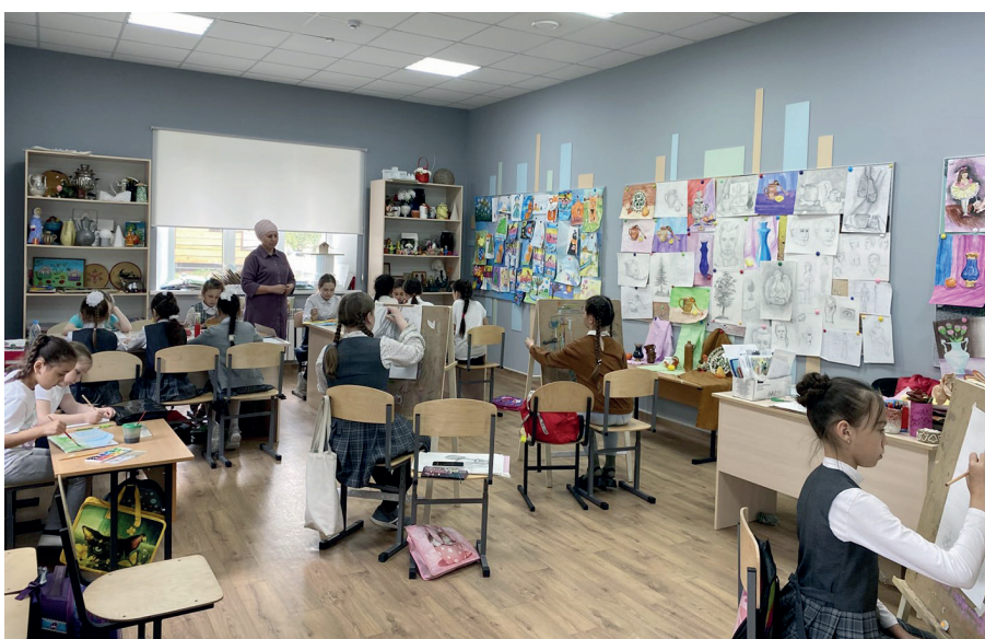
Учимся изобразительному искусству