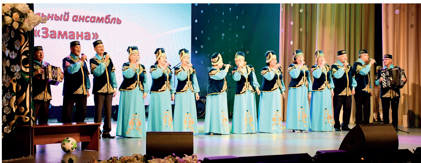
Народный вокальный ансамбль «Замана»

Международного многожанрового фестиваля-конкурса «Белая ворона» (номинация «Эстрадный танец»), Всероссийского фестиваля-конкурса детского и юношеского творчества «Ритмы весны», Всероссийского фестиваля-конкурса детского и юношеского творчества «Палитра искусств».