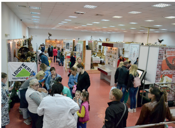
Ночь в музее

викторины и выставки в общественных пространствах. Все чаще школы стали заказывать автобусные обзорные экскурсии по городу и в «Музей камского хлеба» на Элеваторной горе.