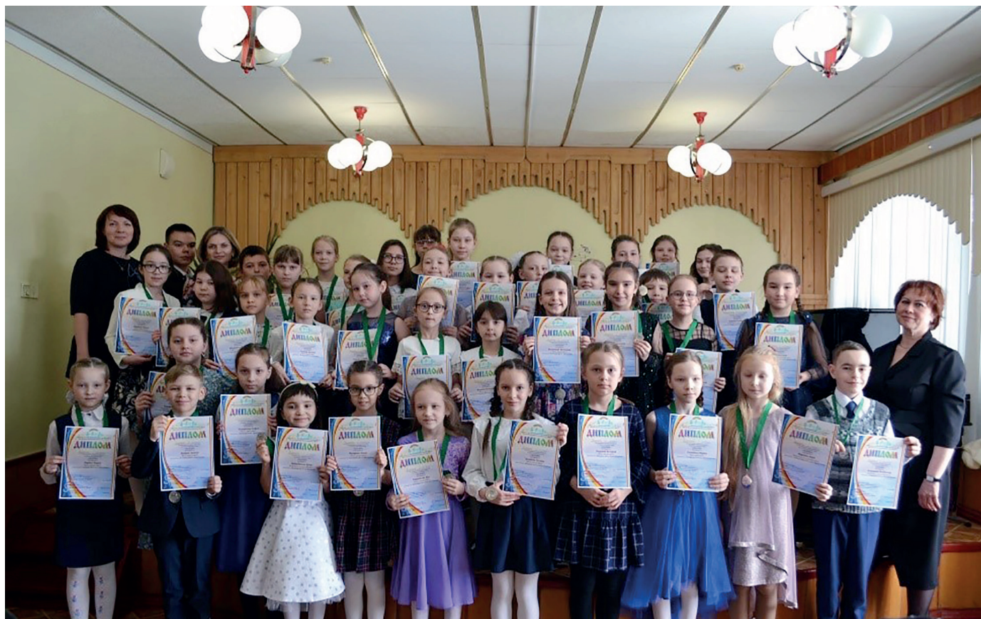
Участники регионального конкурса пианистов на лучшее исполнение этюда «Allegro»

уровня, в которых участвуют и наши воспитанники: республиканский конкурс «Город творчества», региональный конкурс пианистов на лучшее исполнение этюда «Allegro», региональный конкурс исполнителей на народных инструментах для учащихся ДМШ и ДШИ «Краски музыки», региональный конкурс-фестиваль «Звездный старт НК».