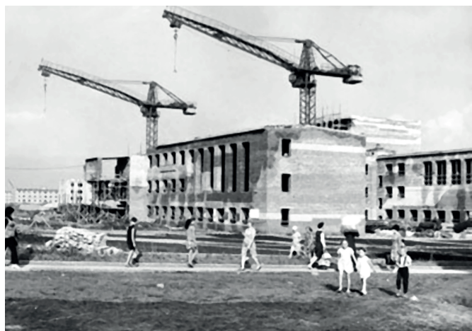
Строительство Дворца культуры «Энергетик»

Сдача объекта состоялась 3 ноября 1973 года. Здание было построено и содержалось управлением строительства «КамГЭСэнергострой», отсюда и название «Энергетик».