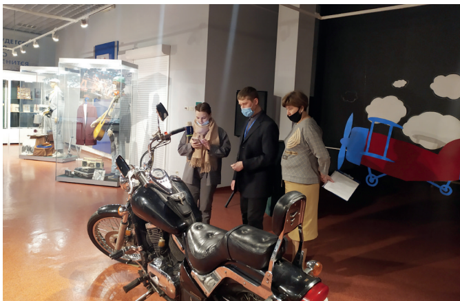
36 Экспозиция выставки «Территория мужчины»

Мужская половина города высоко оценила выставочный проект «Территория мужчины». Два тематических блока выставки рассказывали о мужчине как о воине, защитнике, а также о мужчине – главе семейства, со своими интересами и увлечениями. На выставке можно было увидеть предметно-бытовой мир мужчин второй половины XX века, а также два мотоцикла из частной коллекции участников мотоклуба «Ночные волки». Кроме того, один из разделов выставки был посвящен участникам СВО.