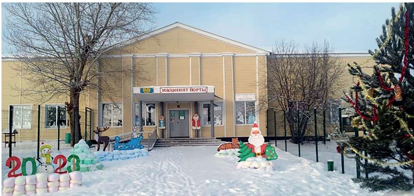
Наш Дом культуры

Территория благоустроена, в последние годы мы постоянно завоевывали призовые места в открытом смотре-конкурсе по благоустройству прилегающей территории и укреплению материально-технической базы клубных учреждений района.