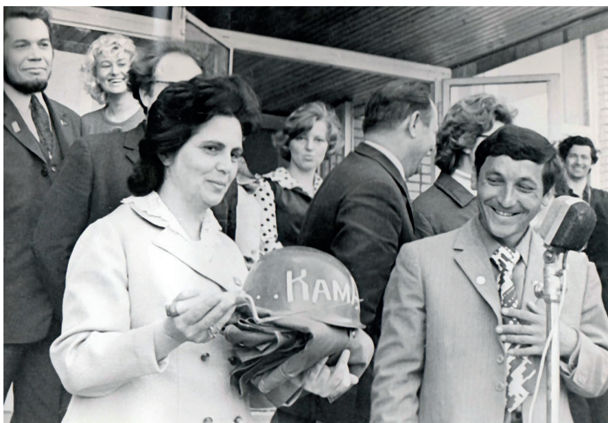
Открытие музея города

В конце 2005 года администрация города выделила под музей здание кинотеатра «Чулпан» 1970 года постройки, которое расположено в центре поселка Гидростроителей. С октября 2005 до января 2008 года