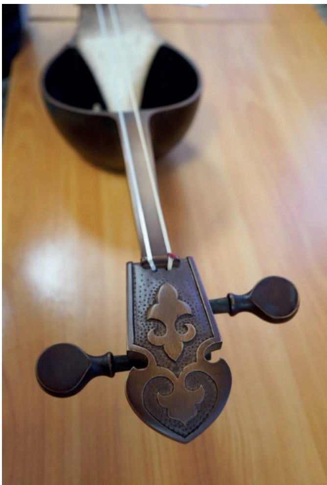
Колки и орнамент на грифе

Мне самому удивительно, как я – человек без музыкального образования изготавливаю инструменты, которые все называют уникальными.