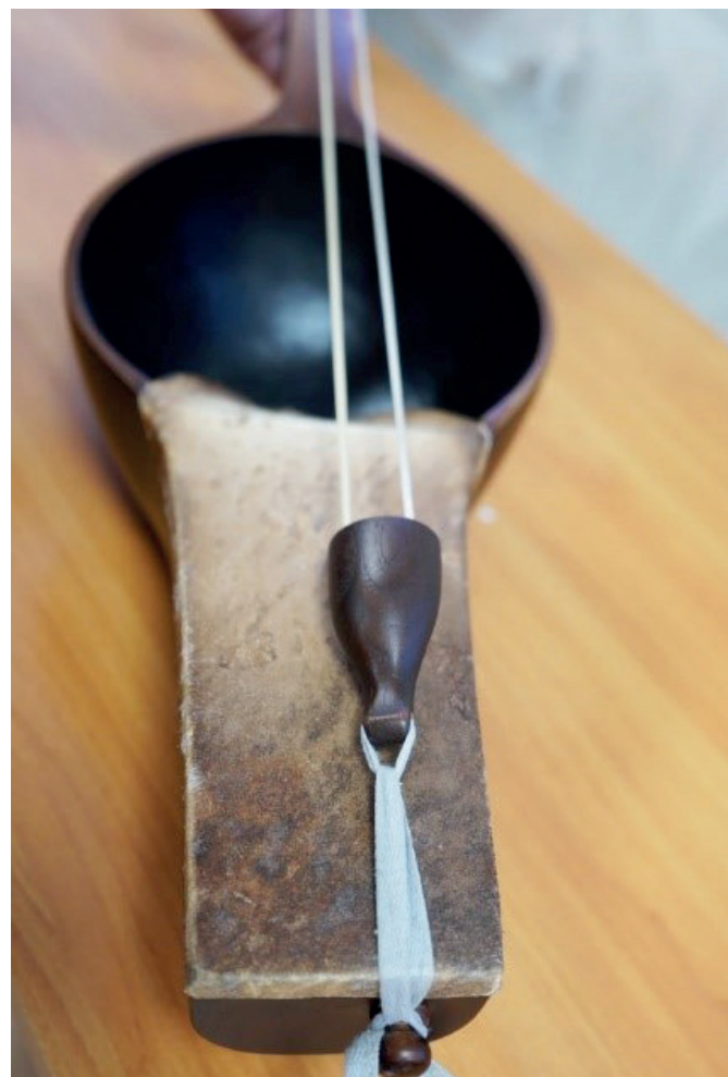
Резонаторная кожа и струнодержатель

С инструментами меня приглашают на многие выставки и торжественные мероприятия. По приглашению Министерства культуры Республики Татарстан я участвовал на художественно-промышленной выставке-форуме «Уникальная Россия», которая проходила в Москве. Участвовал в специальной выставке производителей музыкальных инструментов в Казанской ратуше, где с моими работами ознакомился наш президент Рустам Нургалеевич Минниханов. Также был приглашен участником на выставку в честь юбилея нашего первого президента Минтимера Шариповича Шаймиева.