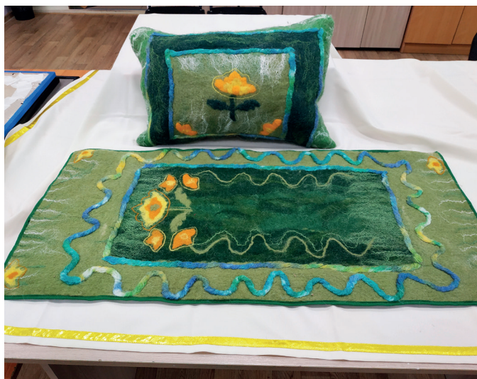
«Мелодия леса». Автор: Алиса Гладких