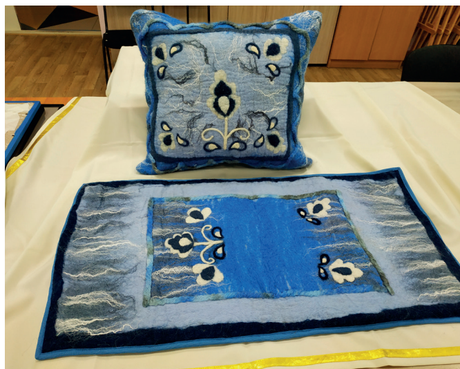
«Мелодия реки». Автор: Зиатдинова Адиля