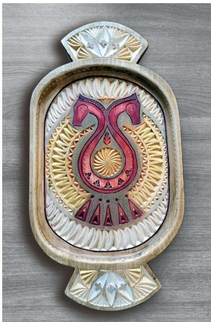
Поднос «Булгарский скакун». Размер 46 х25х3 см

На конкурс «Ремесленник года» я представил поднос «Булгарский скакун», выполненный в технике геометрической резьбы. При его изготовлении были использованы изображения из исторических источников в стиле раннего болгарского периода. Очень помогла монография Фуада Валеева «Татарский народный орнамент». Раскраску я делал, советуясь с родителями, потому что хотел выполнить работу максимально идеально. Я хотел сделать оригинальное изделие, которое до меня никто не делал. Это будет не единичное творение, а серия на определенную тематику, но об этом я пока говорить не буду, так как идея еще в процессе разработки.