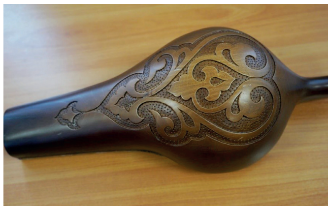
Орнамент на обратной стороне резонатора