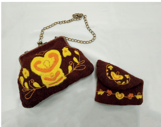
Сумка и калфак. Автор: Шакертова Раина