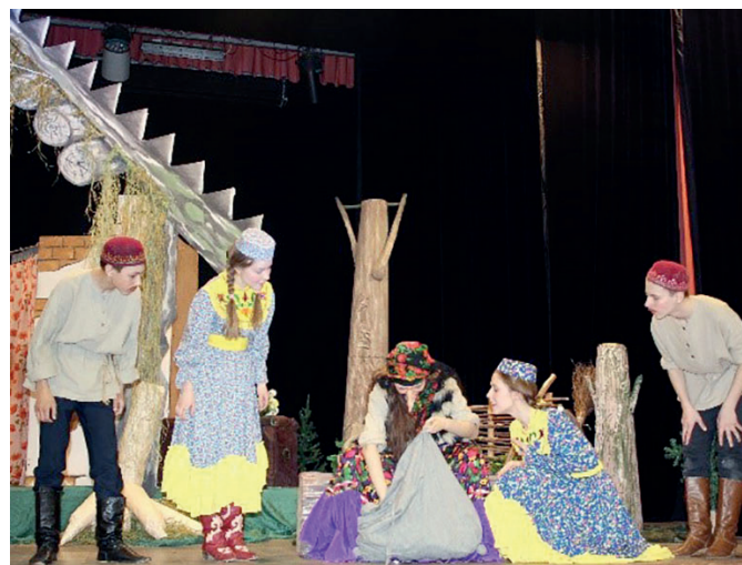
Спектакль «Ак яфрак». 2018 г.

работа над ролью в спектаклях. Вот так постепенно мы перешли к постановке спектаклей.