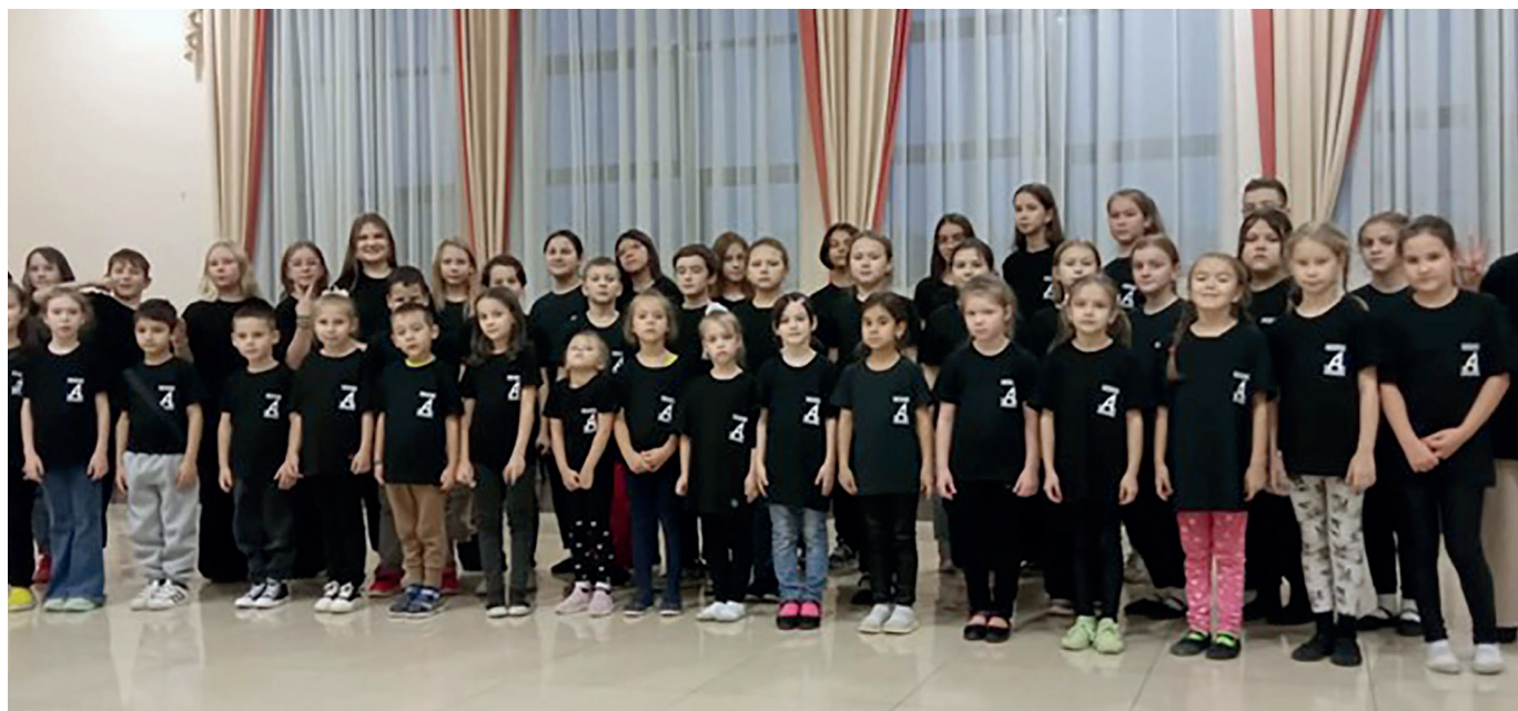
Наш дружный коллектив