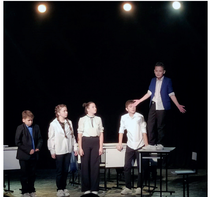
Участники спектакля «Практикантлар килгән безгә...»