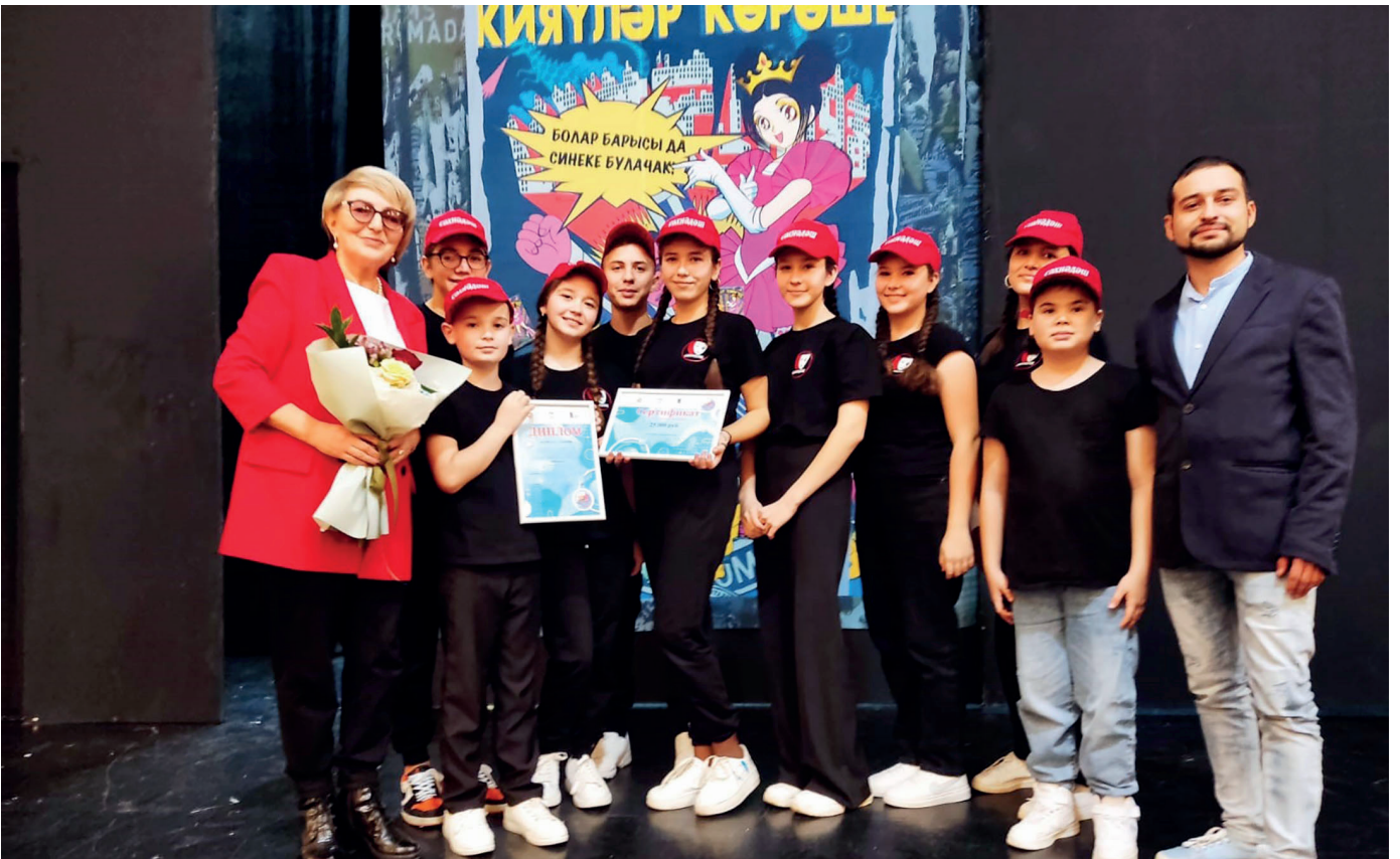
Мы – лауреаты I степени в номинации «Драматический театр»

варислары». Были очень полезными и познавательными мастер-классы для детей и педагогов по театральному искусству. Режиссеры и руководители коллективов имели возможность пообщаться, обменяться