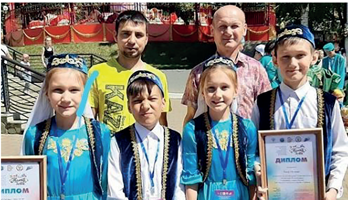
Ижевск, 2021 г.

коллективов «Театр и дети», по итогам которого были награждены дипломом за кукловождение.