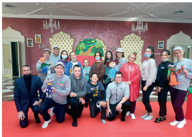
В театре кукол «Әкият»

Со спектаклями мы выступаем в селах нашего района и других районов республики. Неоднократно были участниками программ детского телеканала «ШАЯН ТВ», где мы не