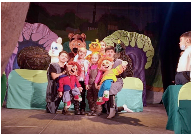
Спектакль «Табай бабай аланы»