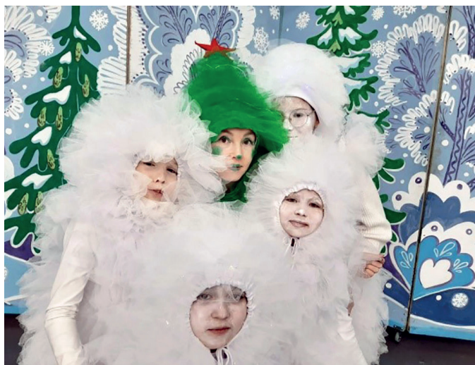
«Приключение Фьерков пушистиком»

Ни один Новый год в Детской школе искусств не обходится без спектаклей «Щелкунчик», «Кто поедет в Новый год», «Новый год на дне морском», «Морозко», «Приключение Фьерков пушистиком».