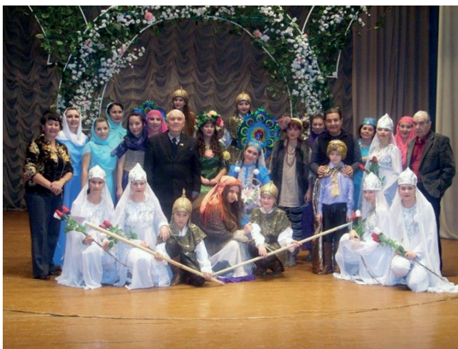
Спектакль «Яз гүзәле Нәүрүзгөл». 2012 г.