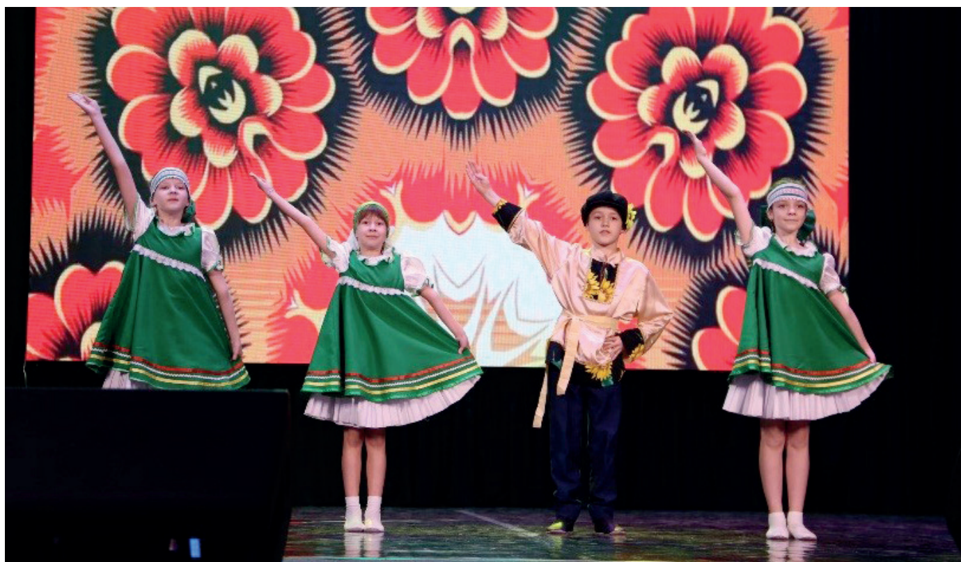
Детский танцевальный клуб «Веснушки»