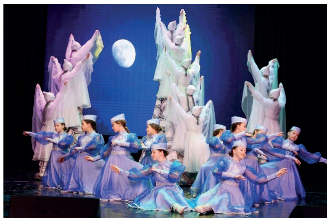
Композиции «Осенины» и «Девичья гора»