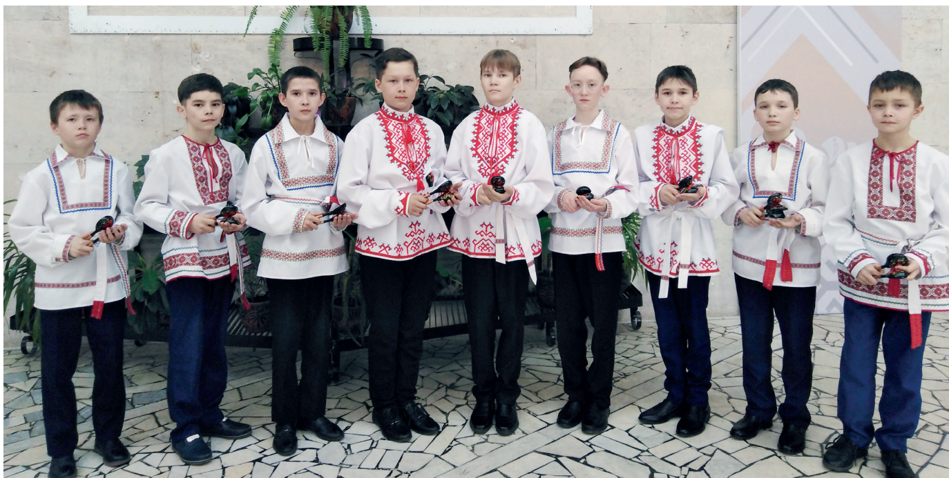
Ансамбль в составе мальчиков в г. Набережные Челны

В данное время у меня в ансамбле «Ложкари» две группы детей: в младшей – 8 детей со 2-го по 5-й класс, в старшей группе – 15