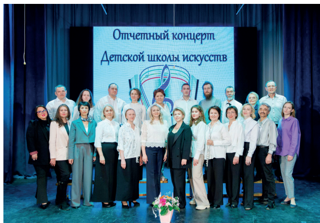
Коллектив Верхнеуслонской ДШИ

Идея создания татарского, детского национального коллектива витала давно. Мы видели, что взрослых гармонистов в районе практически не осталось, понимали, что нужно возрождать забытые традиции инструментального исполнительства игры на гармонии, передавать их молодому поколению. Очень хотелось, чтобы на ежегодных праздниках Сабантуй звучала именно татарская гармонь. Мы впервые с Виктором разработали грантовый проект, который был поддержан Правительством Татарстана. Благодарны, что в разработке проек-