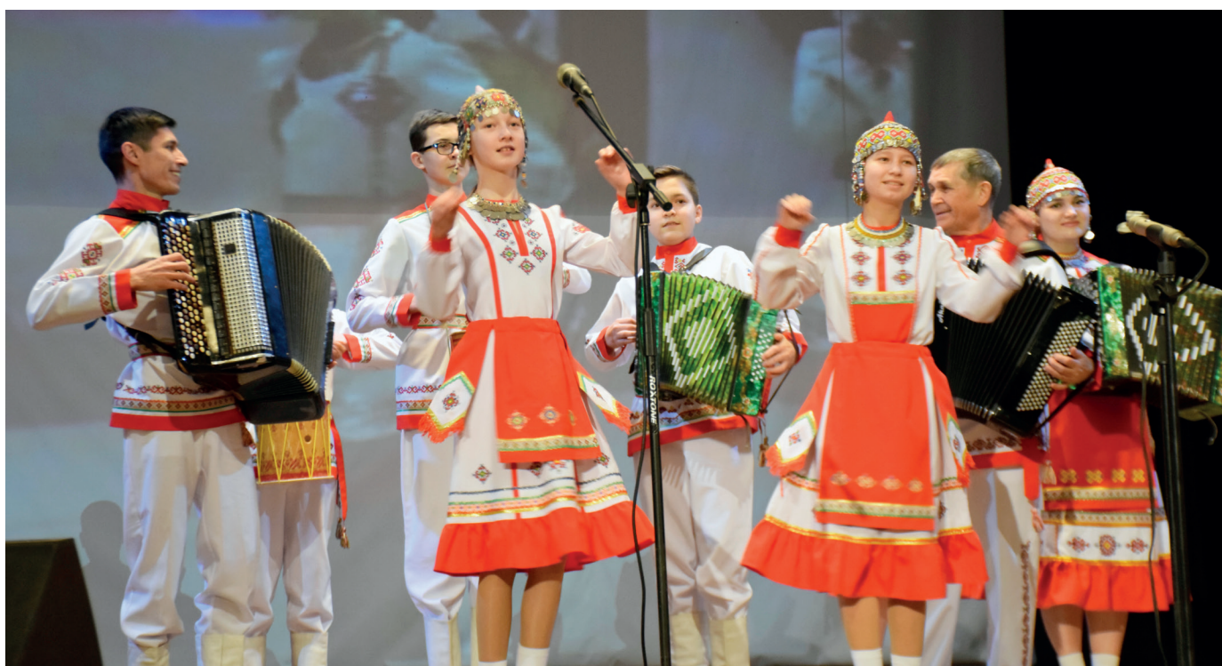
Фрагмент сюиты «Аххаяс»

«Визитная карточка» ансамбля – сюита на темы народных мелодий и наигрышей низовых чуваш «Аххаяс» (постановка, слова, обработка – мои).