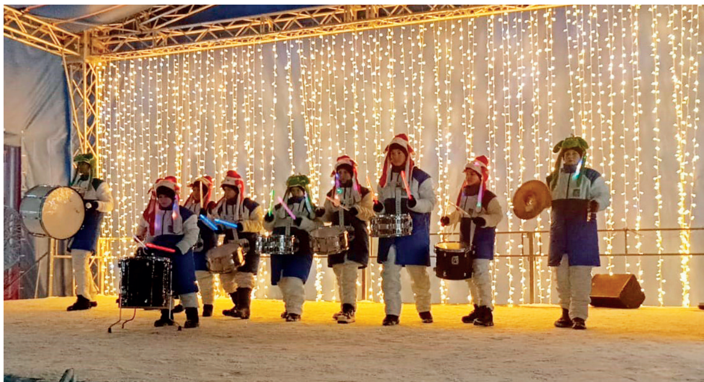
В новых костюмах на зимней сцене

«Бара-бара» еще молодой коллектив и несомненно впереди его ждут успехи и победы. Ведь с каждым выступлением наши барабаны звучат все четче и слаженнее. ■