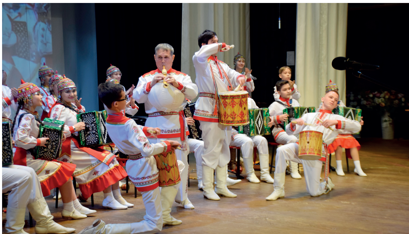
Звучат «Мелодии родного края»

С сентября 1988 года по сегодняшний день я полностью отдаю всю творческую энергию моему коллективу Образцового ансамбля народных инструментов «Эревет». В работе с участниками ансамбля младшего возраста мне помогают педагоги дополнительного образования. С гармонистами, балалаечниками, ударниками, вокалистами, танцорами средней и старшей группы занимаюсь я, также я веду репетиции уже в составе оркестра.