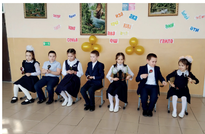
Младшая группа ансамбля «Ложкари» на закрытии Года семьи

Участвуем во всех сельских праздниках: День села, «Уярня», «Шорыкйол». Ансамбль «Ложкари» – постоянный участник районного Сабантуя.