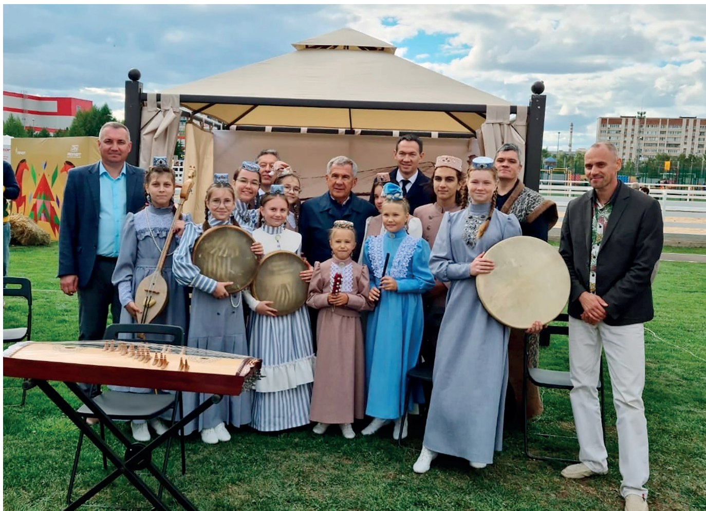
«Карлыгач» на Дне нефтяника, 2022 г.

выступление в г. Казань на Международном экономическом саммите «Россия – Исламский мир», этно-фестиваль «KARAKUZ», Гала-концерт Республиканского конкурса «Милли корал FEST» на сцене Ханского дворца в г. Болгар. В 2024 году ансамбль принял участие в уникальном творческом проекте «Народное творчество – детям» – II Всероссийской детской Фольклориаде, где в течение нескольких дней участвовал в мастер-классах, обмене опытом с участниками со всей России. Приняли участие в мероприятии, которое было приурочено к заседанию итоговой коллегии Министерства культуры РТ с участием Раиса Республики Татарстан Р.Н. Минниханова в новом здании Татарского государственного академического театра им. Г. Камала в Казани.