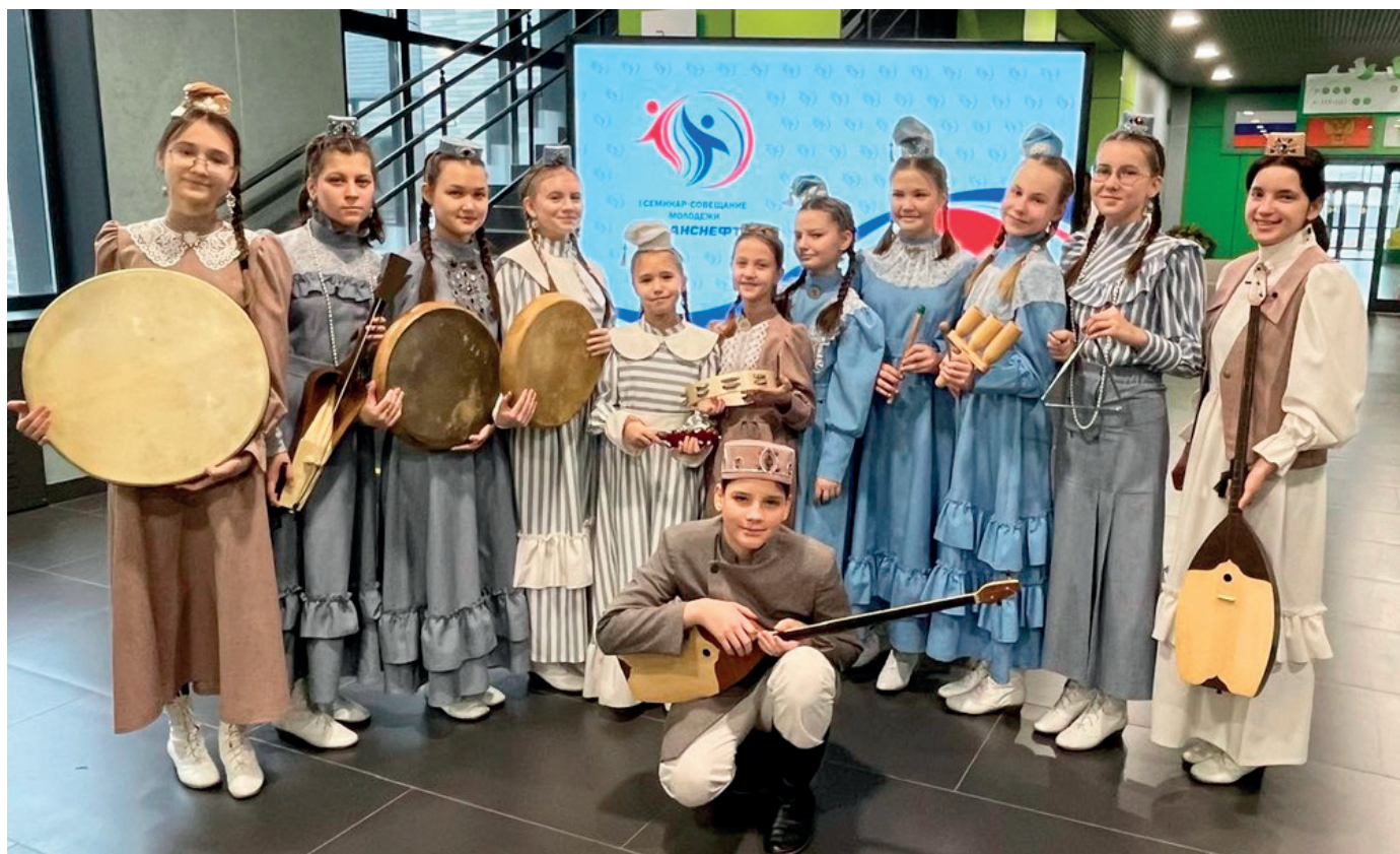
Этно-музыкальный ансамбль «Карлыгач» Детской музыкальной школы №2 им. В.И. Самойлова Альметьевского муниципального района Республики Татарстан

Понятие ансамбль происходит от французского слова «ensemble» – «вместе». Оно означает единство, созвучие, согласованность, то есть – вместе играть, вместе петь, вместе танцевать. Ансамбли бывают самые разные. В последние годы все большую популярность приобретают детские инструментальные коллективы. Это уникальные музыкальные группы, в которых дети играют на различных музыкальных инструментах, таких как баяны, скрипки, гитары, барабаны и другие.