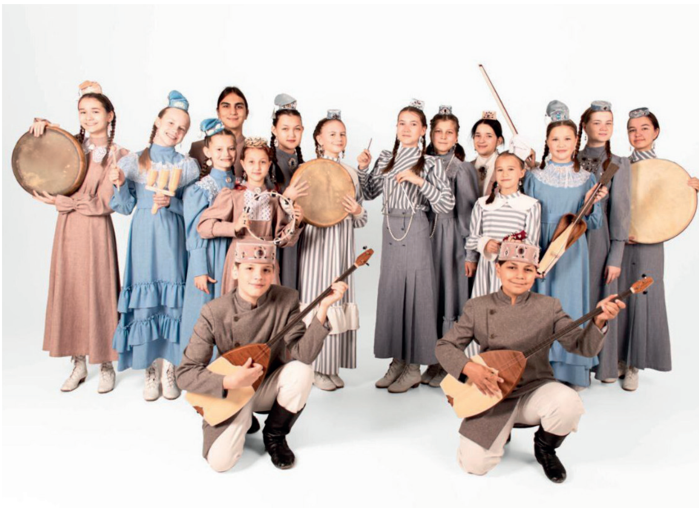
Детский этно-ансамбль «Карлыгач»

Сейчас, когда ансамбль набрал опыт, новые участники, вливающиеся в коллектив, проходят отбор. Возраст участников очень разнообразен. В коллективе играют дети от 8 до 16 лет. В данный момент в коллективе 14 детей – 12 девочек и 2 мальчика.