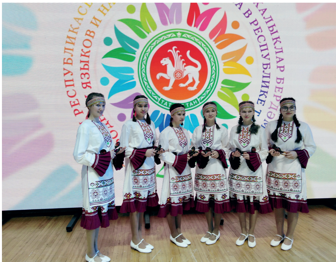
Первые участники ансамбля

В 2023 году, уже в составе 12 мальчиков, ансамбль успешно выступил с номером «Марийская плясовая» на Гала-концерте фестиваля учащихся многонациональных воскресных школ и школ с этнокультурным компонентом содержания образования Республики Татарстан и стал победителем номинации «Народное творчество».