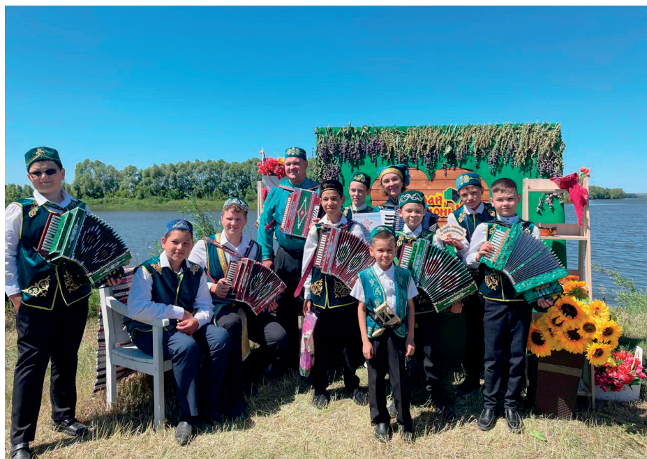
«Мирас» на фестивале «Играй, гармонь!», Соболевское