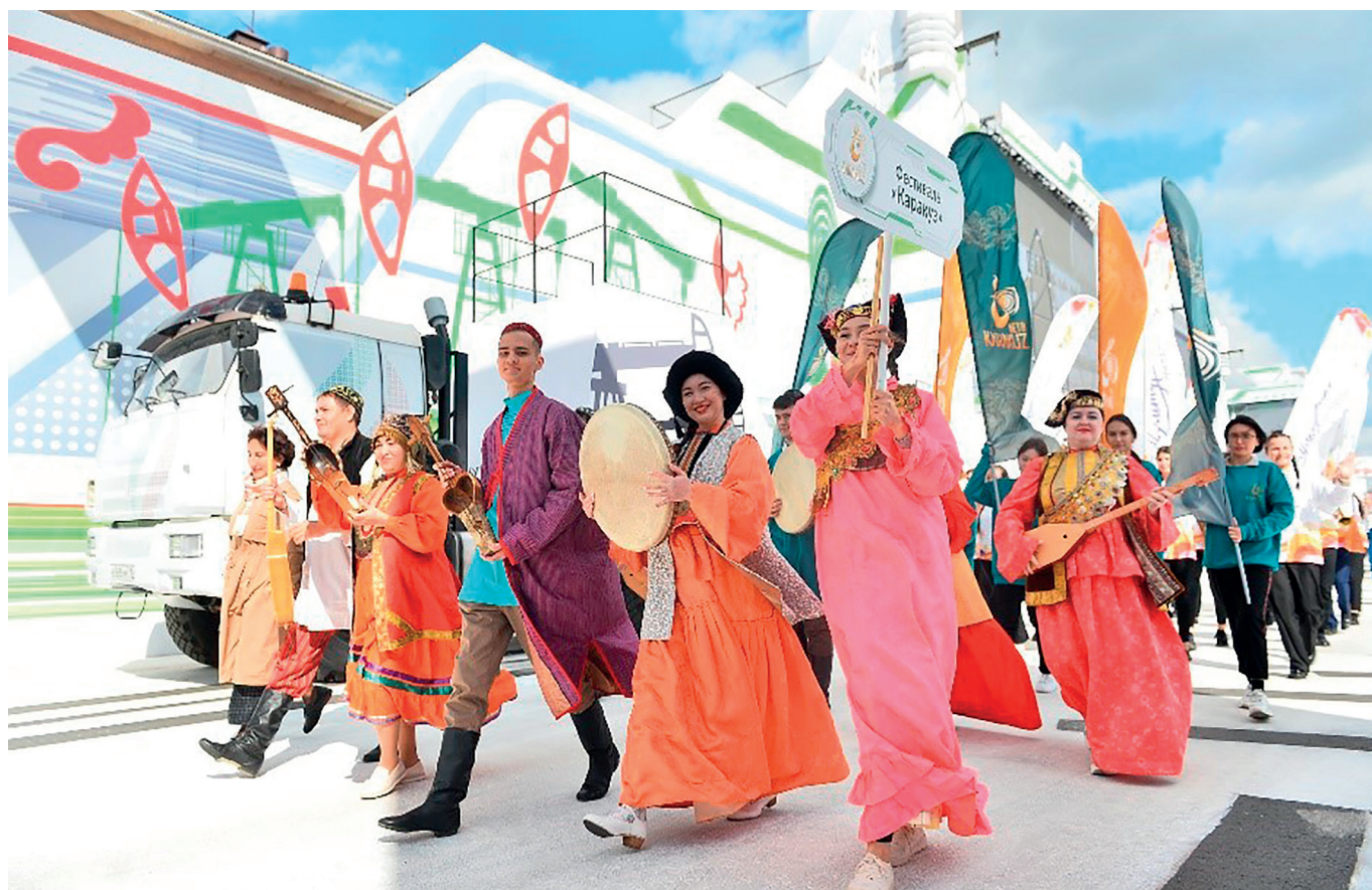
Этно-коллектив «Кадим Алмет» на фестивале «Каракуз»

1 июля 2022 года на базе Детской музыкальной школы № 2 им. В.И. Самойлова Альметьевского муниципального района при поддержке БФ «Татнефть» был создан