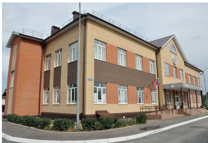
Здание Верхнеуслонской ДШИ