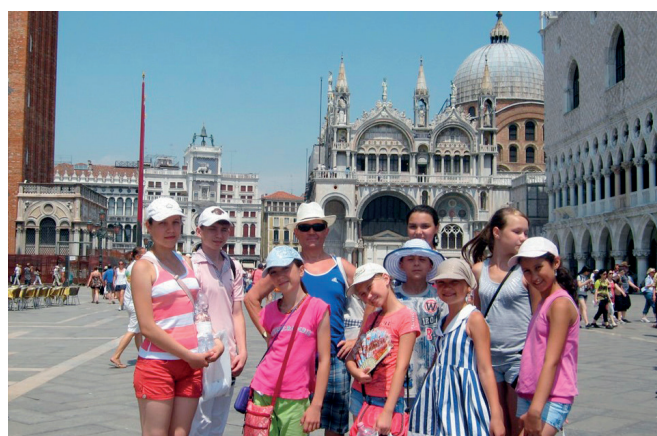
Ансамбль в Венеции

Репертуар ансамбля в основном состоит из чувашских и русских народных мелодий, звучат и мелодии других народов Поволжья; марийские, башкирские, мордовские, татарские.