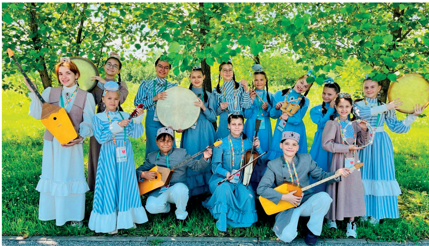
«Карлыгач» на II Всероссийской детской Фольклориаде

фестиваль детского и юношеского творчества «Страна поющего соловья», XI Республиканский фестиваль детских фольклорных коллективов «Моңлы тамчы» – «Звонкая капель», Международный фестиваль-конкурс детского и юношеского творчества «Ёлки», конкурс детского и юношеского творчества «Браво, Альметьевск!», Республиканский фестиваль-праздник народного творчества «Играй, гармонь!», Международный фестиваль-конкурс народного песенно-танцевального искусства «Казанское полотенце».