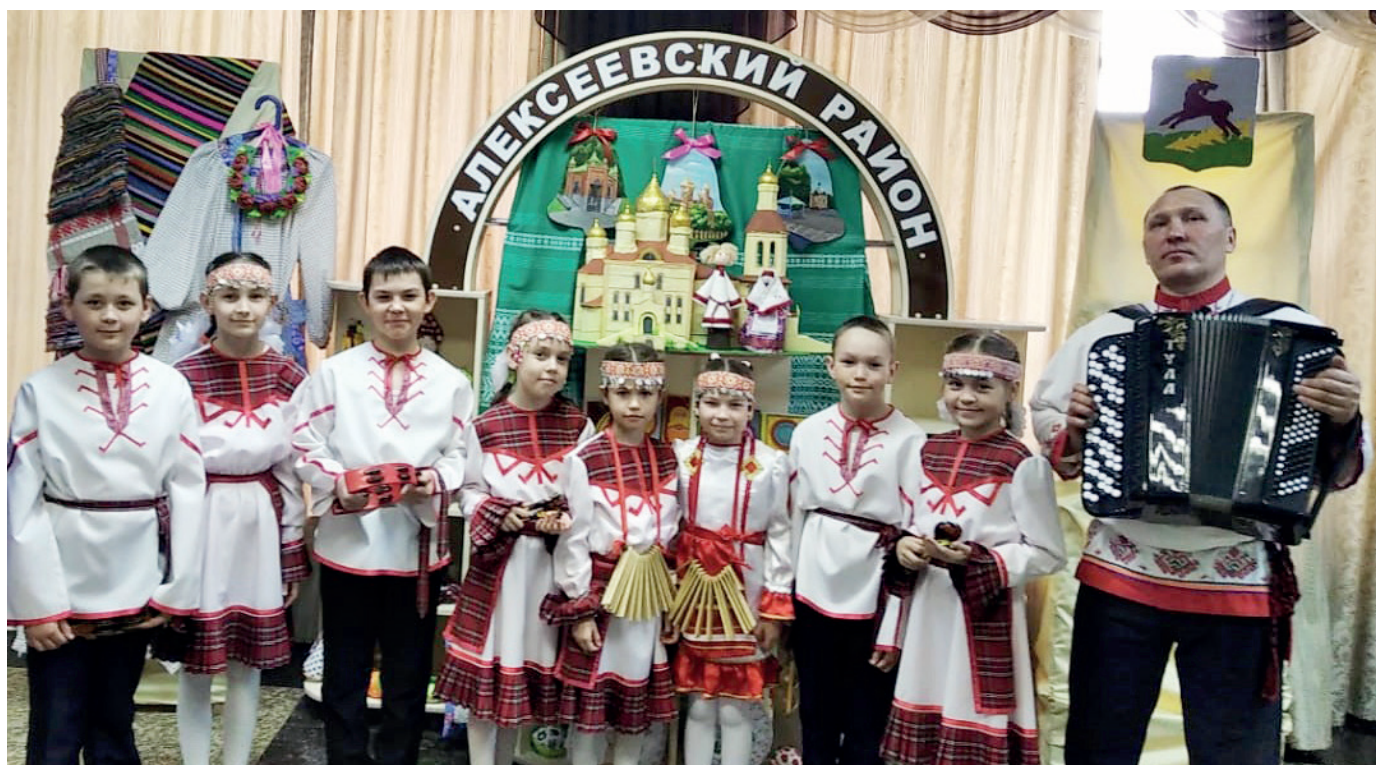
«Пилеш» на зональном этапе Республиканского конкурса «Без бергә»

Руководитель «Пилеша» обучает детей следующим приемам игры на двух ложках: