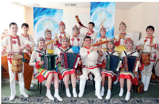
«Эревет» в Уфе (2016 г.)