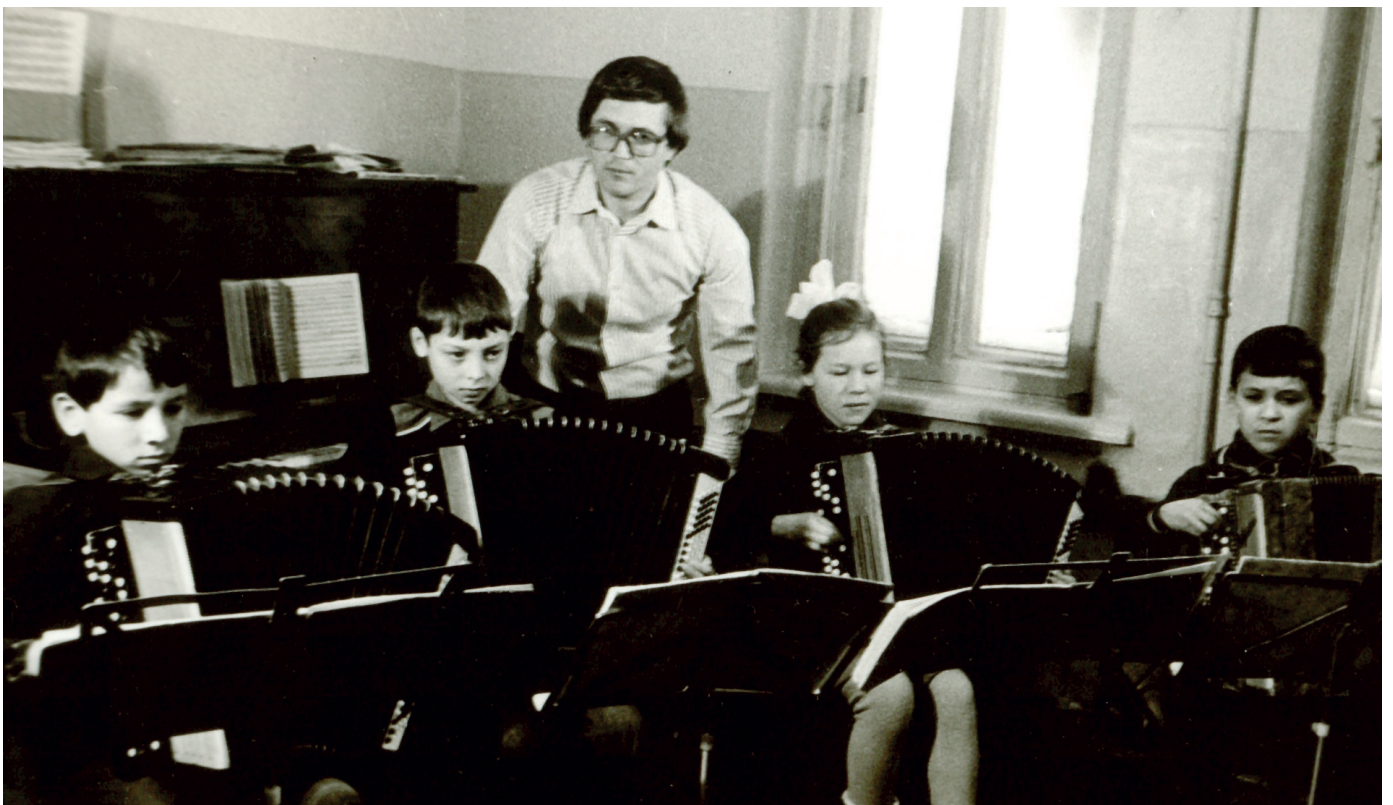
6 Первый состав «Эревет» (1982 г.)

Название «Эревет» появилось не сразу. Первоначально был кружок «Баян» (ведь тогда во Дворце из народных инструментов было только 4 баяна), учащиеся которого стали первыми исполнителями коллектива. Затем в процессе работы появилось название «Эревет», что в переводе означает «Чудо-краса». Первый состав ансамбля состоял из 9 учеников, на второй год число учеников возросло сразу вдвое и с каждым годом ансамбль расширялся.