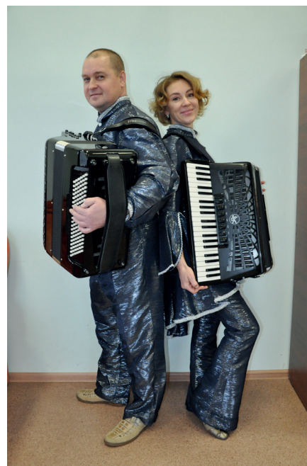
Наш семейный дуэт «Concordia»