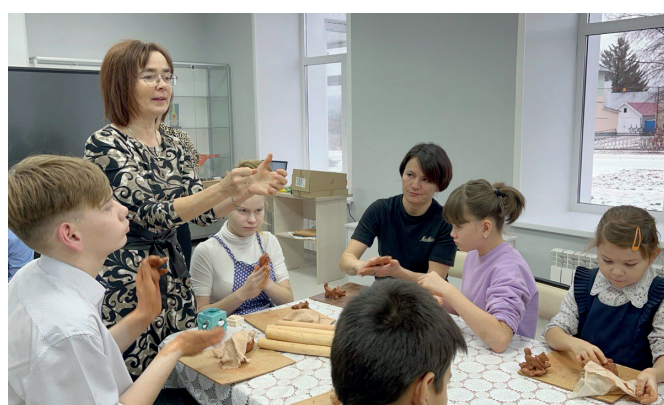
Интерактивное занятие «Сказ гончара» в коррекционных классах Сармановской гимназии

Работа с детьми с ОВЗ ведется круглый год. Причем мы работаем не только с детьми-инвалидами Сармановского района, но и проводим выездные мероприятия или приглашаем к себе воспитанников школ-интернатов Тукаевского и Муслюмовского районов.