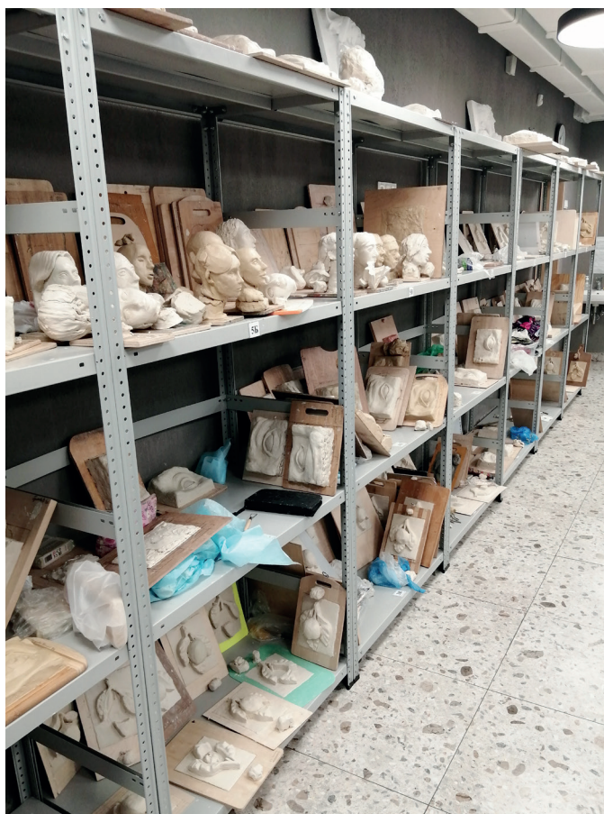
Наш учебный класс

В работе над скульптурой масса нюансов, которые надо учитывать. Например, как и в любом творчестве, особенно на начальных стадиях, нужно строго придерживаться этапности. Процесс создания скульптуры начинается с ее осмысления. Ни в коем случае нельзя приступать к работе, не зная и не чувствуя конечный образ.