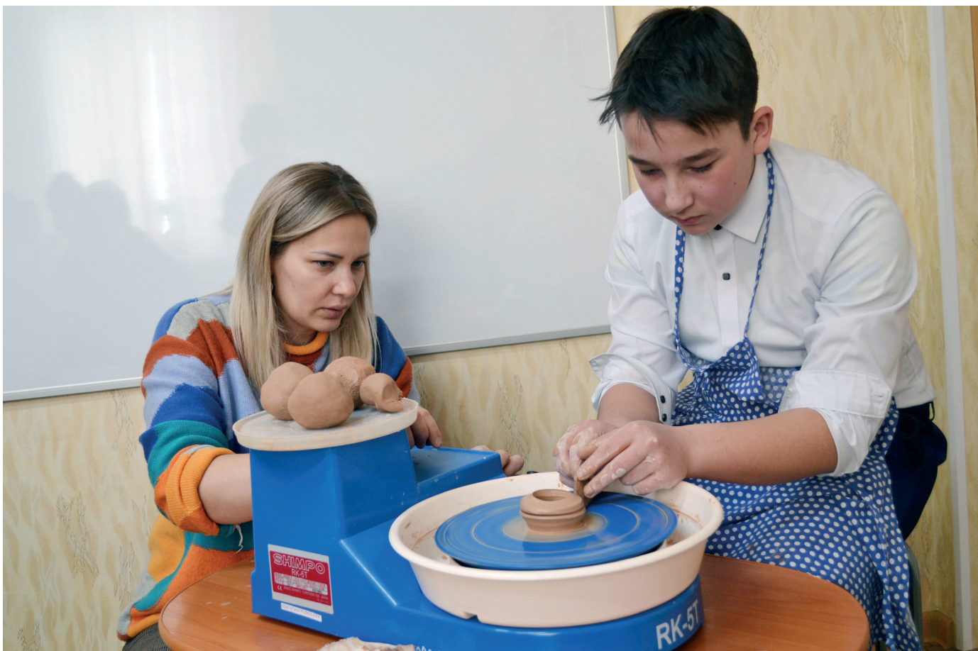
Занятие в Петровскозаводской СОШ