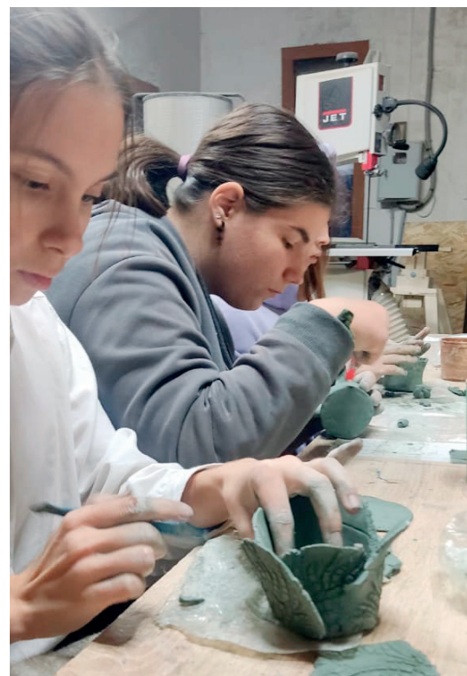
Изготовление вазы из глины в виде цветка