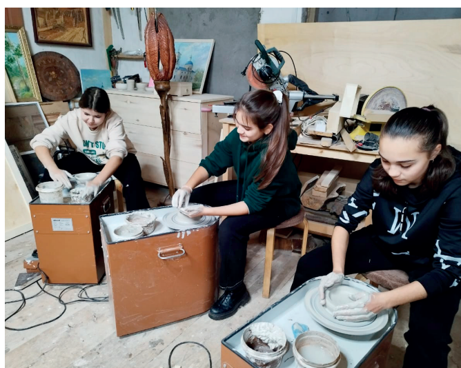
Мастер-класс по Пушкинской карте

В течение 2024 года было проведено 220 занятий по лепке и гончарному делу для детей и подростков, всего у нас побывало 1 760 человек. В летний период у нас занимается и много приезжих детей. Наши занятия можно посещать по Пушкинской карте, организуем мы и выездные мастер-классы.