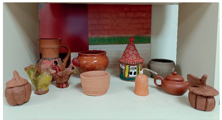
Выставки детских работ

В 2024 году мы одержали победу в первом конкурсе Фонда Президентских грантов с проектом «Подростковый клуб «Следопыт». Проект направлен на создание подросткового клуба для детей от 10 до 14 лет, в том числе для детей, находящихся в социально-опасном положении. Его участники с удовольствием посещают мероприятия, проводимые в клубе, пробуют свои силы в традиционных ремеслах, обучаются работать на ткацком станке, работают на гончарном круге, занимаются лепкой из глины, декорируют гончарные изделия, учатся их расписывать.