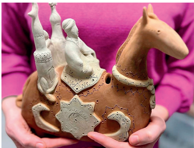
Копилка на Булгарскую тему