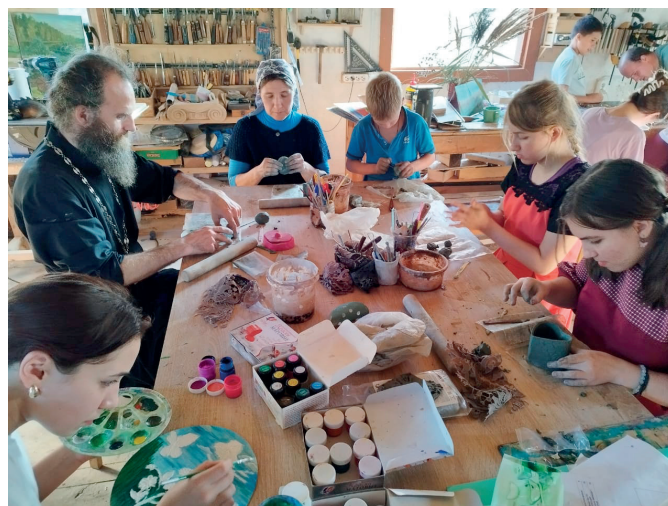
Мастер-класс по лепке и росписи для всей семьи

В выходные дни я провожу индивидуальные мастер-классы для взрослых. В Год семьи в нашей мастерской был успешно реализован проект «Семейные выходные».