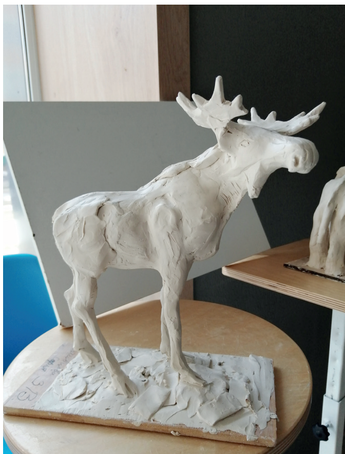
Работа Тимура Мухутдинова