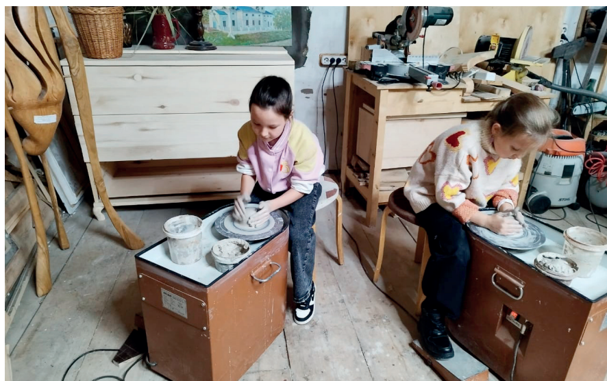
Работа на гончарном круге