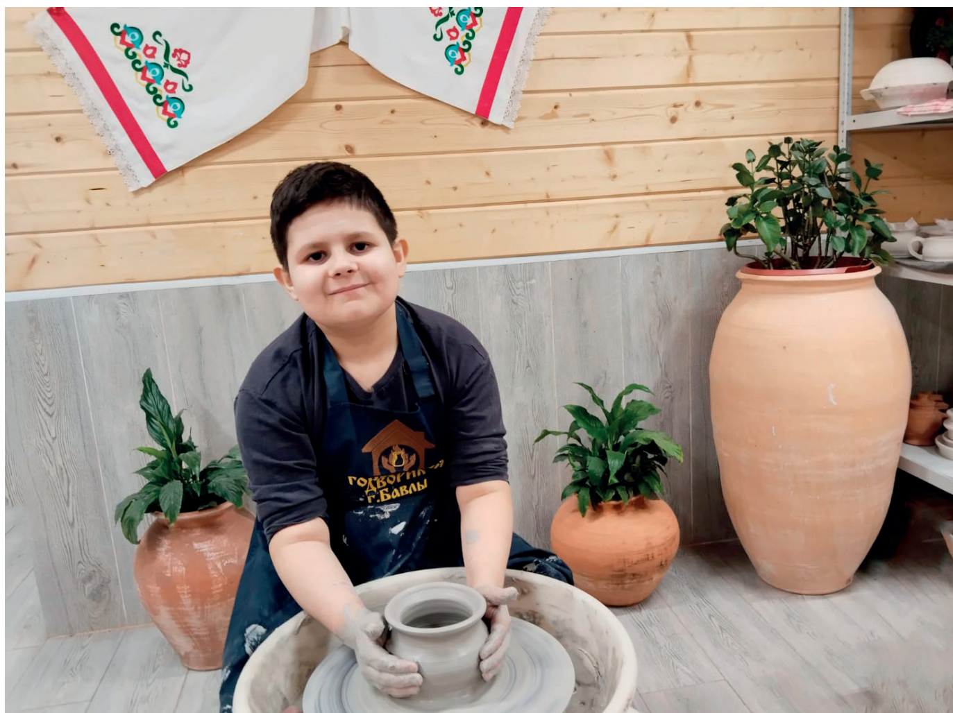
На занятии в мастерской «Гончарный дворик» (Бавлы)

Работа с глиной – один из методов арт-терапии, который направлен на сенсомоторное развитие детей. Благодаря занятиям развиваются координированные движения рук и тонкие движения пальцев, тактильные ощущения. Мелкая моторика, в свою очередь, необходима для развития важных психических функций – памяти, внимания, мыслительных способностей. Она помогает значительно улучшить речь, научиться концентрировать внимание и правильно его распределять.