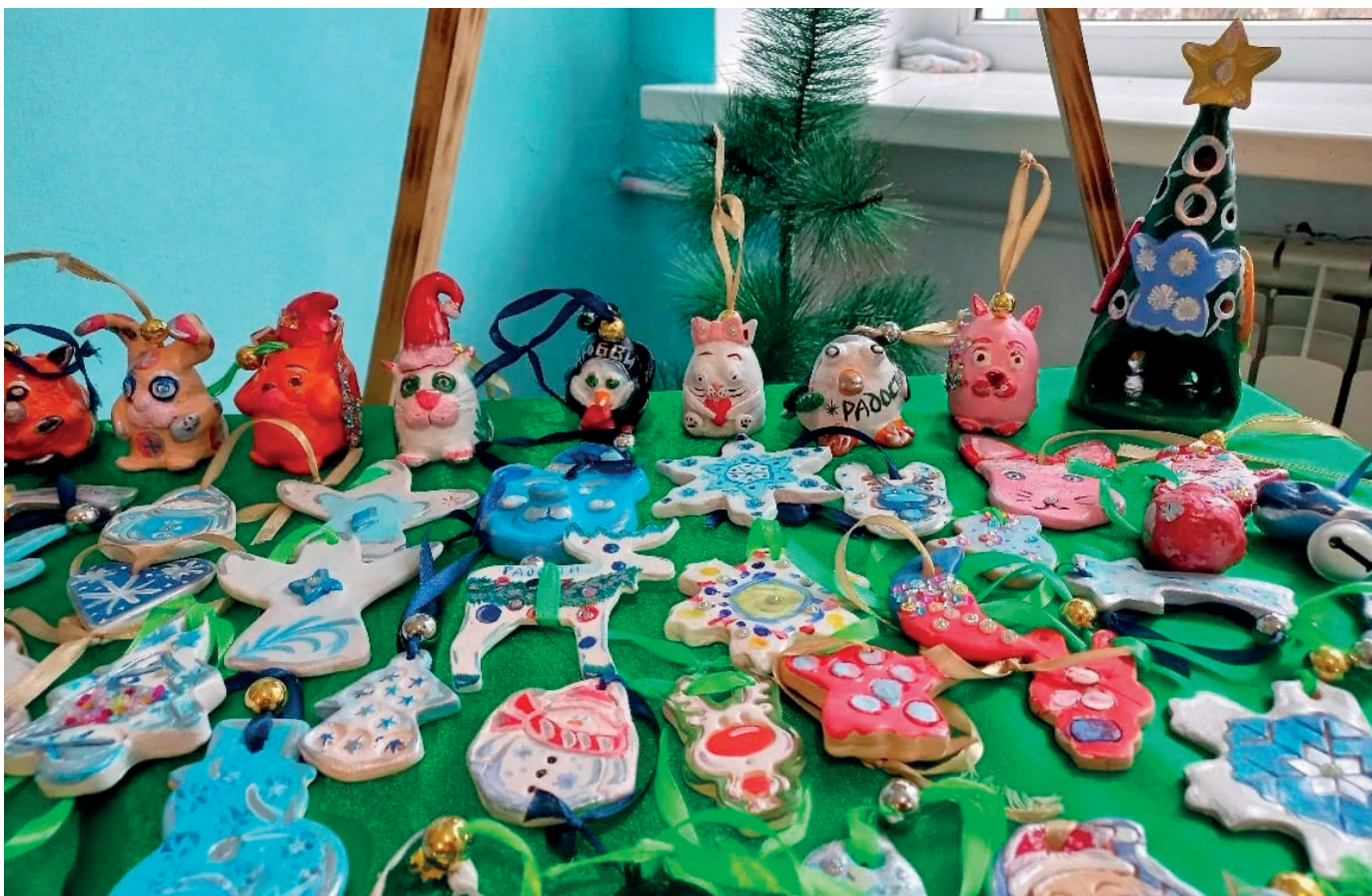
Новогодние игрушки, сделанные детьми

приходят, пробуют себя в творчестве. Кружок проводится 2 раза в неделю. Сформированы 2 группы: первая группа – 1-3 классы и вторая группа – частично из 3-го класса и 4 класс. Детей пришлось «перемешать», несмотря на возраст, а группы сформировать исходя из возможностей и развития каждого ребенка. Кружок был открыт по просьбе родителей, учителей и по своему желанию, так как в школе учатся трое моих детей и двое из них в начальных классах посещают кружок.