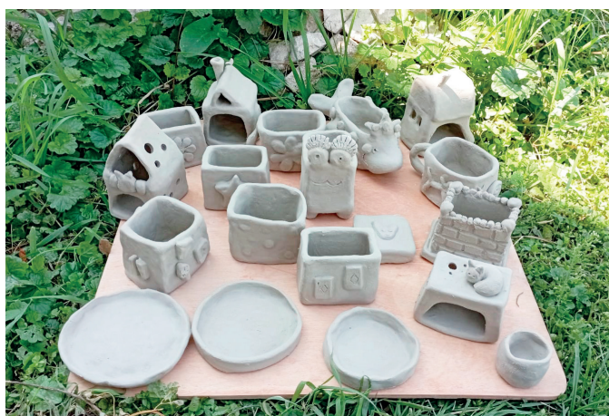
Изделия детей для благотворительной ярмарки в помощь участникам СВО

Продолжая самообразование, я выучилась на инструктора по нейрорлепке с различными пластичными материалами и разработала программу, в которой соединила художественную лепку из природной глины с нейрорлепкой из пластичных материалов. От «Станции детского (юношеского) технического творчества «Регата» устроилась работать на половину ставки в школу села Полянки обучать детей лепке из природной глины и других пластичных материалов с применением методики нейрорлепки.