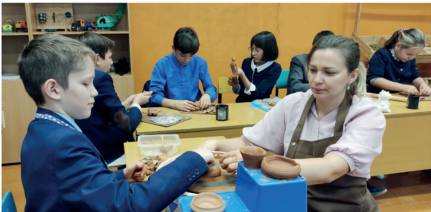
Занятие в Большенуркеевской СОШ