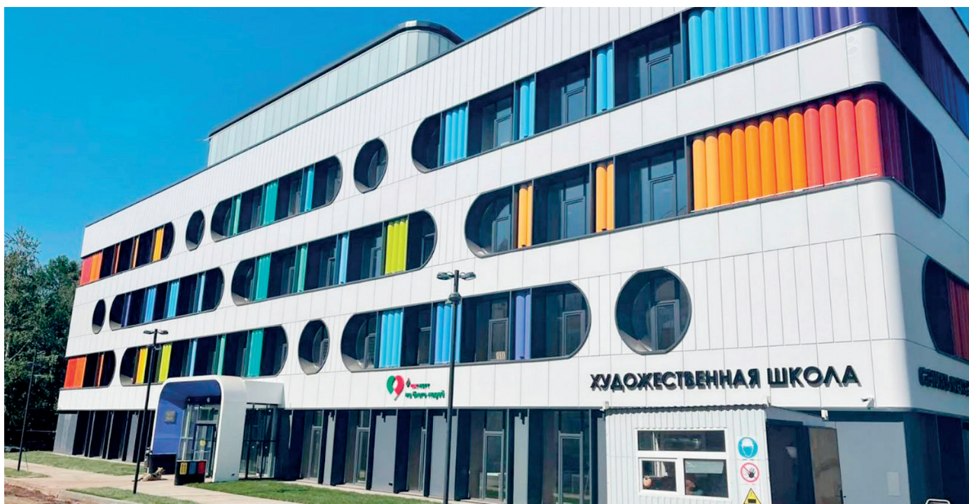
Детская художественная школа № 1 г. Альметьевск

Это шикарное здание с интересным дизайном в виде коробки с карандашами, с необычными окнами. На лужайке – статуи в греческом стиле.