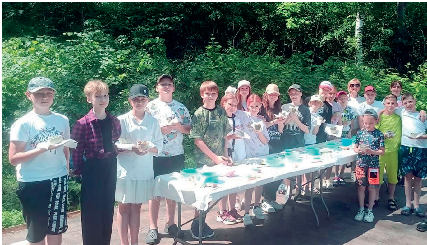
Мастер-класс по «Пушкинской карте»