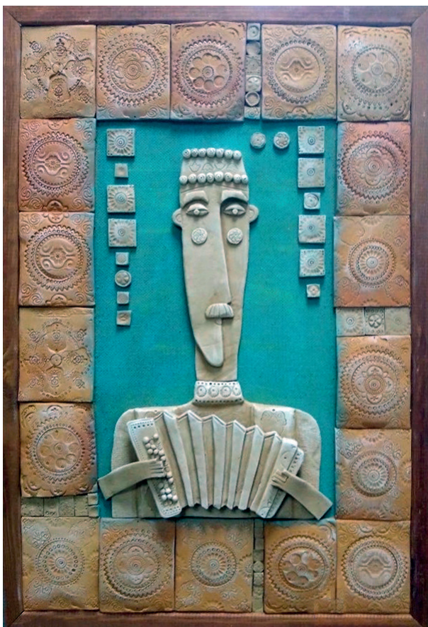
Диптих «Мәхәббәт» («Любовь»)