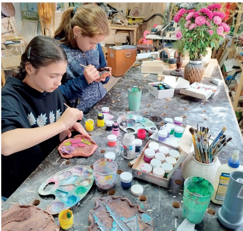
Роспись панно из глины