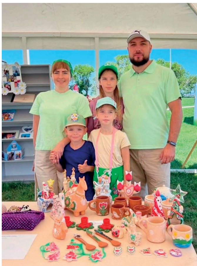
Всей семьей на фестивале

Сотрудничаю с районным Домом культуры города Болгар, в частности провожу мастер-классы по гончарному ремеслу по «Пушкинской карте».