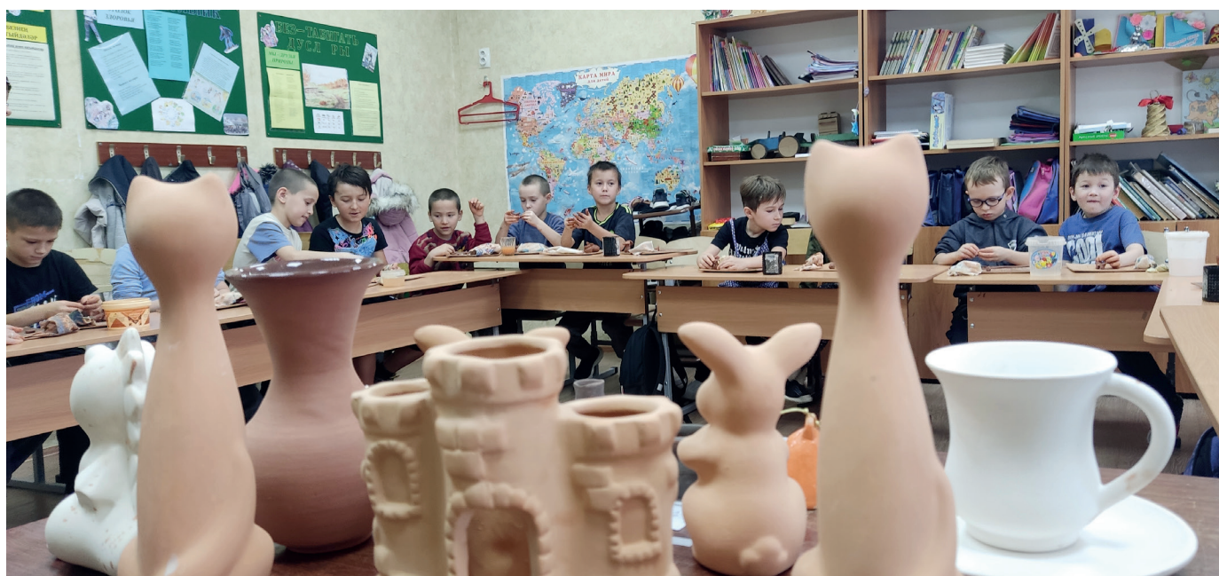
Занятие в пришкольном лагере Альметьевской СОШ имени М. Рамзи

Конечно, при реализации проекта мы столкнулись и с массой проблем. И в первую очередь, это нехватка площадей. Музей был очень маленький, занятия проводили в одной комнате площадью 12 кв.м., причем примерная продолжительность занятий полтора часа. А потом мы часа два отмывали помещение от глины, приходилось перестирать все салфетки, чистить кисточки и стеки, расставлять столы и стулья по местам. Каждый раз, поднимая с подсобки на второй этаж гончарный круг, мы завидовали тем, у кого большие площади, у кого можно создать творческие мастерские и вести занятия. И вот в 2024 году мы, наконец, переехали в новое здание, капитально отремонтированное за счет республиканских средств. В этом здании, построенном в 1960 году, располагалась типография и оно долгие годы пустовало. Общая площадь музея была 96 кв. м, а стала – 350 кв. м. Теперь занятия нашей творческой мастерской мы проводим уже в большом зале.