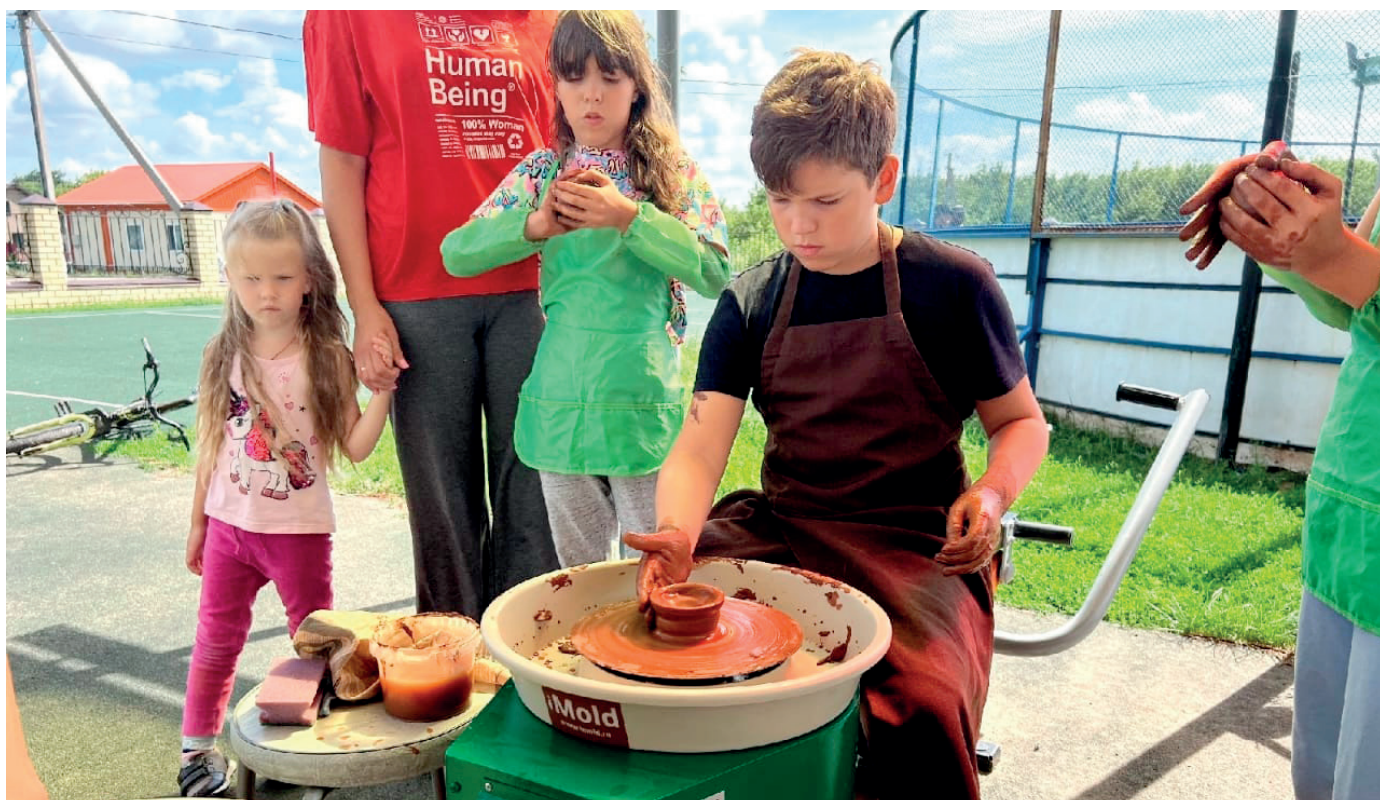
Выездной мастер-класс в селе Полянки

летнем лагере села Полянки, в Центре помощи семье и детям «Пеликан», на социально-туристических слетах «Спасского берега». В летнее время мы вместе с детьми села Полянки (вместе с теми, кто приехал на каникулы к бабушкам и дедушкам) изготовили различные сувениры, которые отправили на благотворительную ярмарку в помощь участникам СВО.