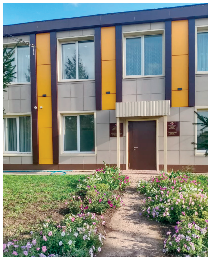
Здание Музея боевой славы «Гиндукуш»

Наряду с патриотическим воспитанием важным направлением деятельности