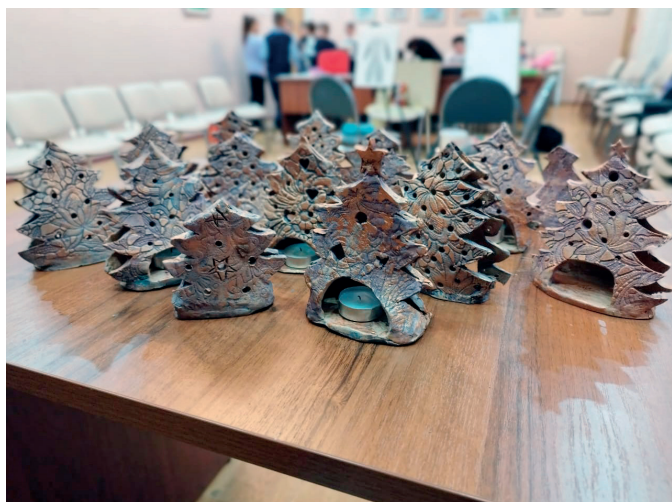
Работы детей. Елочники-подсвечники из глины

В течение 2024 года было проведено 220 занятий по лепке и гончарному делу для детей и подростков, всего у нас побывало 1 760 человек. В летний период у нас занимается и много приезжих детей. Наши занятия можно посещать по Пушкинской карте, организуем мы и выездные мастер-классы.