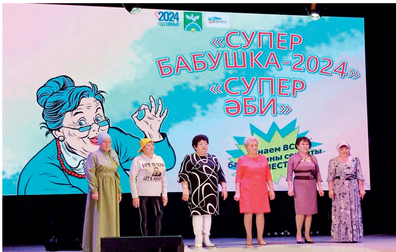
Общая фотография конкурсанток