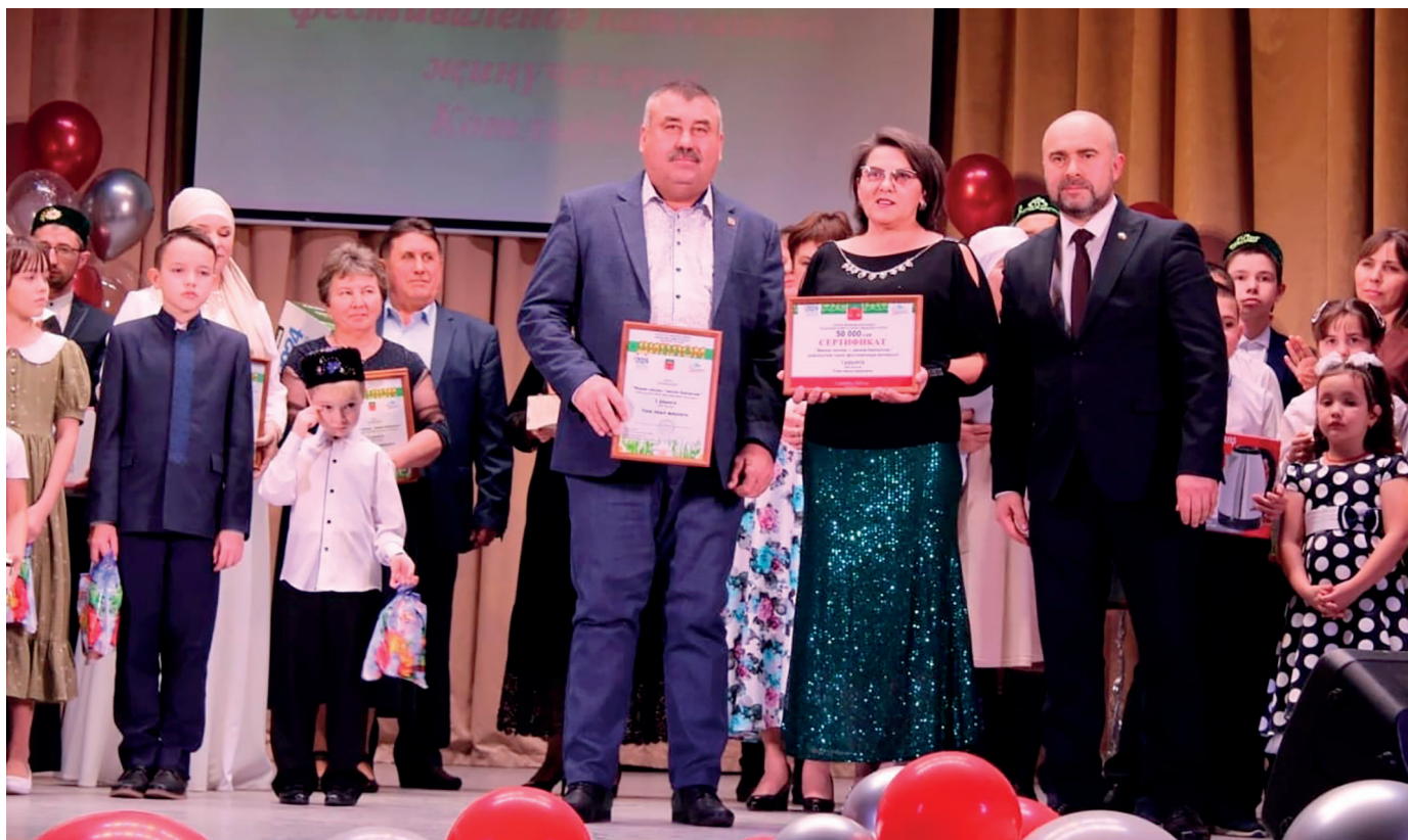
Награждается Узьякское сельское поселение, занявшее 1-е место в фестивале