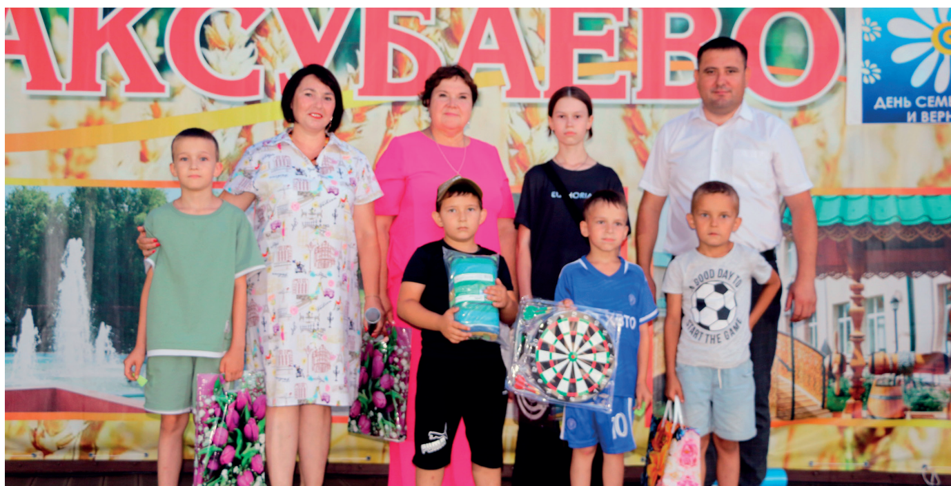
Награждение победителей акции «Секреты крепкой семьи»

только научились танцевать такие виды танцев как «вальс», «ча-ча-ча», «самба», народные танцы, но и укрепляли свое здоровье, находили новые знакомства, общались и наслаждались атмосферой творчества.