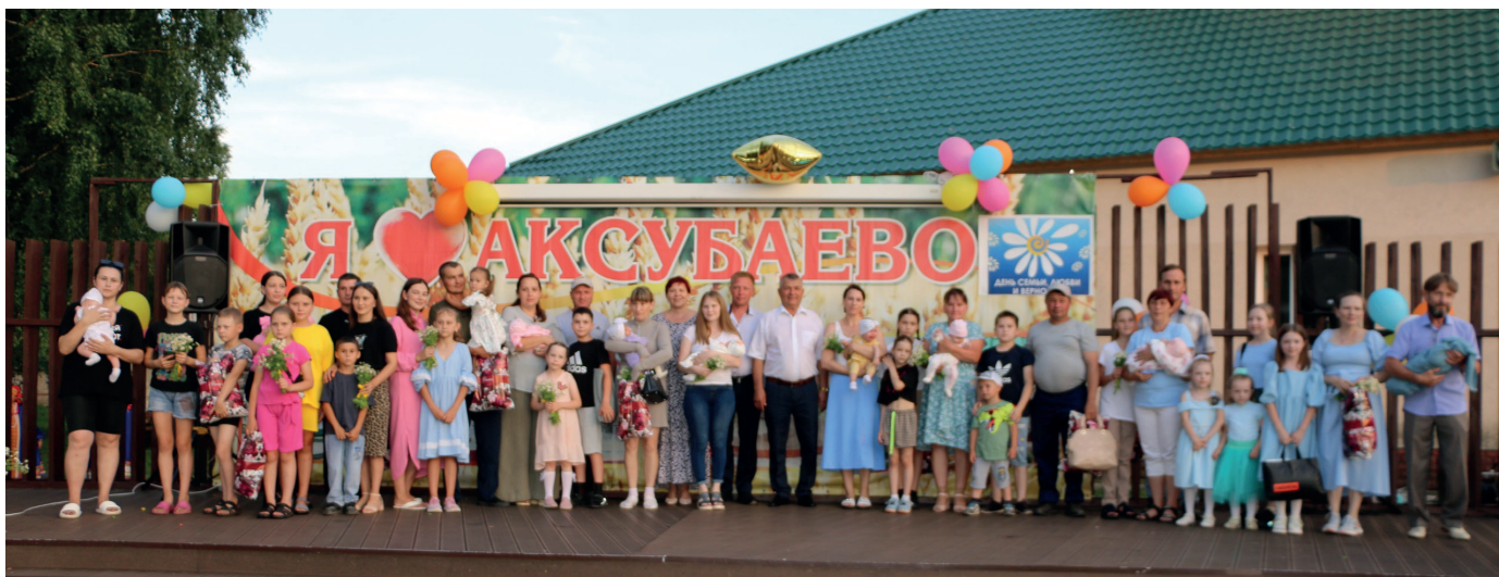
Награждение многодетных семей

В ходе мероприятия также награждены многодетные семьи, родившие третьих и последующих детей и зарегистрировавшие рождение ребенка в отделе ЗАГС Аксубаевского района в 1-ом полугодии 2024 года.