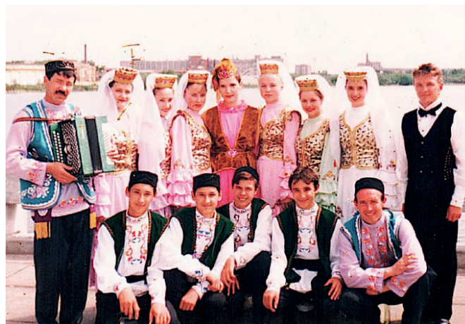
«Уйнагыз, гармуннар!». 1998 г.

Работал старшим методистом, затем 10 лет директором районного Дома культуры. Я был солистом фольклорного ансамбля «Мөслим тугайлары», певцом, танцором, артистом народного театра. В 1994 году завоевал звание лауреата конкурса «Татар жыры». В 2011 году стал начальником отдела культуры. С апреля 2022 года был назначен на должность руководителя Исполнительного комитета Муслюмовского муниципального района.