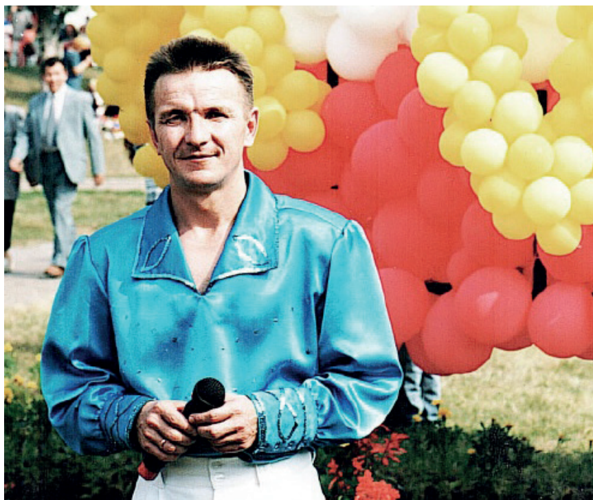
ВДНХ. Казань. 1993 г.