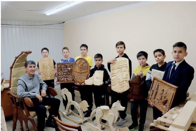
Осваиваем резьбу по дереву

Ежегодно учащиеся школы искусств становятся лауреатами и обладателями гран-при различных конкурсов, фестивалей, выставок, олимпиад, среди них: республиканские конкурсы народного творчества «Наш дом – Татарстан», «Ватан», «Арча ягы – данлы Тукай ягы», конкурсы: гармонистов им. Ф.Туишева, баянистов им. Р. Курмашина, пианистов им. Н. Жиганова, исполнителей на духовых инструментах им. Э. Бакирова, «Зимняя палитра», «Камская мозаика», «Малые города», «Тат-ARS-Тан», «Созвездие-Йодызлык», «Иске-Казан түгәрәк уены», «Я рисую как Шишкин», теоретические олимпиады, конкурсы творческих работ, межрегиональные фестивали-конкурсы «Чулпан», «Рамазан», «Моңчишмәсе», «Шома бас», «Халкым мирасы», всероссийские конкурсы чтецов, пианистов «Энжеләр», «Этномириада», «Золотой башмачок», «Морозко», «Рождественская сказка», «Обаятельный Шурале», «Играй, мой баян», «Виват, домра! Виват, балалайка!», международные конкурсы «Живой родник», «Viva-Music», «Содружество талантов», «Art-форум», «На крыльях таланта», «Виктория», «Феерия аккордеона», «Кубок пятерых» и другие. Суммарно только в прошедшем учебном году юные таланты стали участниками 84 конкурсов и фестивалей различного уровня, завоевав 521 награду.