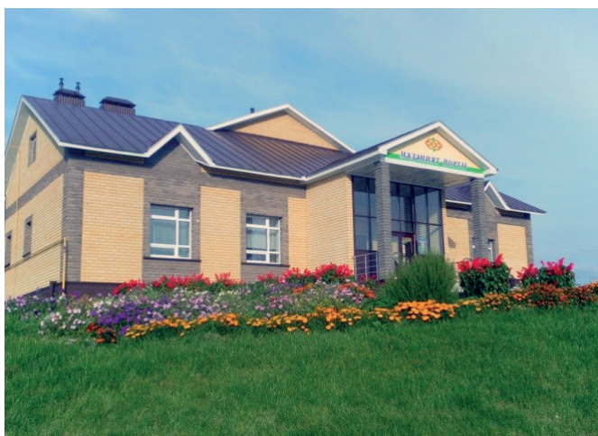
22 Современное здание Нижнеберескинского СДК

Гордятся жители деревни Нижняя Береске и своим Домом культуры, который является сердцем и душой села. Нижнеберескинский сельский клуб был введен в эксплуатацию в 1930 году. В 1963 году Дом культуры был укомплектован новым кинооборудованием, и стал излюбленным местом проведения свободного времени жителей деревни. Долгое время клуб располагался в старом здании мечети, в 2012 году для него было построено новое здание.