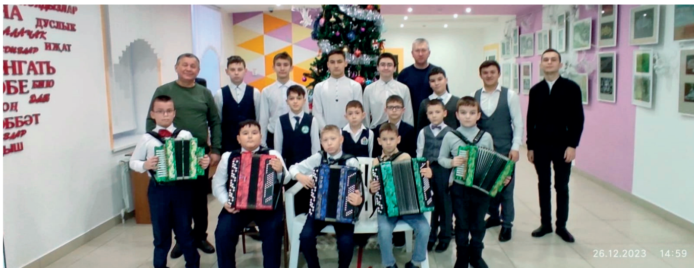
Обучающиеся игре на народных инструментах