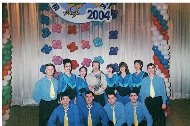
Команда КВН «Чуерташ». 2004 г.