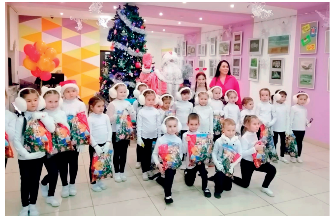
Учащиеся подготовительного отделения

Ежегодно учащиеся школы искусств становятся лауреатами и обладателями гран-при различных конкурсов, фестивалей, выставок, олимпиад, среди них: республиканские конкурсы народного творчества «Наш дом – Татарстан», «Ватан», «Арча ягы – данлы Тукай ягы», конкурсы: гармонистов им. Ф.Туишева, баянистов им. Р. Курмашина, пианистов им. Н. Жиганова, исполнителей на духовых инструментах им. Э. Бакирова, «Зимняя палитра», «Камская мозаика», «Малые города», «Тат-ARS-Тан», «Созвездие-Йодызлык», «Иске-Казан түгәрәк уены», «Я рисую как Шишкин», теоретические олимпиады, конкурсы творческих работ, межрегиональные фестивали-конкурсы «Чулпан», «Рамазан», «Моңчишмәсе», «Шома бас», «Халкым мирасы», всероссийские конкурсы чтецов, пианистов «Энжеләр», «Этномириада», «Золотой башмачок», «Морозко», «Рождественская сказка», «Обаятельный Шурале», «Играй, мой баян», «Виват, домра! Виват, балалайка!», международные конкурсы «Живой родник», «Viva-Music», «Содружество талантов», «Art-форум», «На крыльях таланта», «Виктория», «Феерия аккордеона», «Кубок пятерых» и другие. Суммарно только в прошедшем учебном году юные таланты стали участниками 84 конкурсов и фестивалей различного уровня, завоевав 521 награду.