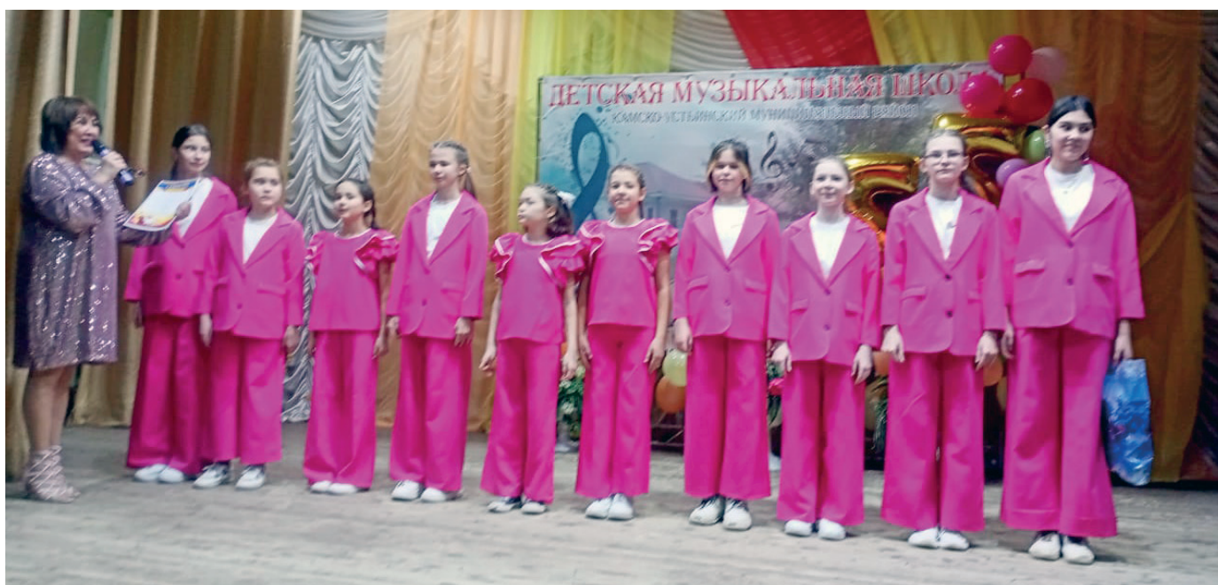
Детский ансамбль «Радуга»