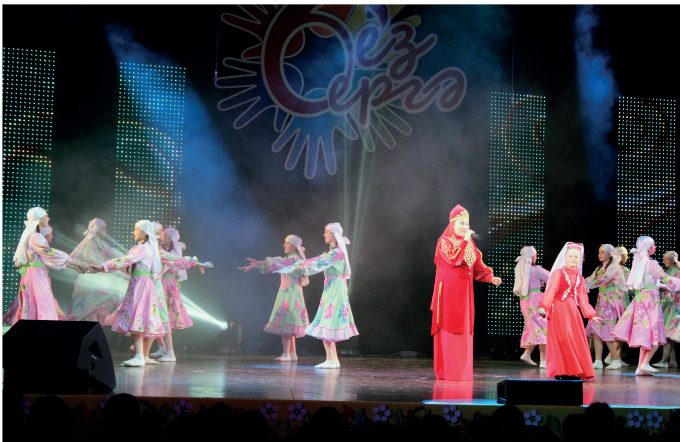
На фестивале «Без берег»

За активное участие преподаватели и учащиеся детской музыкальной школы награждаются почетными грамотами и нагрудными знаками Министерства образования и науки РТ, Министерства культуры РТ, благодарственными письмами Камско-Устьинского муниципального района РТ.