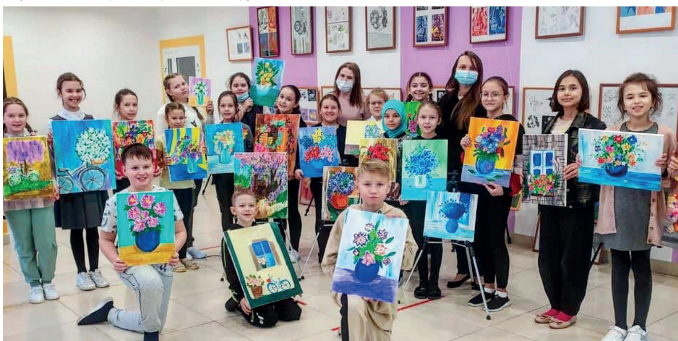
Наши юные художники