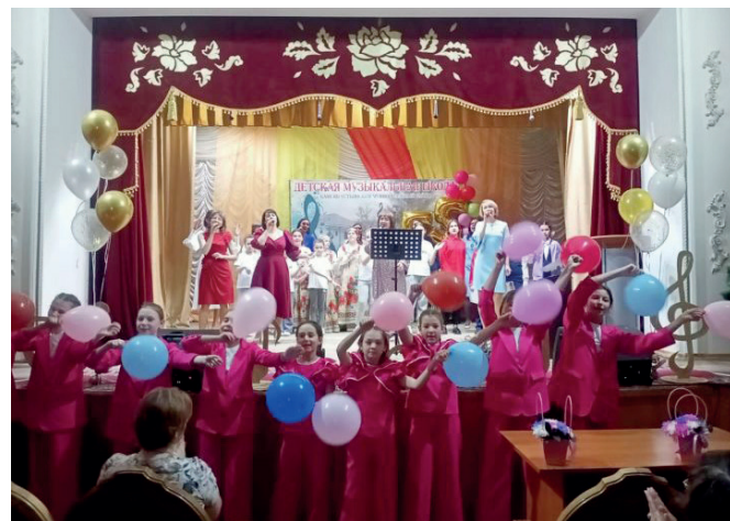
Наш яркий юбилей

55 лет для школы – немалый срок. Сколько событий, дел и свершений вместили эти годы. На юбилейном вечере мы вспоминали историю школы, ветеранов-педагогов, которые отдали все самое лучшее и доброе нашей музыкальной школе, и конечно, звучало много музыки в исполнении педагогов, учащихся, выпускников.