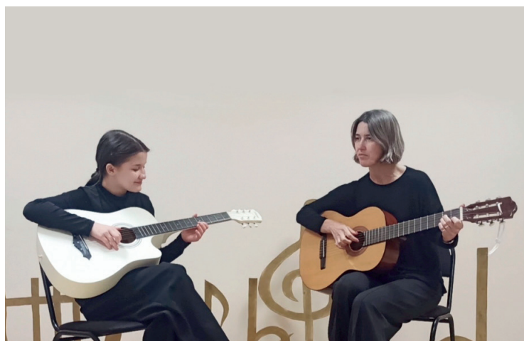
Ансамбль «Звонкая гитара» – дипломант III степени

В конкурсе участвуют инструментальные ансамбли, трио, вокальные дуэты в составе педагог-ученик, ученик-ученик. На конкурс в качестве зрителей приглашаются учащиеся общеобразовательной школы, родители. На конкурсе исполняются произведения советских и зарубежных композиторов, из мультфильмов и кинофильмов, из балета и мюзиклов, музыка композиторов классиков, народная музыка. По итогам конкурса определяются победители, всем участникам вручаются дипломы.