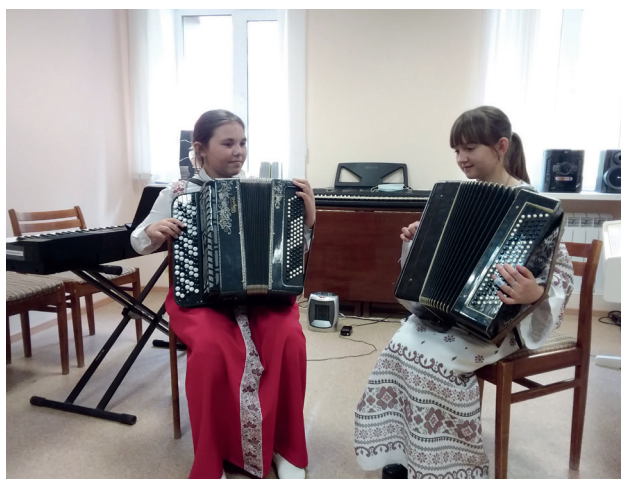
Ансамбль «Раздолье» – дипломант II степени