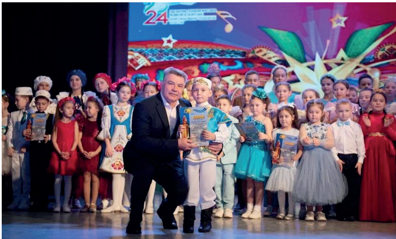
Награждение победителей районного конкурса-фестиваля эстрадного искусства «Арча йолдызлары – 2024».

За последние годы школа искусств стала обладателем 7 грантов Правительства РТ, Президентского фонда культурных инициатив, вошла в число 100 лучших организаций дополнительного образования России в рамках Всероссийского форума «Школа будущего», признана лучшей детской школой искусств в рамках Всероссийской конференции «Инновации в образовании и воспитании» г. Санкт-Петербург.