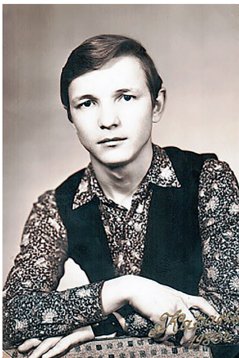
В годы учебы в КГИК. 1983 г.