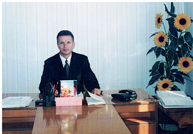
Рабочий кабинет РДК. 2005 г.

Сохранить народное творчество, самобытность фольклора, танца, а изменить кадровый состав работников культуры. Сейчас у нас в районе сплоченная профессиональная, креативная, трудолюбивая, преданная своему делу команда работников культуры.