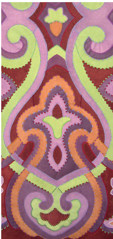
С. Кузьминых. Фрагмент панно «Кушлауч» из триптиха «Посвящение Г. Тукаю». 2011. ГМИИ РТ