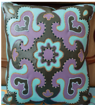
Техникум народных художественных промыслов. Диванная подушка. Курс А. Сибгатуллиной