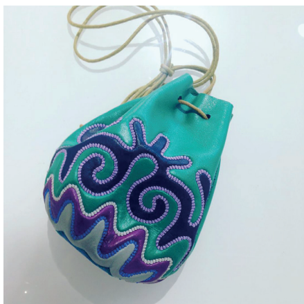
ООО «Сахтиан». Сумочка «Янчык». 2010-е гг.