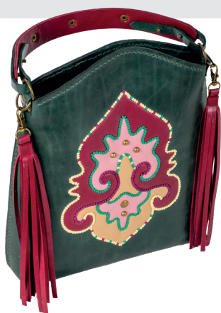
А. Садриева. Сумочка «Каеф». 2020