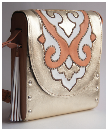
А. Мусавирова. Сумочка из комплекта «Алтын». 2016