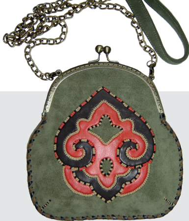
А. Замилова. Сумочка. 2016