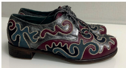
ООО «Сахтиан». Женские туфли. 2010-е гг.