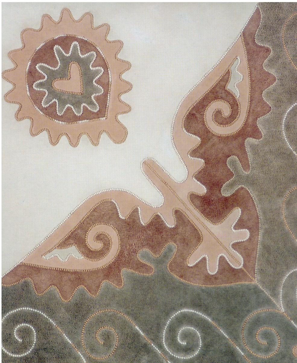
Н. Кумысникова. Панно «Весна». 2005

На обл.: 1 – И. Гайнутдинов, А. Артемьева. Фрагмент панно «Древо жизни». 2010; 2 – Фрагмент узора из кожаной мозаики. Начало XX в.