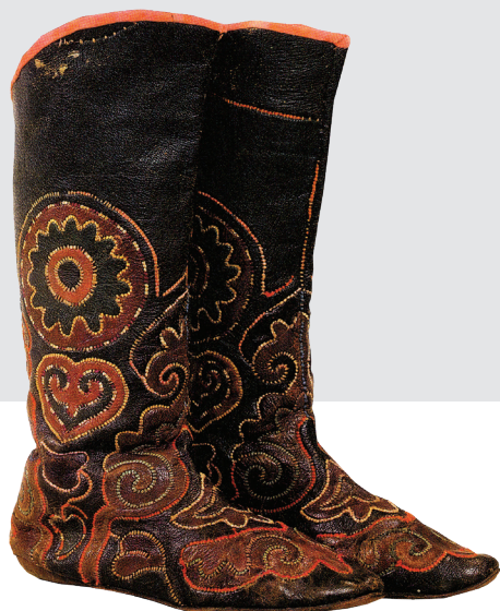
Сапоги – ичиги. XIX в. ГМИИ РТ