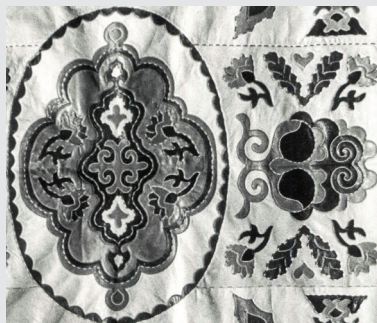
Фрагмент мозаичного кожаного ковра. Арский промысел. 1920-е гг.