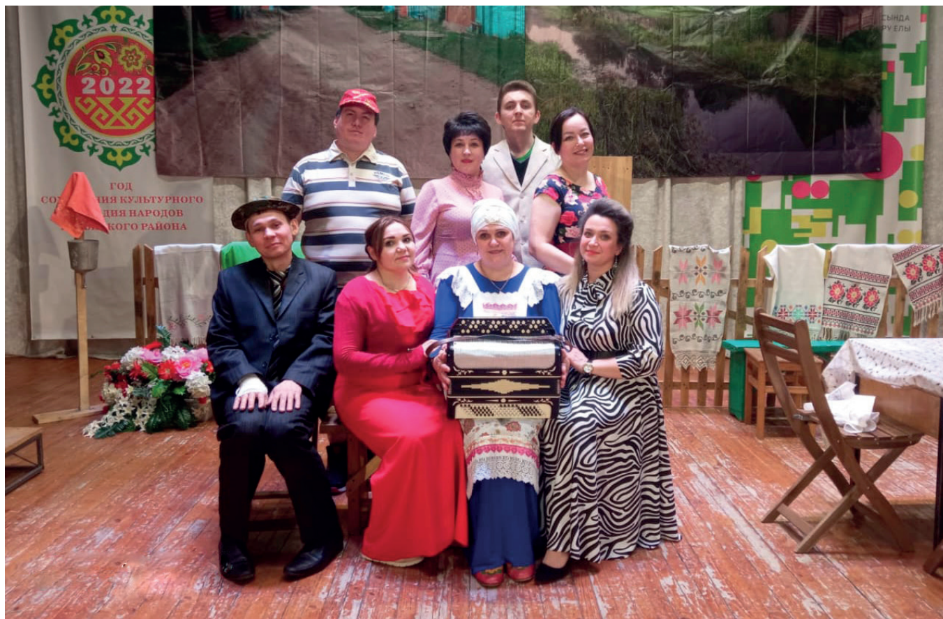
Сцена из спектакля по пьесе Наиля Гаетбая «Авылга кызлар килде»