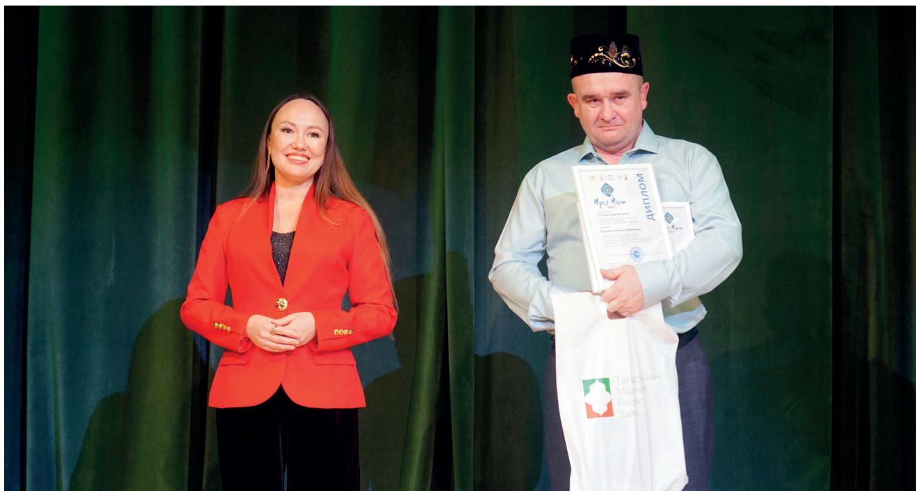
Вручение Диплома лауреата в номинации «Лучшая мужская роль»