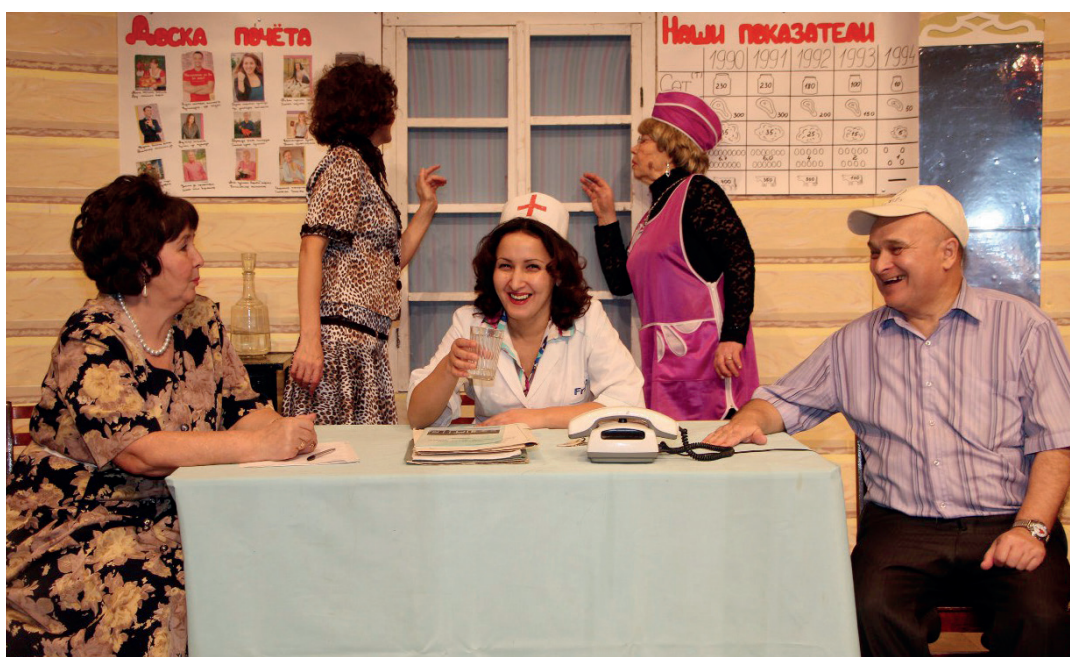
В роли медсестры в спектакле Амануллы «Йонлы кеше»

кызлар» (Тази Гиззат), (2016); Сона в «Ханума» (Авксентий Цагарели), 2022; Минлекай в «Айгөл иле» (Мустай Карим), 2023.