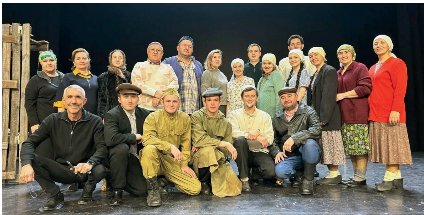
Артисты народного театра «Алтын битлек» после спектакля «Сагынган чакларымда» на XXV Межрегиональном конкурсе театральных коллективов «Идел-Йорт» имени Ш. Закирова

коллективе одно удовольствие. Спасибо директору Дома культуры, режиссерам, членам моей огромной и дружной театральной семьи. Огромная благодарность и моей семье за понимание, за создание условий для моего увлечения. ■