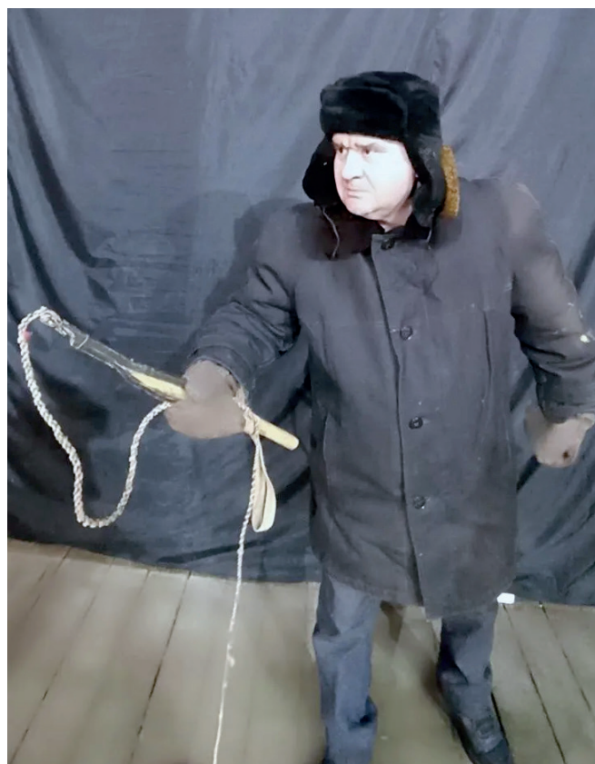
В роли Хамита