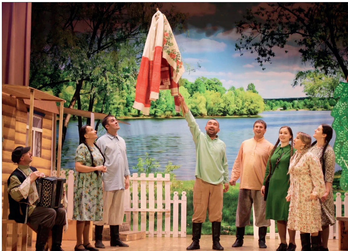
Сцена из спектакля «Чиккән кульяулык» («Рамай») народного театра Рыбно-Слободского районного Дома культуры

XXV Межрегиональный конкурс театральных коллективов «Идел-Йорт» имени Шамиля Закирова