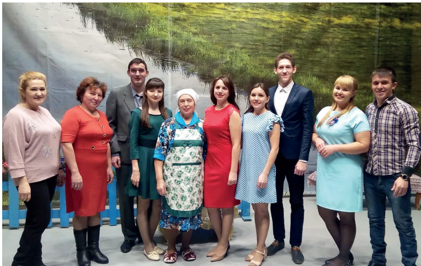
Участники спектакля «Авылга кызлар килде яки моңнар кайтсын авылга»

Все события в спектакле разворачиваются у Родника любви. С древних пор этот родник был свидетелем многих событий. Здесь проводились танцевальные вечера, здесь же молодые люди влюблялись, давали клятвы в вечной любви. Вот и Ромео и Джульетта деревни – Ляйсан и Ильнар встречаются у родника. По традиции здесь же они признаются в любви и дают обещание любить друг друга вечно. Но у любви свои испытания и свои правила. В деревню приезжает медсестра Айсылу и Ильнар уходит к ней. Но Айсылу умирает и вновь