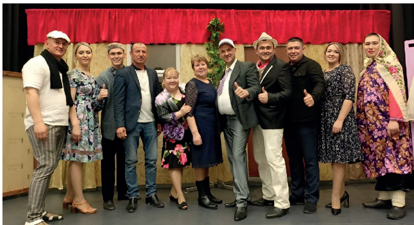
Участники спектакля «Әлепле артистлары»