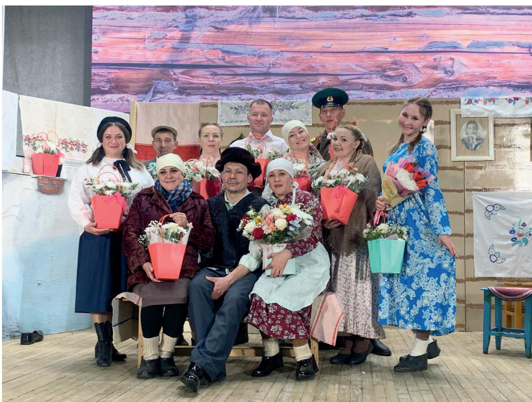
Участники спектакля «Ана хөкеме» по пьесе Ангама Атнаба- ева