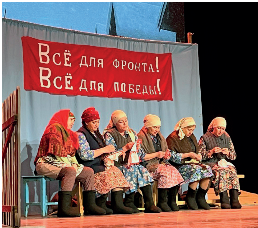
Сцены из спектакля «Тол хатыннар, тол кызлар»