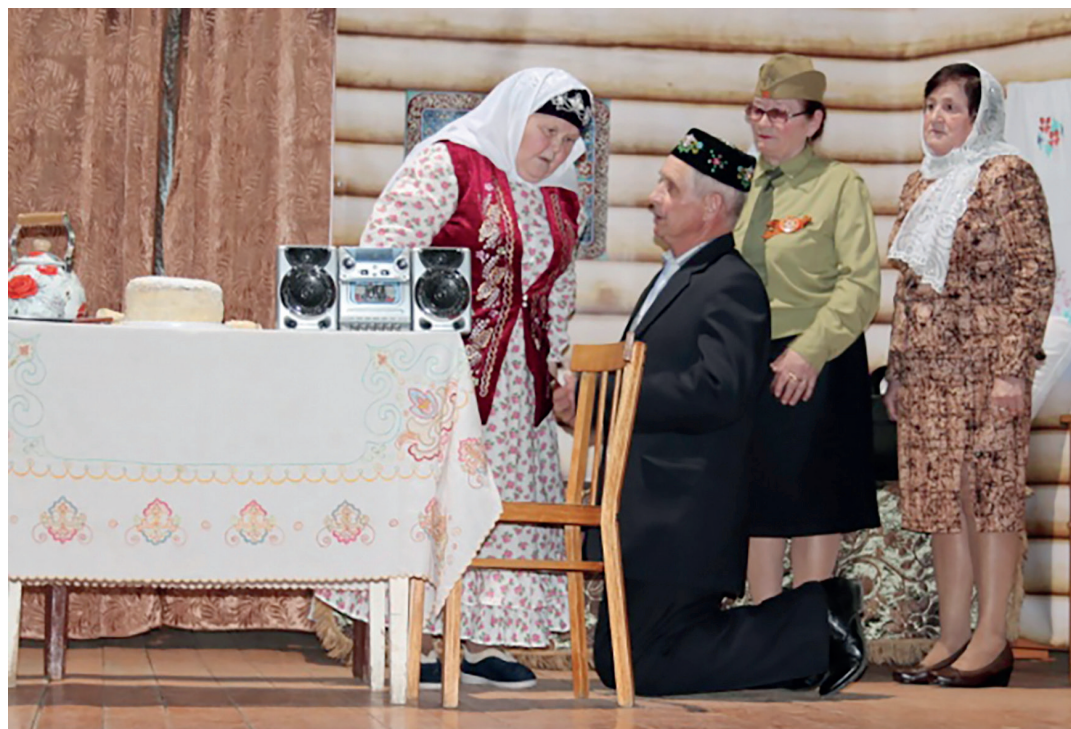
Сцена из спектакля «Улларым»

«Сынган беләзек», Рашида Зиганшина «Улларым», Роберта Миннуллина «Әниләр һәм бәбиләр», Данила Салихова «Кызлар капкыны», Фоата Садриева «Безнең авылның кызлары», Аманулла «Әлепле артистлары».