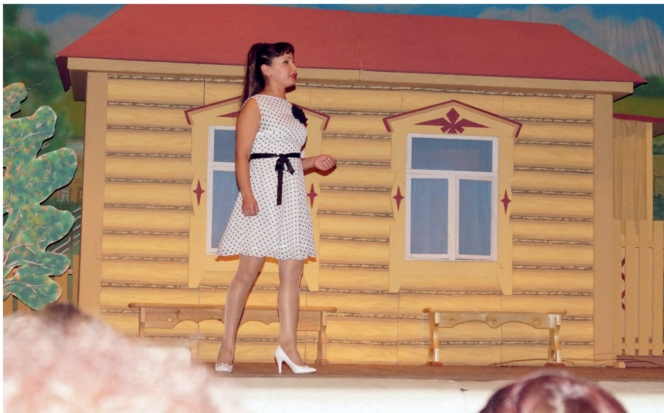
В спектакле Туфана Миннуллина «Гөргери кияүләре»