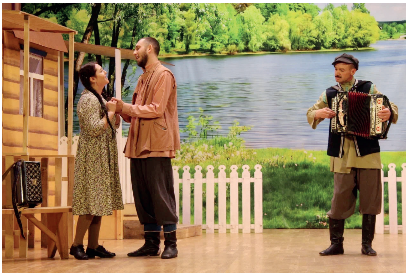
Сцены из спектакля «Чиккэн кулъяулык» («Рамай»)

4 декабря как обладатели Гран-при республиканского этапа XXV Межрегионального конкурса театральных коллективов «Идел-Йорт – 2025» имени Шамиля Закирова поставили спектакль в Восточном зале Татарского государственного Академического театра имени Галиасгара Камала.