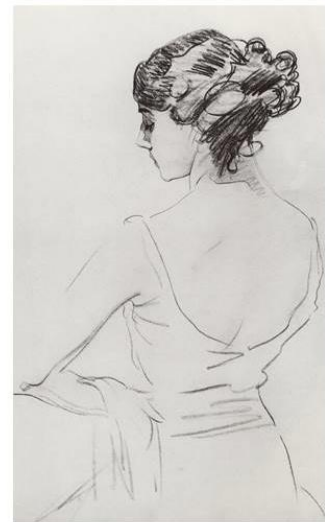
Портрет балерины Т.Карсавиной

Баки Урманче много работал над портретом, пейзажем, национальной темой; также он работал над графическими техниками: рисунком, офортом книжно-журнальной иллюстрацией. Он сумел все разнородные художественные влияния, которым он подвергся в годы учебы, переплавить в индивидуальный художественный стиль. Одной из главных черт произведений Б. Урманче исследователи считают их ярко выраженную национальную принадлежность.