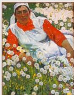
1. «Марзия и одуванчики», 1973 г., Картон, холст, масло.