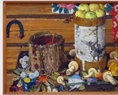
4. «Щедрый август», 1989 год, холст, масло,