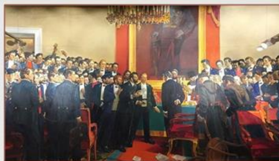
2. «В.И.Ульянов-Ленин. на студенческой сходке в Казанском университете в 1887 году» Холст, масло. 1975-1987 гг.