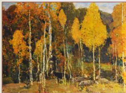
3. «Осеннее кружево», 1960-е годы, холст, масло.